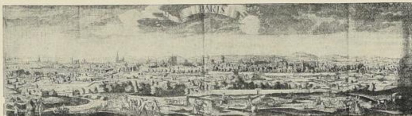
Fig. 58. — Paris au XVII e siècle.