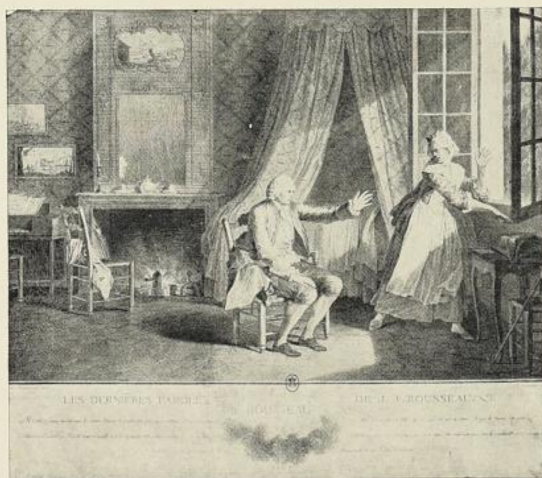
Fig. 232. — Les derniers moments de Jean-Jacques Rousseau.

Auslieferung nur für Deutschland, Osterreich-Ungarn, Skandinavien und die Balkanstaaten.