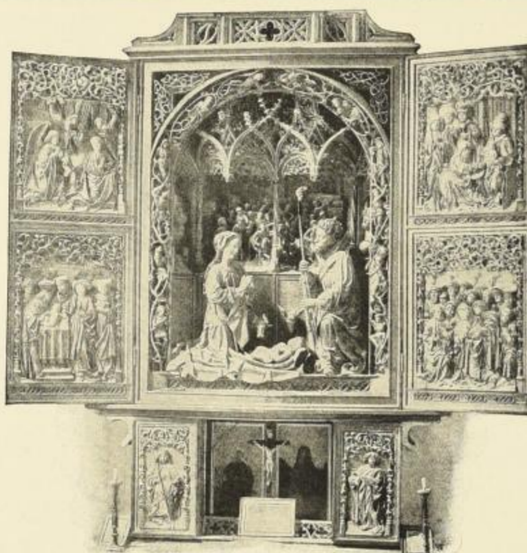
Altar der Franziskanerkirche zu Bozen.