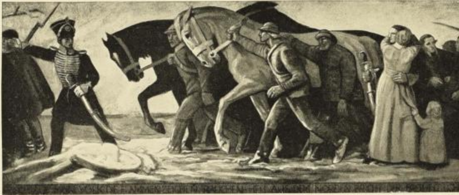
Frisch auf, mein Volk! Die Flammenzeichen rauchen. Hell aus dem Norden bricht der Freiheit Licht. Farbige Originalsteinzeichnung Nr. 801. Größe 57×136 cm. Preis M. 12.—.