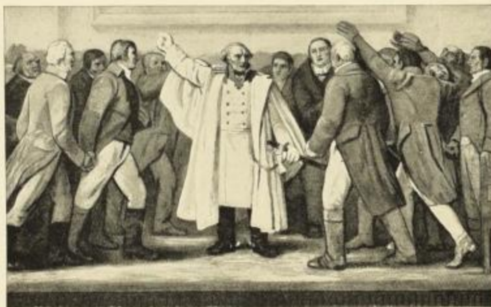
York in Königsberg am 5. Februar 1813. Farbige Originalsteinzeichnung Nr. 803. Größe 57×98 cm. Preis M. 6.—.