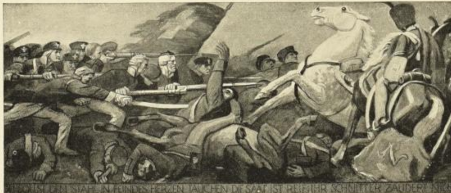
Du sollst den Stahl in Feindesherzen tauchen; Die Saat ist reif, ihr Schnitter, zaudert nicht! Farbige Originalsteinzeichnung Nr. 802. Größe 57×136 cm. Preis M. 12.—.

Anlässlich der Jahrhundertfeier sind diese drei Bilder von dem Künstler geschaffen worden! Die Tat eines reifen Künstlers, der die Anregung dazu aus den Taten unserer Ahnen schöpfte. — Die markige Kraft, die Wucht der Darstellung fesselt den Beschauer, der gezwungen wird, die fast fanatische Begeisterung der Helden von 1813 nachzufühlen. Besonders in dem dritten Bilde „Du sollst den Stahl in Feindesherzen tauchen“ erreicht Dettmann eine dramatische Wirkung von hinreißender und unbändiger Kraft und Leidenschaft. Das ist nicht mehr eine bestimmte Schlachtenepisode, keine Einzelheit, wie sie hundertfach in jedem Kampfe vorkommt, das ist die allgemeine, wachgewordene Volkskraft, die den herrschenden Zeitgeist verkörpert, das ist die Verbildlichung des unbeugbaren Willens, der alles niederwirft, was sich ihm entgegenstellt. — Wie klar und plastisch treten die Gruppen hervor, sind die Menschen gegliedert, ist rein kompositionell eine Abflutung in das Bild gebracht! Den Massenwerten sind aber auch Farbenwerte gegenübergestellt, die sich trefflich das Gleichgewicht halten. :: ::