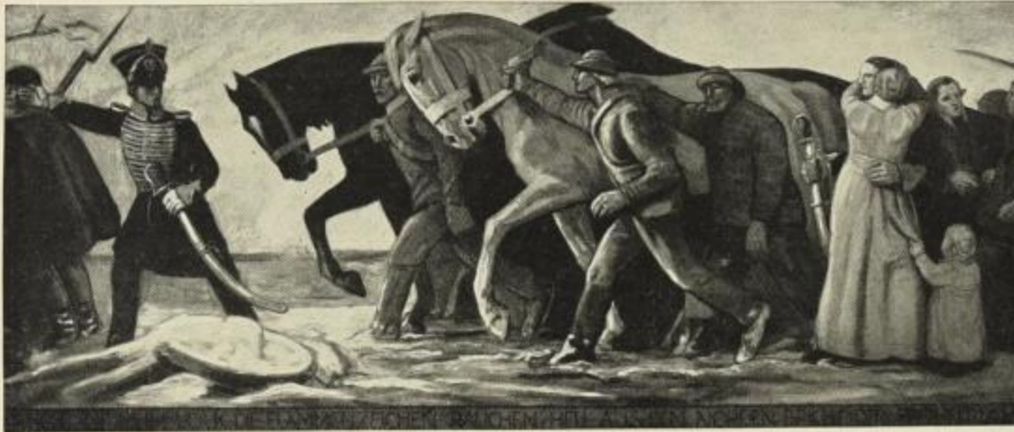
Frisch auf, mein Volk! Die Flammenzeichen rauchen. Hell aus dem Norden bricht der Freiheit Licht. Farbige Originalsteinzeichnung Nr. 801. Größe 57x136 cm. Preis M. 12.—.