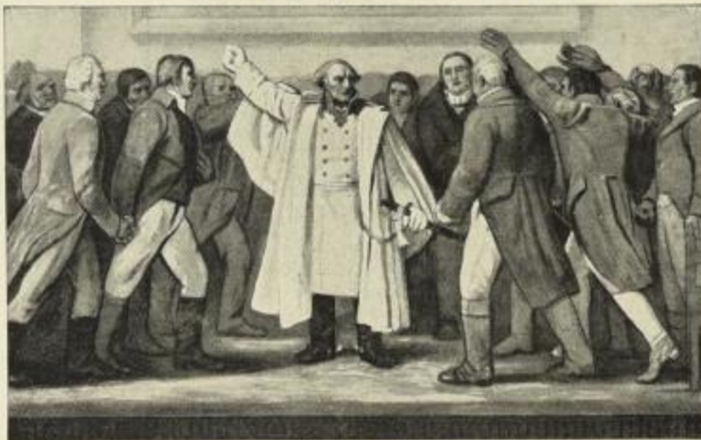
York in Königsberg am 5. Februar 1813. Farbige Originalsteinzeichnung Nr. 803. Größe 57x98 cm. Preis M. 6.—.