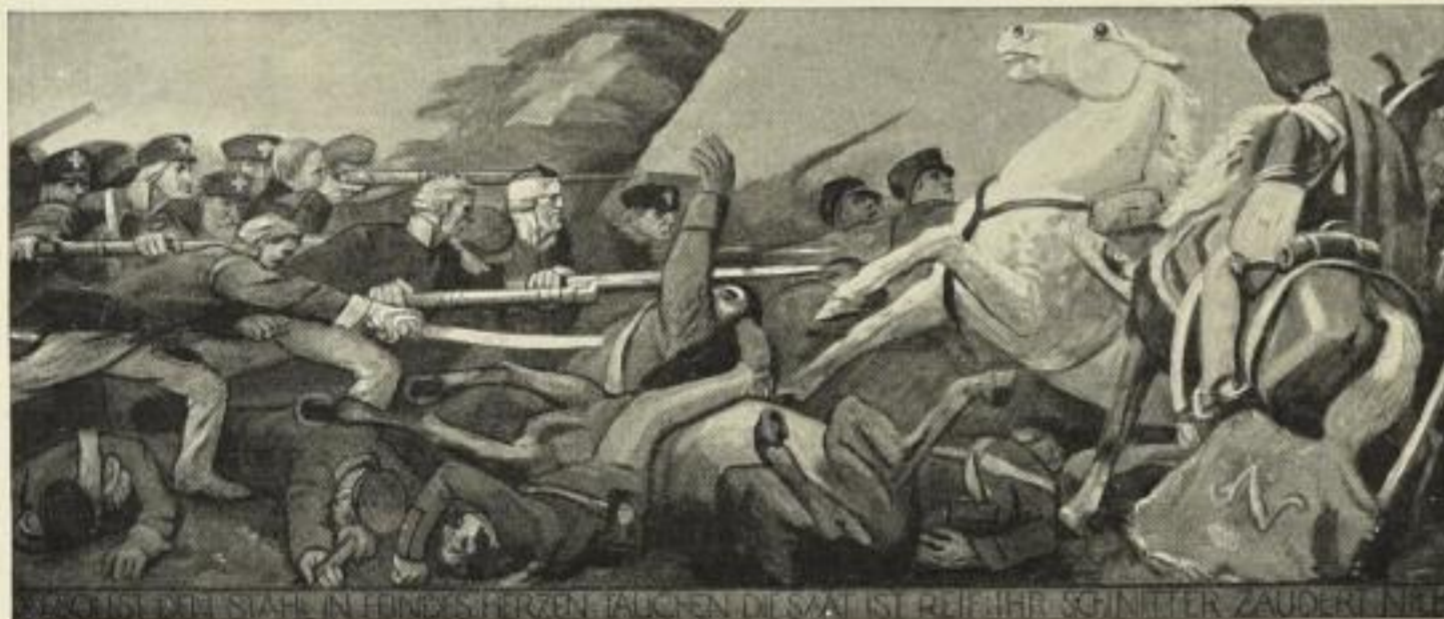
Du sollst den Stahl in Feindesherzen tauchen; Die Saat ist reif, ihr Schnitter, zaudert nicht! Farbige Originalsteinzeichnung Nr. 802. Größe 57x136 cm. Preis M. 12.—.

Anlässlich der Jahrhundertfeier sind diese drei Bilder von dem Künstler geschaffen worden! Die Tat eines reifen Künstlers, der die Anregung dazu aus den Taten unserer Ahnen schöpfte. — Die mächtige Kraft, die Wucht der Darstellung fesselt den Beschauer, der gezwungen wird, die fast fanatische Begeisterung der Helden von 1813 nachzufühlen. Besonders in dem dritten Bilde „Du sollst den Stahl in Feindesherzen tauchen“ erreicht Dettmann eine dramatische Wirkung von hinreißender und unbändiger Kraft und Leidenschaft. Das ist nicht mehr eine bestimmte Schlachtenepisode, keine Einzelheit, wie sie hundertfach in jedem Kampfe vorkommt, das ist die allgemeine, wachgewordene Volkskraft, die den herrschenden Zeitgeist verkörpert, das ist die Verbilligung des unbeugsamen Willens, der alles niederwirft, was sich ihm entgegenstellt. — Wie klar und plastisch treten die Gruppen hervor, sind die Menschen gegliedert, ist rein kompositionell eine Abstufung in das Bild gebracht! Den Massenwerten sind aber auch Farbenwerte gegenübergestellt, die sich trefflich das Gleichgewicht halten. :: ::