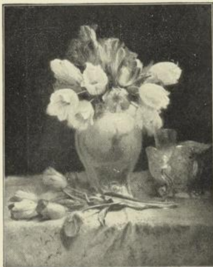
Nr. 238. HERM. HOFFMANN: Tulpen. Bild 55×69 cm, mit weiß. Karton (u. Titel) 72×95 cm ord. 25.- M., netto 15.- M.