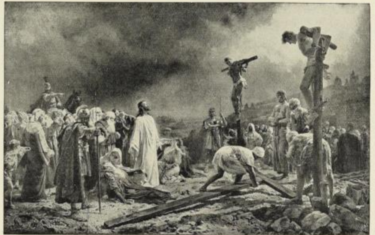
Nr. 176. HERMANN CLEMENTZ: Golgatha. Bildgröße 61½ × 96½ cm, im Passep. 97 × 125 cm, ord. 35.- M. Ohne Passep. netto 17.50 M., mit Passep. netto 21.- M. Im altholländ. Rahmen (mit Goldfalz) 77 × 112 cm, ord. 70.- M., netto 46.50 M.

Ausstellung für christliche Kunst Düsseldorf 1909.