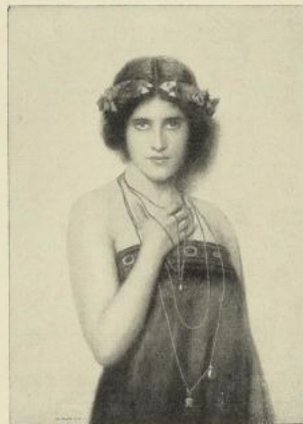
Nr. 180. MAX NONNENBRUCH: Jugend. Bild 44½×63 cm, m. weiß. Karton (u. Titel) 72×97 cm, ord. 25.- M., netto 15.- M.