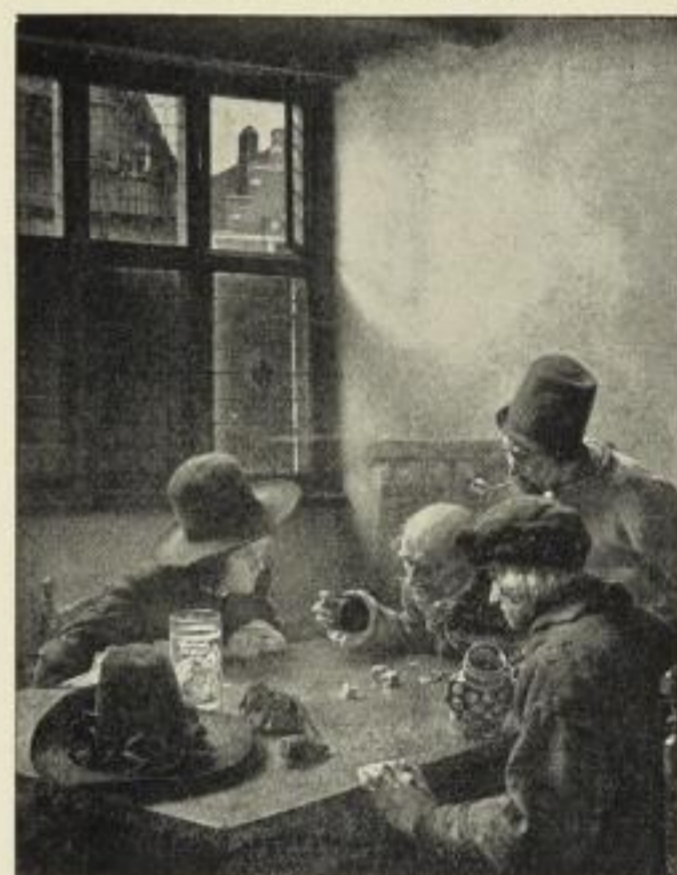
Nr. 196. CLAUD MEYER: Die Würfler. Bildgr. 51 \times 66 cm, im Passep. 77 \times 95 cm, ord. 25.— M. Ohne Passep. netto 12.50 M., mit Passep. netto 15.— „ Im holländ. Rahmen 66 \times 81 cm, ord. 42.— M., netto 28.— „

Nach dem Original im Kaiser Friedrichs-Museum, Berlin.