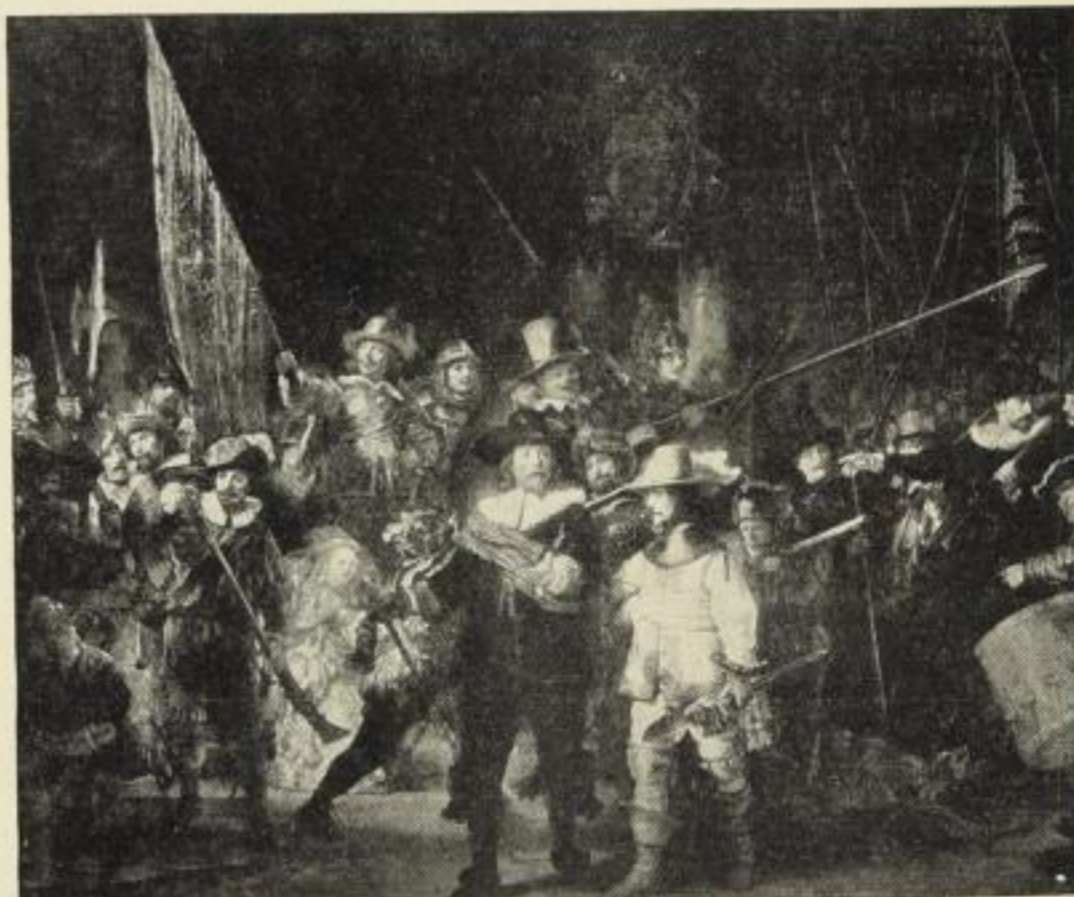
Nr. 198. REMBRANDT: Die Nachtwache. Bildgröße 73×88½ cm, in Passepartout 97×125 cm, ord. 35.— M. Ohne Passepartout netto 17.50 M., mit Passepartout netto 21.— M. Im holländischen Rahmen 93×108 cm, ord. 70.— M., netto 46.50 M.