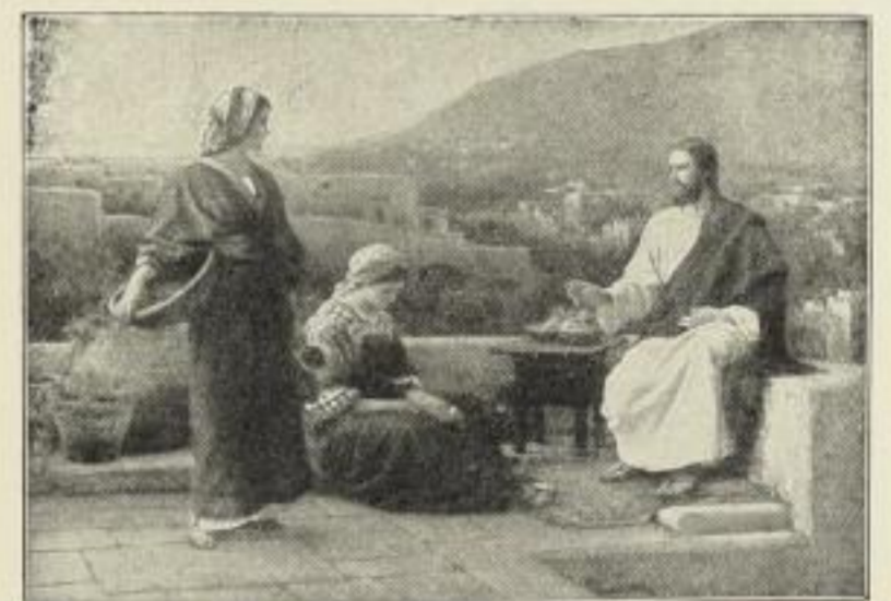
Nr. 165. H. SEEGER: Jesus bei Maria und Martha. Bild 50 × 71½ cm, in Passep. 77 × 95 cm, ord. 25.- M. Ohne Passep. netto 12.50 M., mit Passep. netto 15.- M. Im schwarzgebeizten Eichenrahmen 90 × 108 cm ord. 45.- M., netto 30.- M.