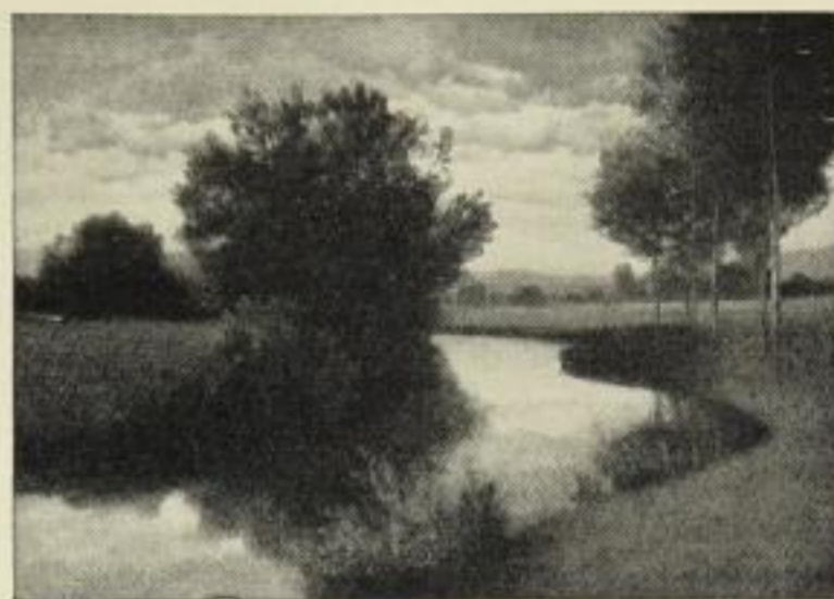
Nr. 182. HERM. RUDISÜHLI: Wiesenbach. Bild 34 \times 48 cm, auf weißem Karton 56 \times 72 cm ord. 12.50 M., netto 7.50 M.

(Nach dem Original in der Neuen Pinakothek, München.)