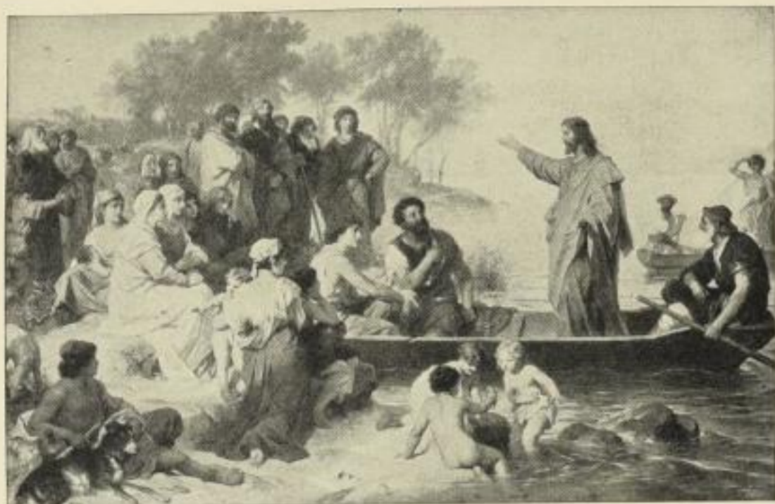
Nr. 200. H. HOFMANN: Die Seepredigt (Kgl. National-Galerie, Berlin.) Bild 46×71½ cm, Passep. 77×95 cm, ord. 25.-M., no. 15.-M., ohne P. no. 12.50 M. „ 63×98 „ „ 97×125 „ „ 35.- „ „ 17.50 „ „ 35½×55½ „ m. weiß. Kart. (u. Titel) 56½×74 cm, ord. 12.50 M., no. 7.50 „