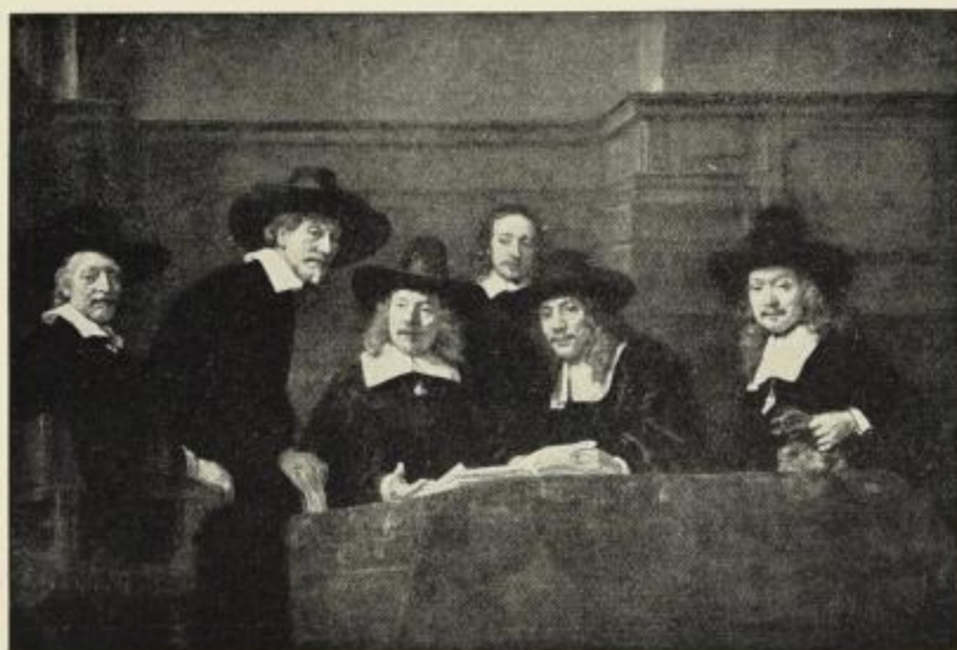
Nr. 211. REMBRANDT: Die Staalmeesters. (Rijksmuseum, Amsterdam.) Bild 60 \times 89 cm, Passep. 93 \times 122 cm, ord. 35.— M., netto 21.— M. ohne Passep. netto 17.50 M. Im altholländ. Rahmen 80 \times 109 cm, ord. 70.— M., netto 46.50 M.