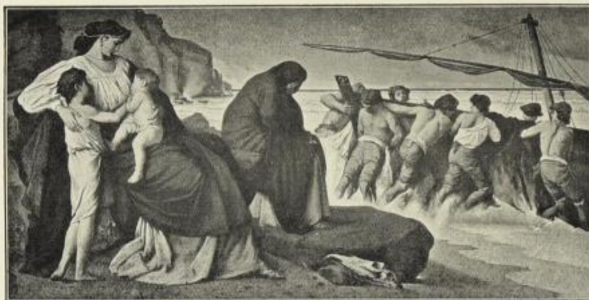
Nr. 227. ANSELM FEUERBACH: Medea. Bildgröße 48 \times 97 cm, im Passep. 78 \times 125 cm, ord. 35.— M. Ohne Passep. netto 17.50 M., mit Passep. netto 21.— M.

Nach dem Original im Kaiser Friedrichs-Museum, Berlin.