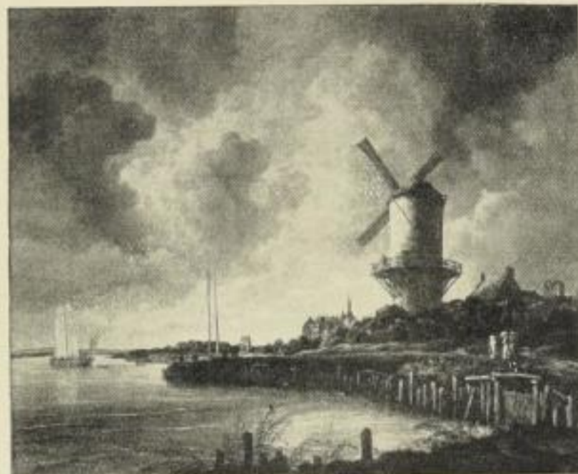
Nr. 135. J. van RUISDAEL: Die Windmühle. (Rijksmuseum, Amsterdam) Bild 72×90 cm, im Passep. 97×125 cm, ord. 35.- M. ohne Passep. netto 17.50 M., mit Passep. netto 21.- „ Im holländ. Rahmen 92×110 cm, ord. 70.- M., no. 46.50 „