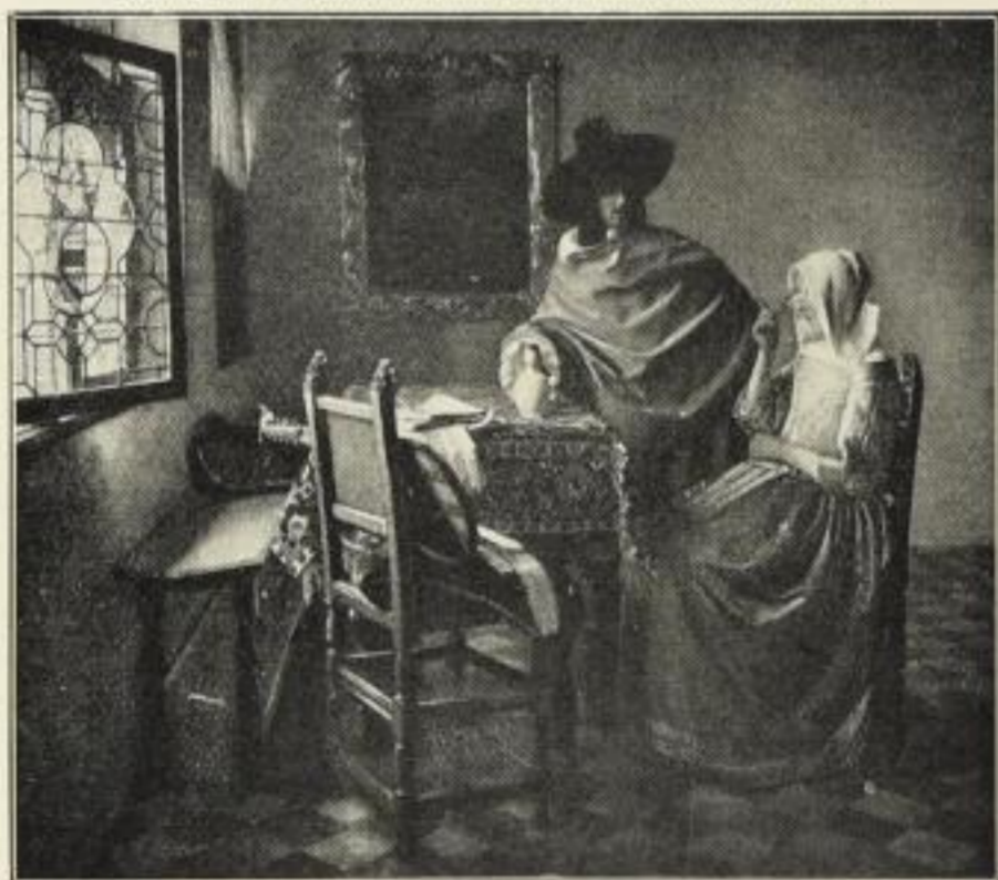
Nr. 224. VERMEER van DELFT: Herr und Dame beim Wein. Bild 53\frac{1}{2} \times 63\frac{1}{2} cm, in Passep. 77 \times 95 cm, ord. 25.— M. Ohne Passep. netto 12.50 M., mit Passep. netto 15.— M.