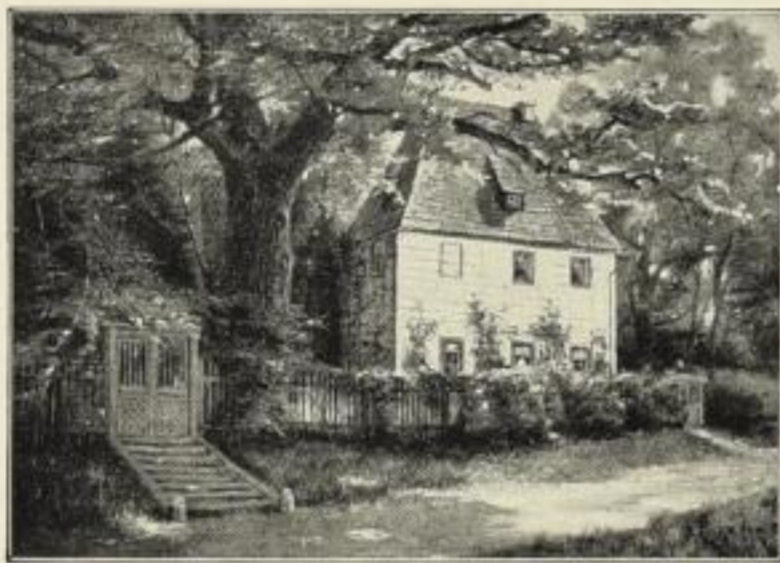
Nr. 223. E. v. ESCHWEGE: Goethes Gartenhaus in Weimar. Bild 34½ × 49 cm, auf weißem Karton 56½ × 72 cm ord. 12.50 M., netto 7.50 M. Im Mahagonirahmen 42 × 57 cm, ord. 24.- M., no. 16.- M.