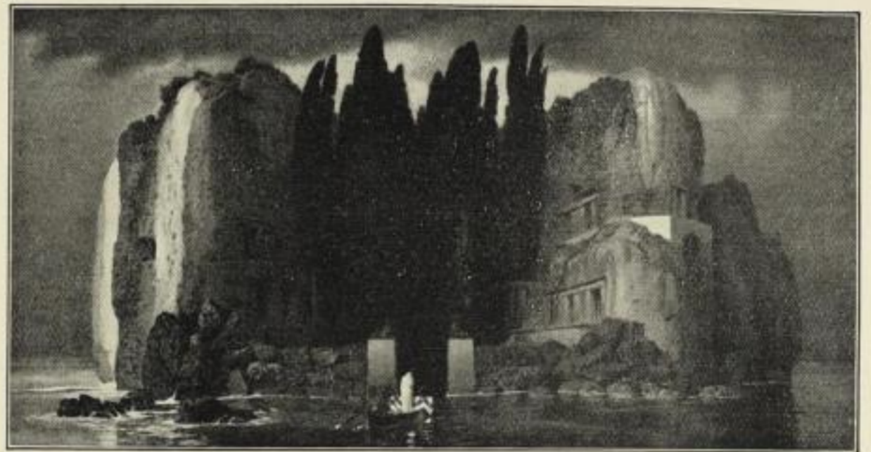
Nr. 146. BOECKLIN: Die Insel der Toten. (Städtisches Museum, Leipzig.) Bild 35½ × 68 cm, auf weiß Karton 58 × 86 cm, ord. 25.- M., netto 15.- M. Im Gold-Motivrahmen 50 × 83 cm, ord. 55.- M., netto 35.- M. Im Mahagonirahmen " " " 45.- " " 30.- "

Ausstellung für christliche Kunst Düsseldorf 1909.