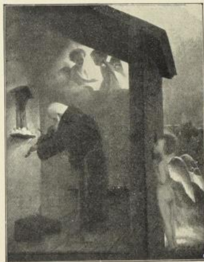
Nr. 81. BOCKLIN: Der Eremit. (Nationalgalerie, Berlin.) Bild 48×63 cm, in Passep. 77×95 cm, ord. 25.— M. Ohne Passep. no. 12.50 M., mit Passep. no. 15.— M. Im dachförmigen Allgoldrahmen 78×99 cm ord. 55.— M., netto 35.— M.

Nach dem Original im Rijksmuseum zu Amsterdam.