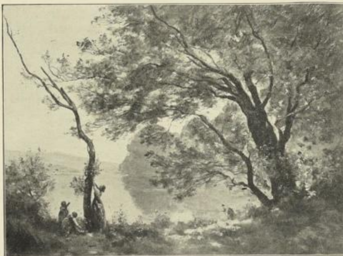
Nr. 231. COROT: Frühlingsmorgen. (Louvre, Paris.) Bild 50×68 cm, mit weiß. Karton (u. Titel) 73×96 cm, ord. 25.- M., no. 15.- M.