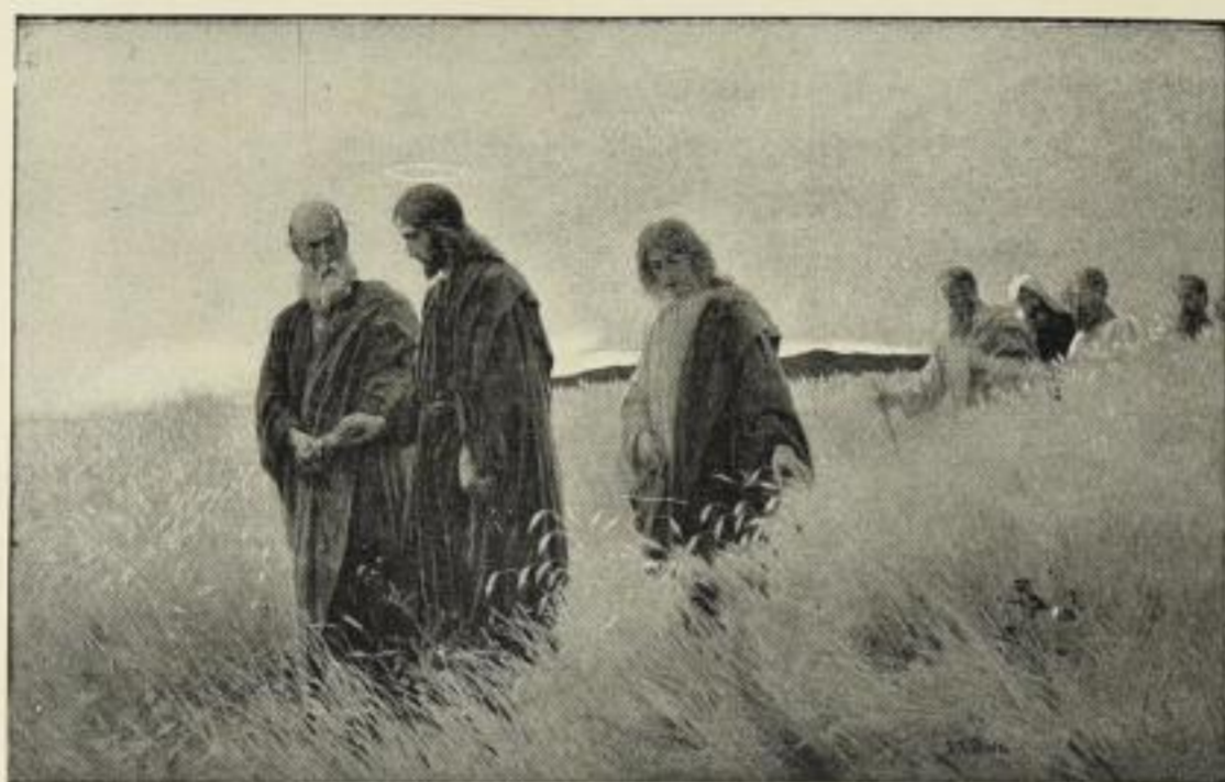
Nr. 137. JOH. RAPH. WEHLE: Und sie folgten ihm nach. Grosse Ausgabe: Bild 46\frac{1}{2} \times 74 cm, im Passep. 72 \times 98 cm, ord. 25.— M. Ohne Passep. netto 12.50 M., mit Passep. netto 15.— M. Mittl. Ausg.: Bild 34 \times 54 cm, auf weiß. Karton 55 \times 72 cm ord. 12.50 M., no. 7.50 M. Kleine „ „ 20 \times 31 „ „ „ 40 \times 51 „ „ 6.25 „ „ 3.75 „

(Nach dem Original in der Neuen Pinakothek, München.)