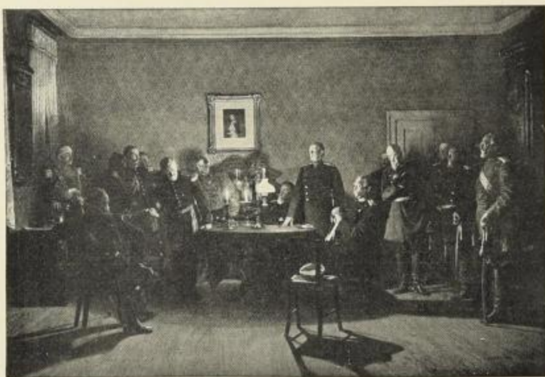
Nr. 210. A. v. WERNER: Kapitulationsverhandlungen von Sedan. Bild 44½×66½ cm, im Passep. 77×95 cm, ord. 25.- M. Ohne Passep. no. 12.50 M., mit Passep. no. 15.- M. Erläuterungstafel gratis.