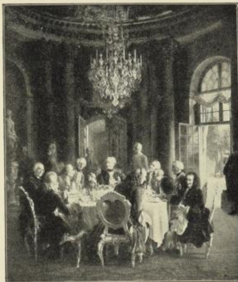
Nr. 185. ADOLPH von MENZEL: König Friedrichs II. Tafelrunde in Sanssouci 1750. Bildgr. 52½×62 cm, auf weißem Karton 76×97 cm ord. 25.— M., netto 15.— M. Im Gold-Rokokorahmen 65×78 cm ord. 55.— M., netto 35.— M.

Nach dem Original in der Königl. National-Galerie, Berlin.