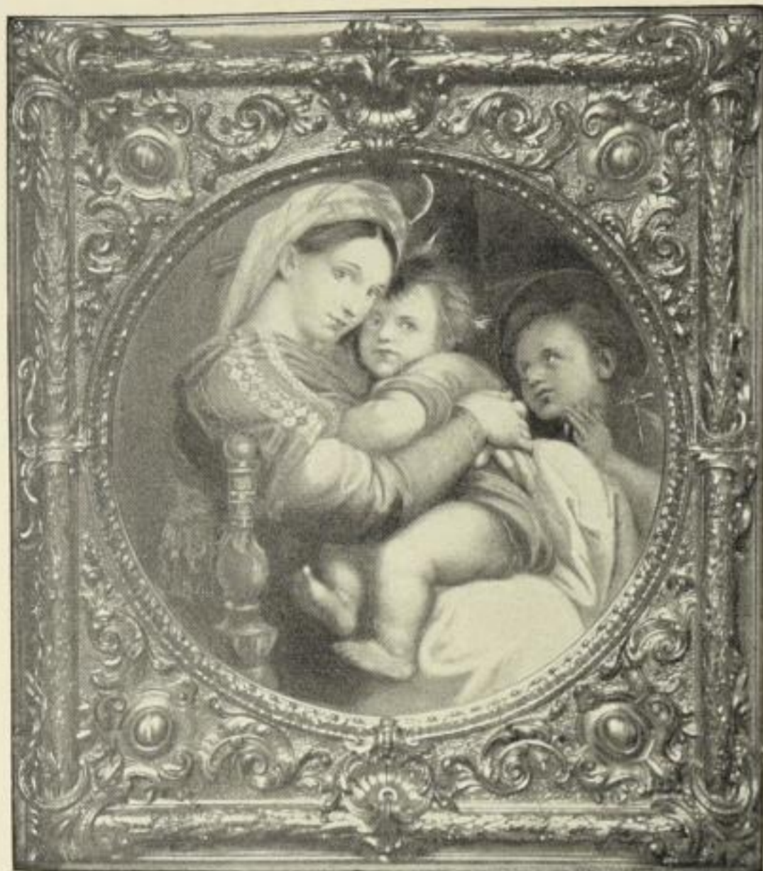
Nr. 2. RAFAEL: Madonna della Sedia. (Palazzo Pitti, Florenz.)

Farbige Kunstblätter nach berühmten Gemälden alter und neuer Meister. Absolut originalgetreu, mit unvergänglichen Farben hergestellt.