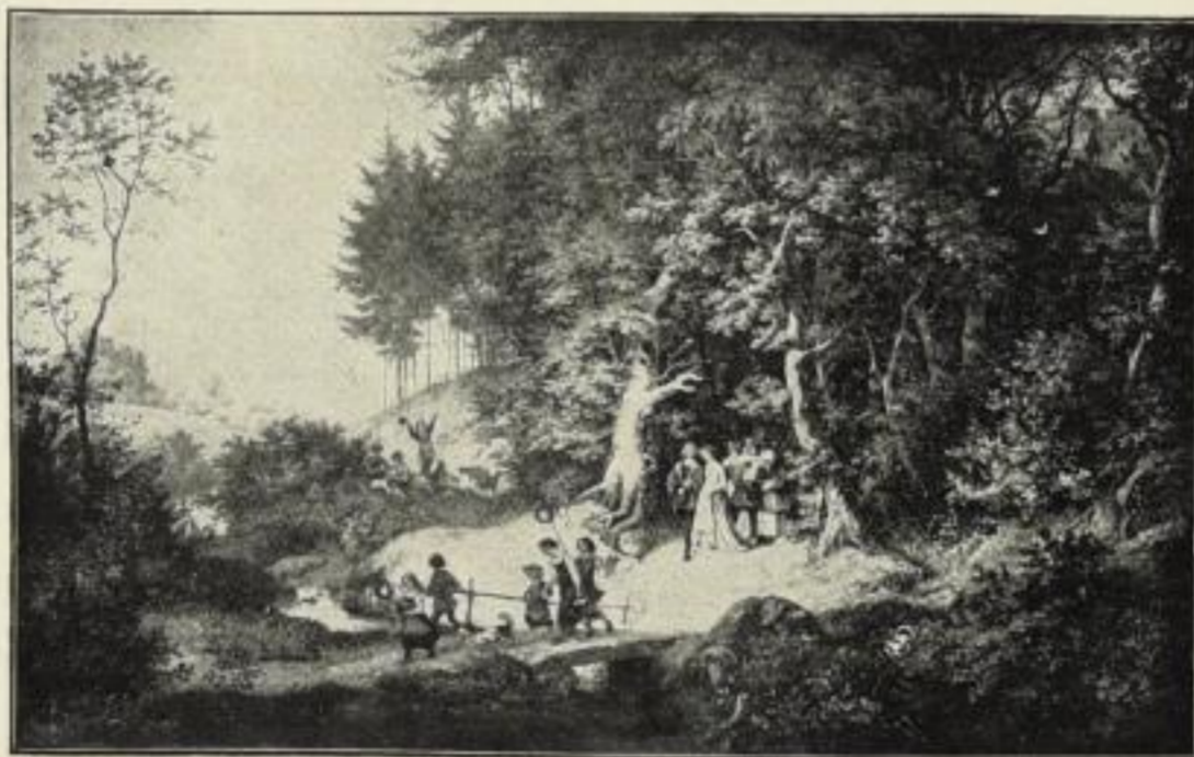
Nr. 213. LUDWIG RICHTER: Brautzug im Frühling. (Gemäldegalerie Dresden.) Bild 46 × 74 cm, auf weißem Karton 75 × 95 cm, ord. 25.- M., netto 15.- M. Dass. Bild große Ausg. : Bild 60 × 97 cm, im Passep. 97 × 125 cm ord. 35.- M. ohne Passep. netto 17.50 M., mit Passep. netto 21.- M.