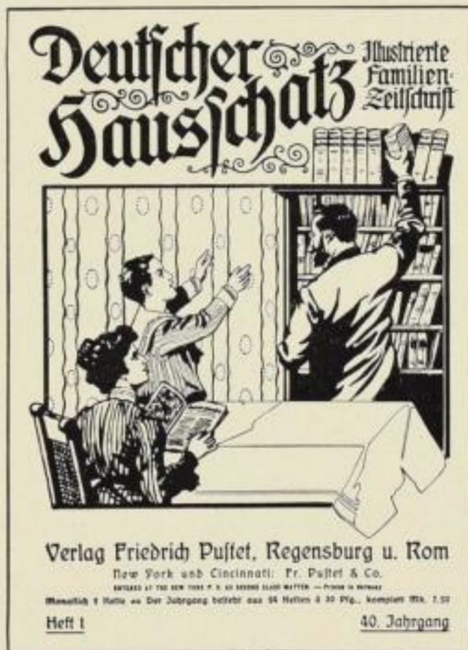
Verkleinerte Abbildung des neuen Umschlages.

Schon Goethe sagt: „Was 20 Jahre sich erhält und die Neigung des Volkes hat, das muß schon etwas sein“. Was sich nun sogar die doppelte Zeit die Sympathien weitester Kreise erhalten hat, das ist gewiß wert, daß Sie sich energisch dafür verwenden, und bitte ich meinem bereits versandten Zirkular mit vorteilhaften Bezugsbedingungen Ihre Aufmerksamkeit zu schenken.