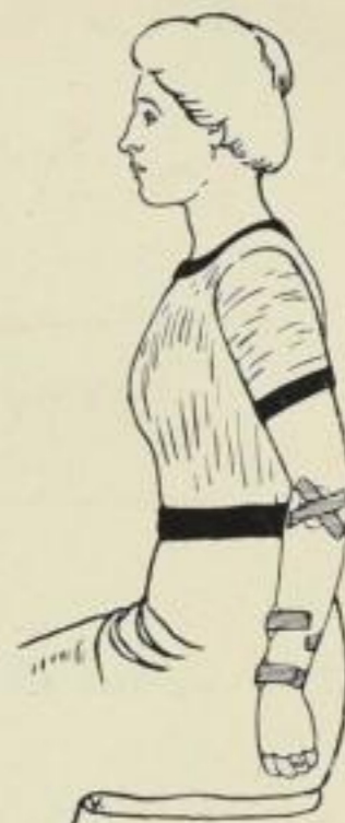
Aus dem Abschnitt: Vom gesunden und kranken Körper

In einzelnen Bänden oder in 26 Lieferungen zu je 50 Pf.