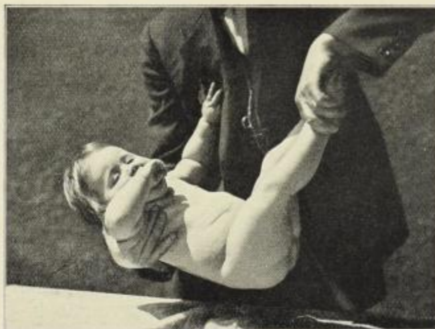
Das richtige Tragen eines kleinen Kindes Aus dem Abschnitt: Die Kinderstube