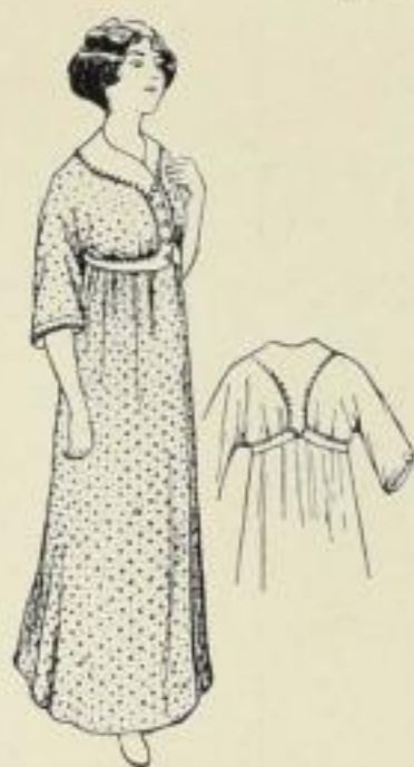
Aus dem Abschnitt: Frauenkleidung