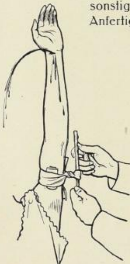
Aus dem Abschnitt: Vom gesunden und kranken Körper

Im Frauenbuch hat sie ein nieversagendes Nachschlagewerk für alle Krankheiten, für alle sonstigen häuslichen Sorgen. Das Buch bringt auch eine mustergültige Anleitung zur Anfertigung von Kleidern und Wäsche, hunderte von Ratschlägen für billiges Wirtschaften und vieles mehr.