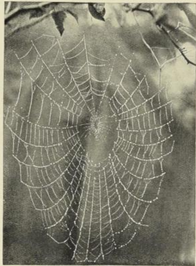
Spinnennetz mit Tautropfen.