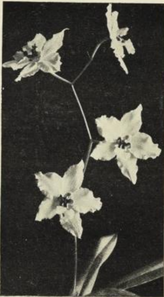
Tropische Orchidee (Odontoglossum).