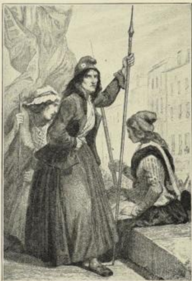
Die Furien der Guillotine Verkleinerte Nachbildung einer der Beilagen

100 numerierte Exemplare auf holländischem Büttenpapier, in handgefertigtem Lederband 40 Mark