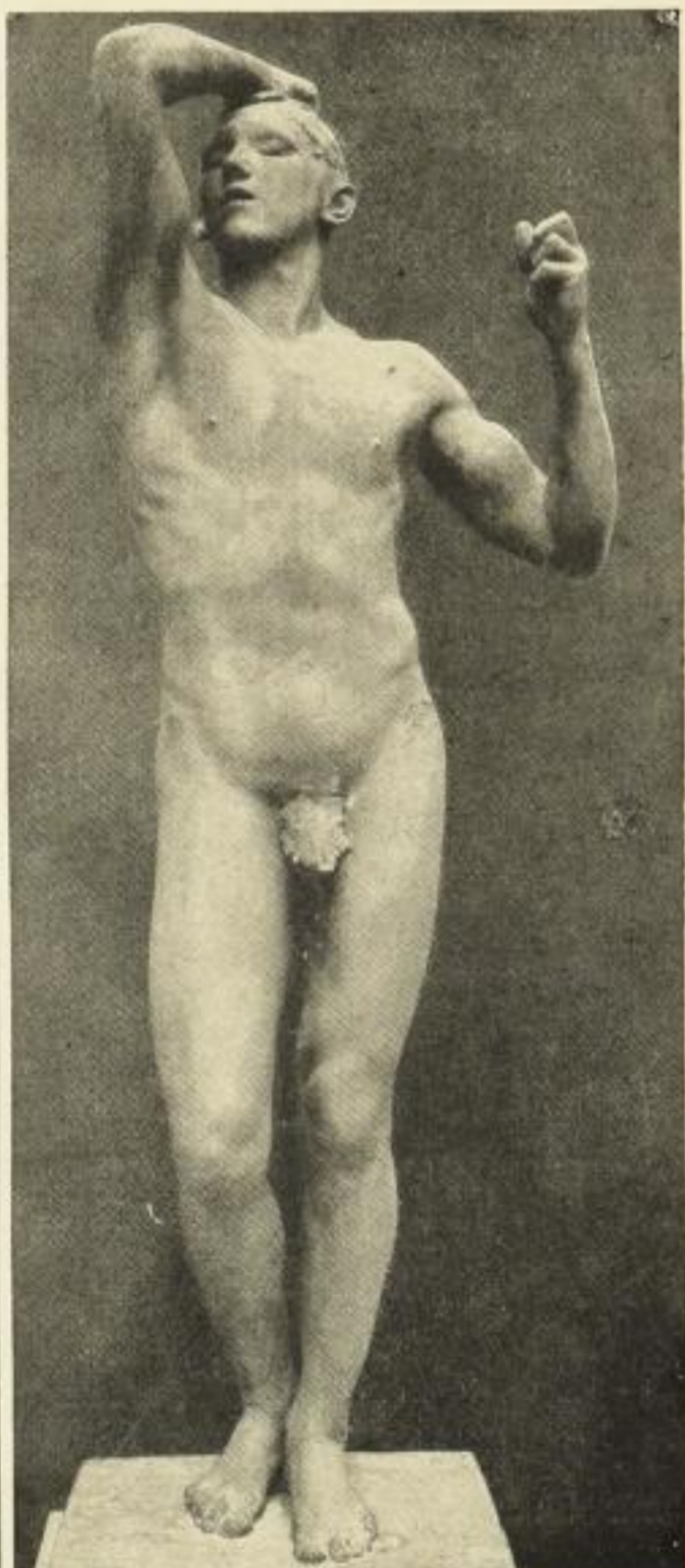
Abb. 142. Das eiserne Zeitalter, Rodin (Louvre Paris).

Durch die zahlreichen auf mein vor kurzem direkt versandtes Rundschreiben eingegangenen Bestellungen ist die erste starke Auflage erschöpft, ich lasse daher sofort einen unveränderten Neudruck vornehmen. — Die Exemplare dieses Neudrucks werde ich zunächst zur Ausführung der baren und festen Bestellungen verwenden. Weitere à cond.-Bestellungen können erst in zweiter Linie berücksichtigt werden.