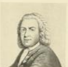
J. B. Sebastian Bach