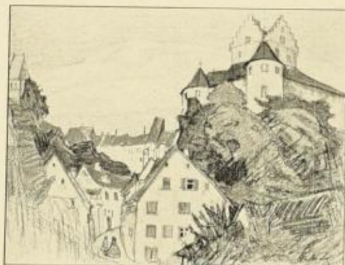
„Meersburg“ Bildgrösse: 25:19 cm, Kunstdruck Nr. 78

Die sechs Bilder sind auf Kar- ton aufmontiert und werden einzeln und in Mappe geliefert