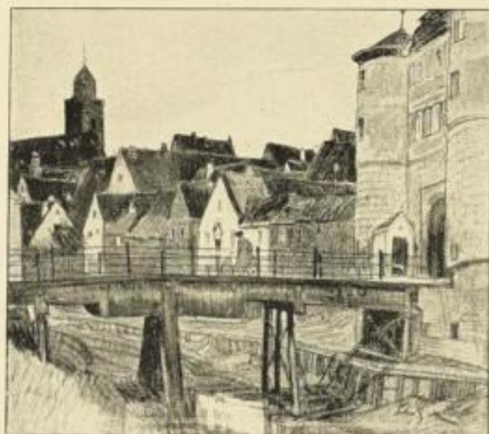
„Donauwörth“ Bildgrösse: 25:22 cm, Kunstdruck Nr. 77