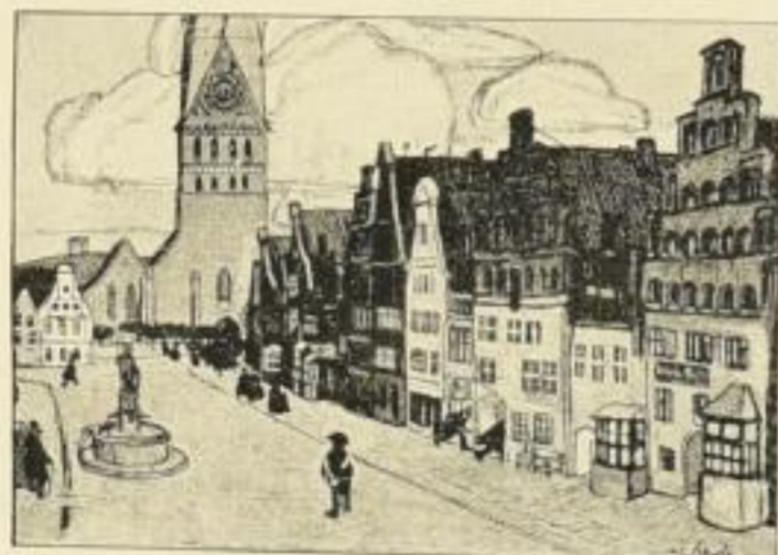
„Lüneburg“ Bildgrösse: 25:17,5 cm, Kunstdruck Nr. 79

Es lässt sich kaum ein schö- nerer Besitz, ein erfreu- licherer Wandschmuck denken als diese in autotypischem Fünf- farbendruck überraschend ori- ginalgetreu reproduzierten Bil- der von Wilhelm Schulz. Hat doch kaum ein zweiter unter unseren heutigen Künstlern so- viel Blick und soviel Herz für die malerische Schönheit un- serer alten Städtchen, dieser Zeu- gen einer vornehmen deutschen Kultur, die uns leider versunken ist, und um deren Neubildung wir heute noch mit Anstrengung ringen müssen.