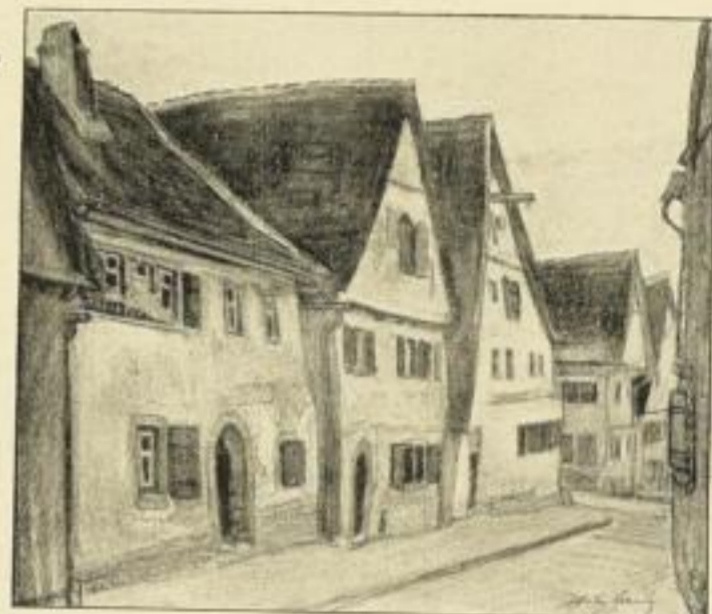
„Rothenburg o. T.“ Bildgrösse: 25:21,5 cm, Kunstdruck Nr. 80

Die sechs Bilder sind auf Kar- ton aufmontiert und werden einzeln und in Mappe geliefert