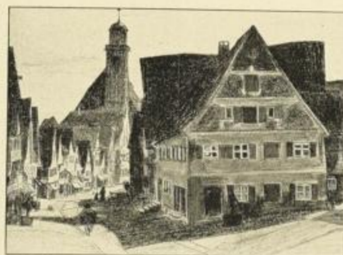
„Dinkelsbühl“ Bildgrösse: 25:18 cm, Kunstdruck Nr. 81