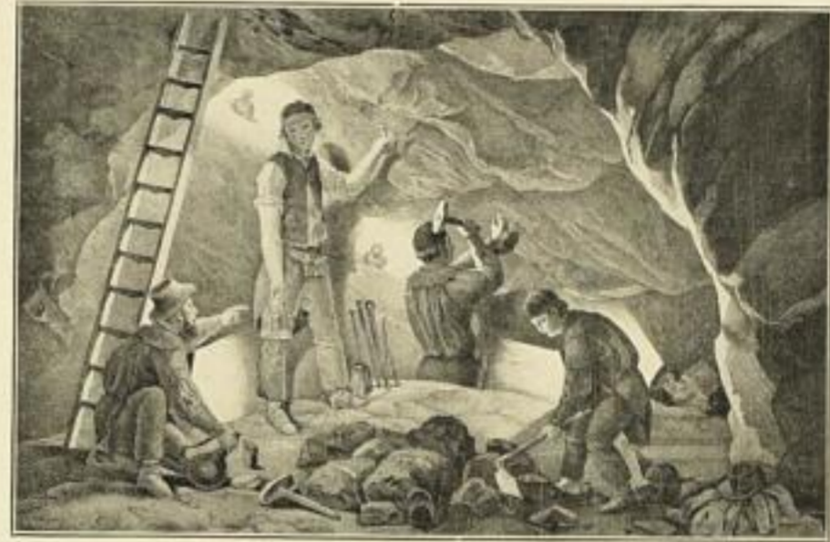
Heuchler, Der Förstenbau.

Preis M. 4.— ord. (Versandrolle 30 Pf. Porto bis zu 3 Bildern 30 Pf.)