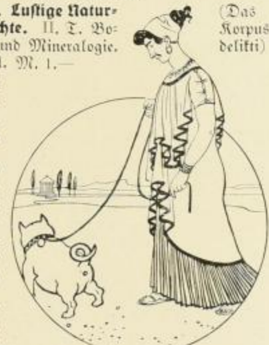
(Das Korpus delikti)

v. Miris, Lustige Naturgeschichte. I. T. Zoologia comica. 11. Aufl. M. 1.50 v. Miris, Lustige Naturgeschichte. II. T. Botanik und Mineralogie. 7. Aufl. M. 1.—