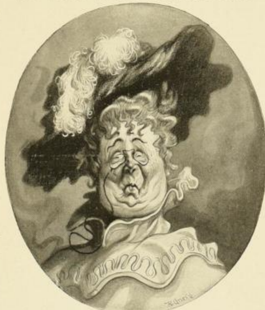
(Fräulein Monika während der Zitronenkur)

Olahausen-Schönberger, Im Spiegel der Tierwelt. 5. Aufl. Eleg. geb. M. 2.—, II. T. 2. Aufl. Eleg. geb. M. 2.— Der fidele Patient und sein Doktor. 2. Aufl. Brosch. M. 2.— Poetische Purzelbäume. Geb. M. 2.50 Schäffer, Anno dazumal. Postalische Dichtungen. Illustr. nach Skizzen des Verfassers von E. Meinide. M. 1.— Unsere Lieblinge. Lustige Kinderfreiche. 2. Aufl. Eleg. geb. M. 1.50 Vor und hinter dem Vorhang. Eleg. kart. M. 3.— Wenn's regnet. Brosch. 1.50, kart. 1.80 Zur Genesung. Ein lust. Handbuch usw. 9. Aufl. M. 2.—, eleg. geb. M. 3.50