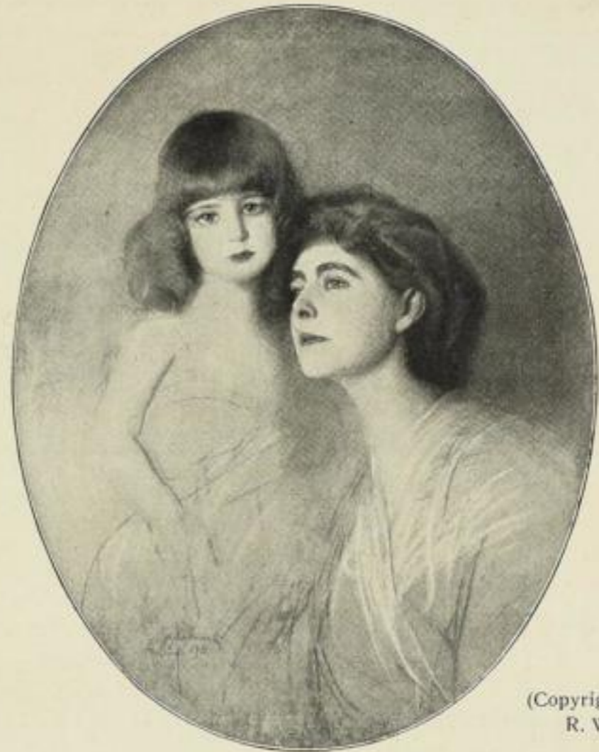
Marie Kronprinzessin von Rumänien