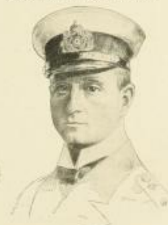
Kaplanleutnant von Weddigen