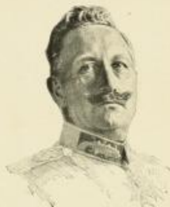
Kaiser Wilhelm II.