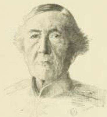
Generalfeldmarschall Graf Haeseler