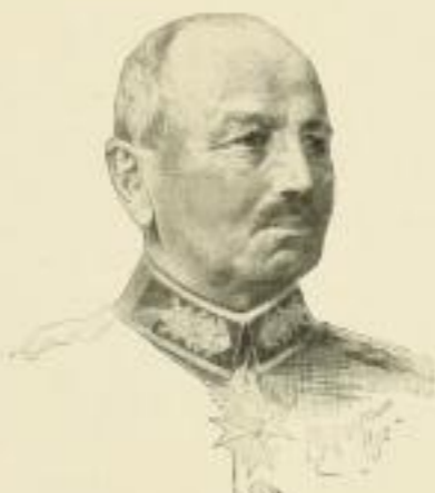
Generaloberst von Kluck