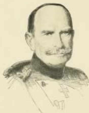
General von Beseler