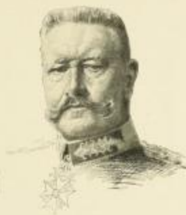
Generalfeldmarschall von Hindenburg