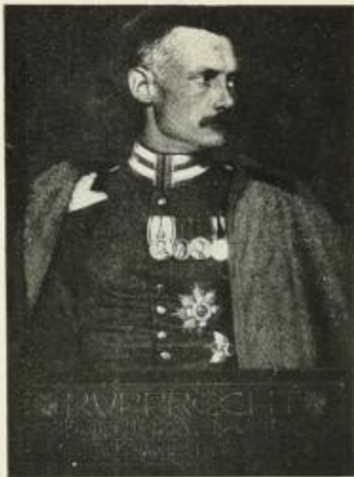
354. Kronprinz Rupprecht