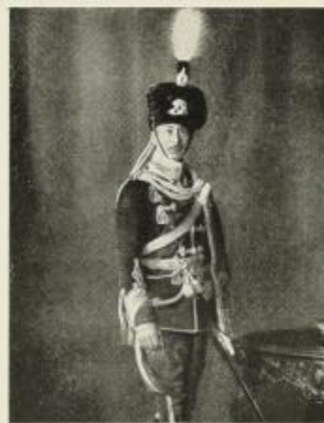
360. Kronprinz Wilhelm

Farbenkunstdruck in technisch vollendeter Ausführung (Bildgröße 29×22 cm auf Mattkarton 47×32 cm) Preis M. 1.50 ord., M. —.90 no.; 10 Expl. M. 9.—