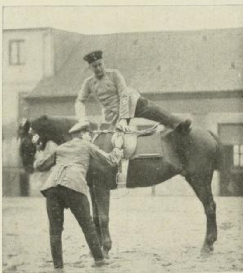
Hauptmann mit Amputation des linken Beines in leichter Prothese, die es ihm ermöglichte, 9 Wochen nach der Amputation wieder zu Pferde zu steigen und nach weiteren 2 Wochen Dienst zu tun. (Nach Hoeftmänn.)

Viele Tausende unserer schwerverwundeten Brüder schauen heute mit ihren Familien angst erfüllt in die Zukunft, weil sie in der Bewegungsfreiheit ihrer Glieder dauernd behindert sind oder gar Arm und Bein verloren haben und darum sorgen, wie sie wieder Arbeit und Brot finden sollen.