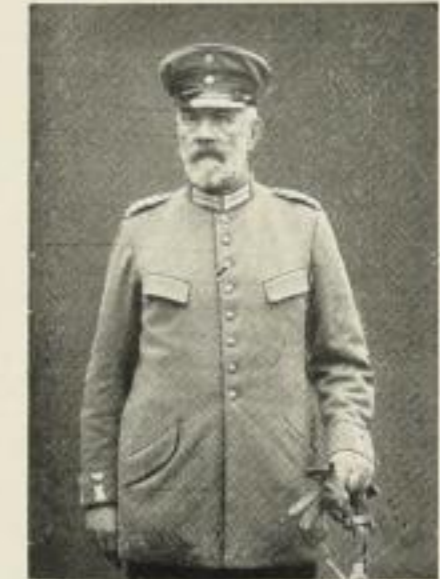
377. v. Bethmann-Hollweg