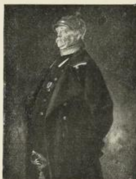
2766. J. v. Lenbach Fürst Bismarck

Gravüre: Imperial (M. 15.—) Photographie: Imperial (M. 12.—), Folio (M. 3.—), Kabinett (M. 1.—)