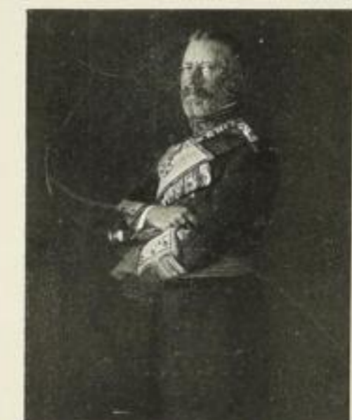
372. Prinz Heinrich v. Preußen