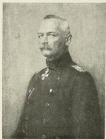
379. v. Falkenhayn