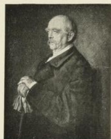
593. J. v. Lenbach Fürst Bismarck

Gravüre: Imperial (M. 15.—), Folio (M. 3.—), Kabinett (M. 1.—), Folio-Platin (M. 5.—) Photographie: Imperial (M. 12.—), Royal (M. 7.50), Folio (M. 3.—), Kabinett (M. 1.—)