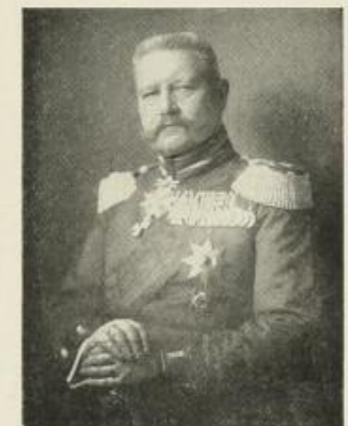
355. v. Hindenburg