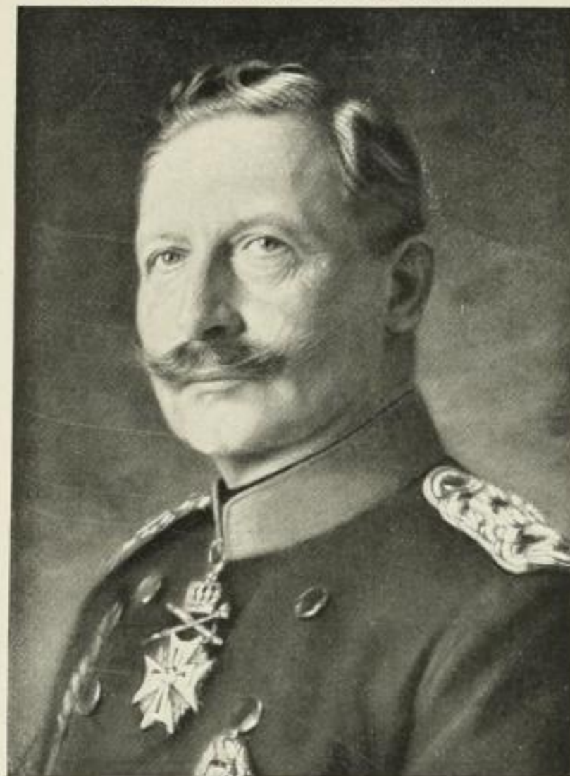
369. Kaiser Wilhelm II.

Farbenkunstdruck in technisch vollendeter Ausführung (Bildgröße 29×22 cm auf Mattkarton 47×32 cm) Preis M. 1.50 ord., M. —.90 no.; 10 Expl. M. 9.—