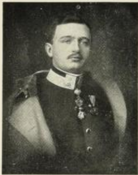
380. Thronfolger Carl Franz Josef

Handpressen-Kupferdrucke auf Büttenkarton (50:37 cm) je 3 Mark. Illustr. Verzeichnis der bisher erschienenen 24 Blätter kostenlos