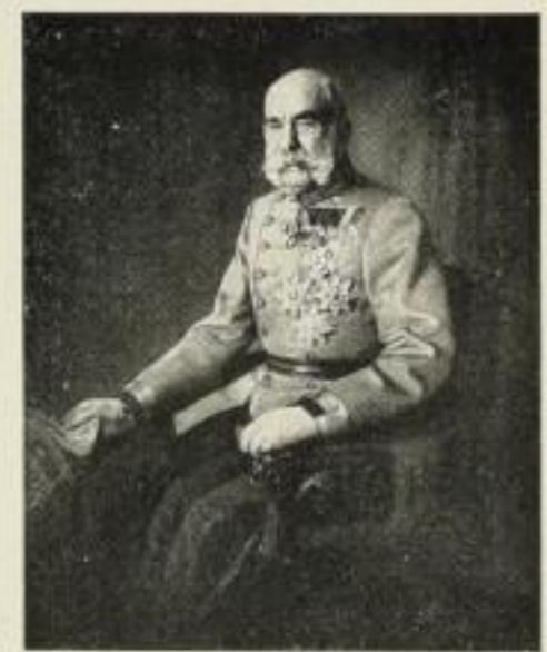
364. Kaiser Franz Josef