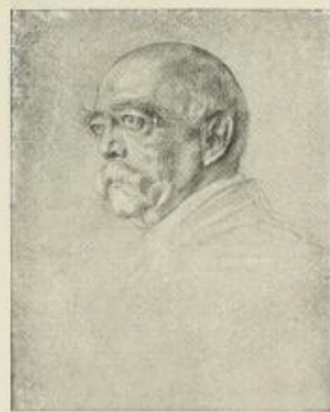
293. J. v. Lenbach Fürst Bismarck Folio-Lichtdruck (M. 3.—)