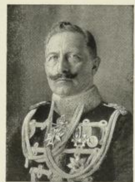
368. Wilhelm II.