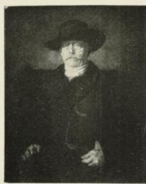
592. J. v. Lenbach Fürst Bismarck

Gravüre: Imperial (M. 15.—), Folio (M. 3.—) Photographie: Imper. (M. 12.—), Folio (M. 3.—), Kabinett (M. 1.—)