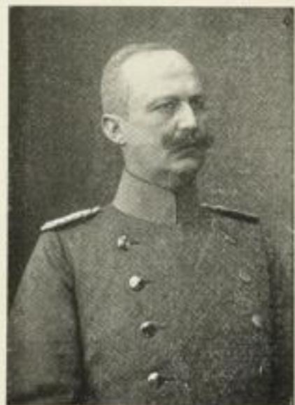
373. v. Ludendorff