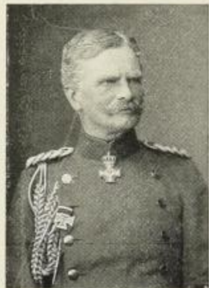
375. v. Mackensen