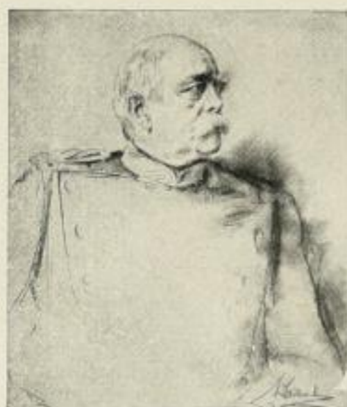
269. J. v. Lenbach Fürst Bismarck Folio-Gravüre (M. 3.—)

bringen wir die in unserem sowie im Verlage unserer Schwesterfirma „Photographische Union“ erschienenen Bismarck-Bilder in Erinnerung