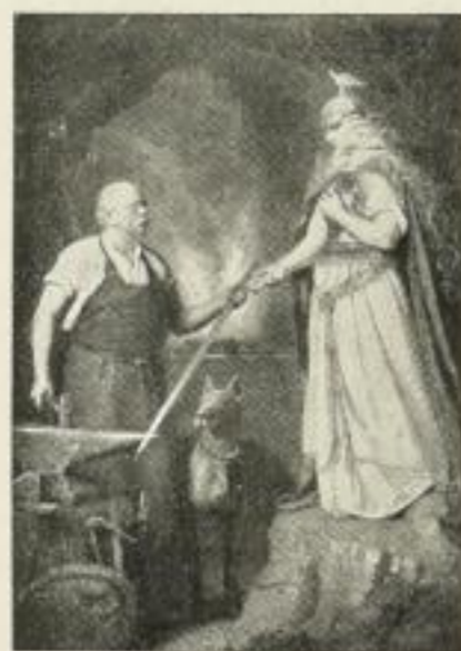
3411. G. Schmitt Der Schmied der deutschen Einheit

Gravüre: Faksimile (M. 30.—), Folio (M. 3.—), Kabinett (M. 1.—) Photographie: Faksimile (M. 30.—), Imperial (M. 12.—), Folio (M. 3.—), Kabinett (M. 1.—)