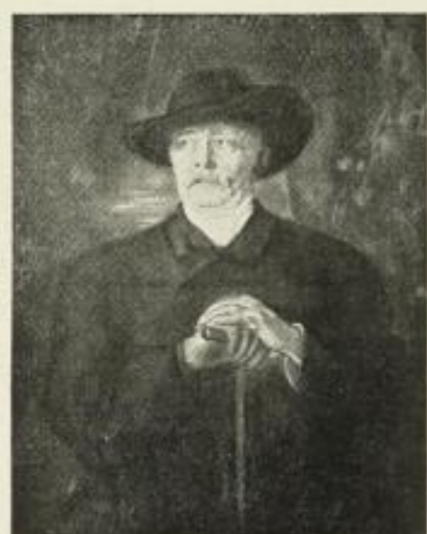
3237. J. v. Lenbach Fürst Bismarck

Gravüre: Faksimile (M. 30.—), Folio (M. 3.—), Kabinett (M. 1.—) Photographie: Faksimile (M. 30.—), Imperial (M. 12.—), Folio (M. 3.—), Kabinett (M. 1.—)