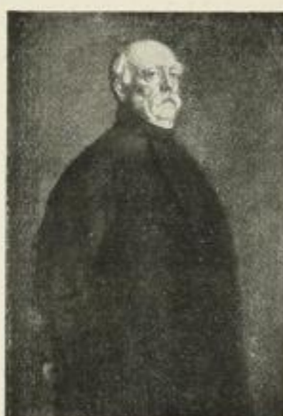
3245. J. v. Lenbach Fürst Bismarck

Rabatt 40% und 13/12 Prospekt mit 36 Abbildungen kostenlos