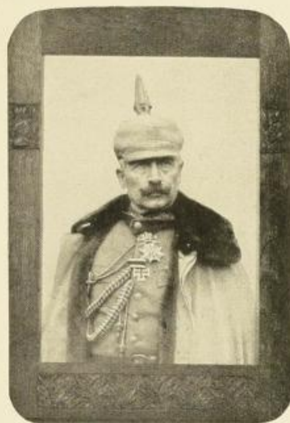
Kaiser Wilhelm II. im Felde Naturaufnahme, Brustbild.

Die neuen für uns besonders geschaffenen Aufnahmen müssen als ganz vorzüglich bezeichnet werden und haben sich schon jetzt einen Ehrenplatz in jedem deutschen Haus errungen. Vom Bildnis des Kaisers wurden bereits weit über tausend Stück an das Königliche Oberhofmarschallamt für eignen Gebrauch Seiner Majestät geliefert, und selbst namhafte Künstler benutzten unsere Originalaufnahme wiederholt als Vorlage für ihre Kaiserbildnisse: wohl der beste Beweis für die unübertroffene Porträtähnlichkeit und hervorragende Ausführung unserer Bilder.