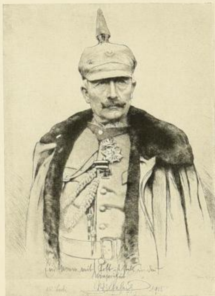
Originalradierung von Hans Weyl.

Die neuen für uns besonders geschaffenen Aufnahmen müssen als ganz vorzüglich bezeichnet werden und haben sich schon jetzt einen Ehrenplatz in jedem deutschen Haus errungen. Vom Bildnis des Kaisers wurden bereits weit über tausend Stück an das Königliche Oberhofmarschallamt für eignen Gebrauch Seiner Majestät geliefert, und selbst namhafte Künstler benutzten unsere Originalaufnahme wiederholt als Vorlage für ihre Kaiserbildnisse: wohl der beste Beweis für die unübertroffene Porträtähnlichkeit und hervorragende Ausführung unserer Bilder.