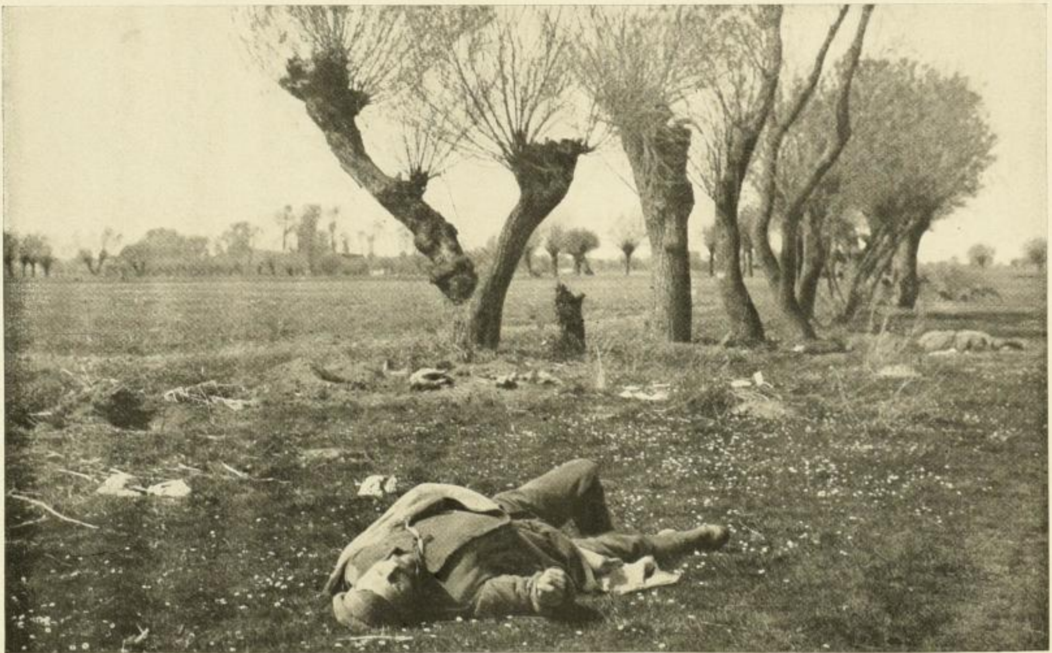
Gefallene Russen am San: aus Morant, Die Ostfront