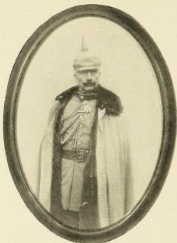
Kaiser Wilhelm II. im Felde Naturaufnahme, Kniebild.