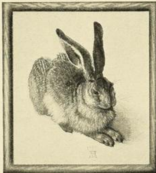
DÜRER, „Hase“ Farbig. Bildgrösse 24,5:20 cm M. 1.— gerahmt in Eiche . . . . . „ 3,50