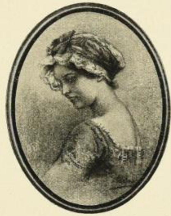
V. SCHRAMM, Manon Orig.-Farb.-Handkupferdr. Bildgr. 33:26,5 cm ohne Rahmen . . . . . M. 15.— in ovalem Goldrahmen . . . . . „ 20.— Farbiger Kupfertiefdruck Bildgr. 24:19 cm ohne Rahmen . . . . . M. 1.— in ovalem Goldrahmen . . . . . „ 4,50 „ „ Mahagoni-Rahmen . . . . . „ 3,50

Betende Hände , Bildgr. 29:19 cm M. 1.—, gerahmt in Birnbaum M. 3,50; Veilchenstrauß , Bildgr. 12:10,5 cm M. 1.—, gerahmt in Kirschbaum, oval M. 4.—; Das kleine Rasenstück , Bildgr. 12:15 cm M. 1.—, gerahmt in Kirschbaum, oval M. 5.—