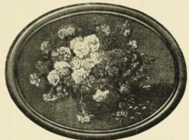
BUCHNER, Nelken. Farbenlichtdruck Bildgrösse 56:75 cm ohne Rahmen . . . . . M. 25.— in gold. Oval-Rahmen . . . . . „ 65.— in schwarz „ „ 50.— Bildgrösse 33:43,5 cm ohne Rahmen . . . . . „ 6.— in schwarz Oval-Rahmen . . . . . „ 15.— Bildgrösse 9:12 cm ohne Rahmen . . . . . „ 0,50 in schwarz Oval-Rahmen . . . . . „ 1,50