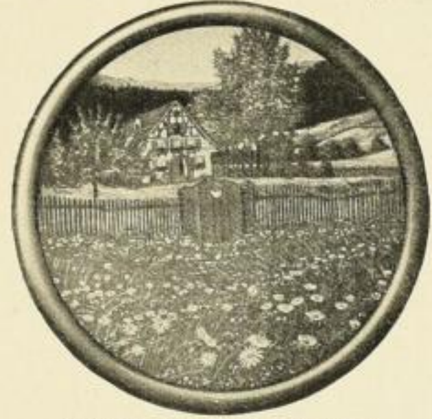
FELGER, Wie einst im Mai Farbig. Bildgrösse 21:21 cm ohne Rahmen . . . . . M. 1.— in schwarzem Rundstab-Rahmen . . . . . „ 3,50