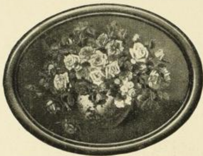
BUCHNER, Rosen. Farbenlichtdruck Bildgrösse 56:75 cm ohne Rahmen . . . . . M. 25.— in gold. Oval-Rahmen . . . . . „ 65.— in schwarz „ „ 50.— Bildgrösse 33:43,5 cm ohne Rahmen . . . . . „ 6.— in schwarz Oval-Rahmen . . . . . „ 15.— Bildgrösse 9:12 cm ohne Rahmen . . . . . „ 0,50 in schwarz Oval-Rahmen . . . . . „ 1,50