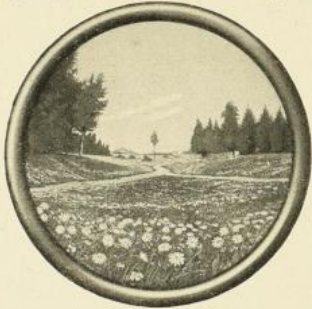
FELGER, Stilles Tal Farbig. Bildgrösse 21:21 cm ohne Rahmen . . . . . M. 1.— in schwarzem Rundstab-Rahmen . . . . . „ 3,50