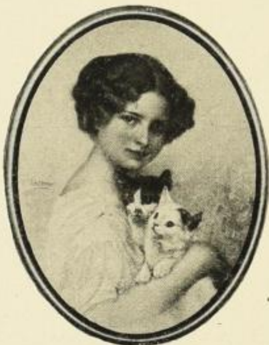
V. SCHRAMM, Drei Kätzchen Orig.-Farb.-Handkupferdr. Bildgr. 33:26,5 cm ohne Rahmen . . . . . M. 15.— in ovalem Goldrahmen . . . . . „ 20.— Farbiger Kupfertiefdruck Bildgr. 24:19 cm ohne Rahmen . . . . . M. 1.— in ovalem Goldrahmen . . . . . „ 4,50 „ „ Mahagoni-Rahmen . . . . . „ 3,50