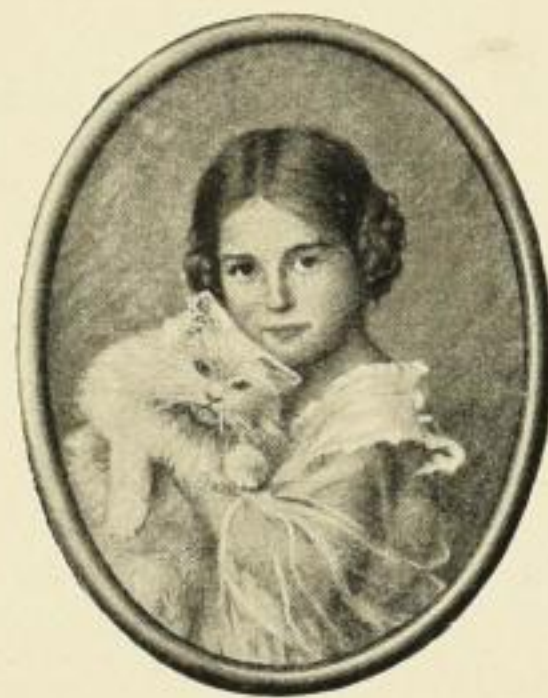
MENGERSHAUSEN, Gute Freunde Farbig. Bildfläche 18:24 cm ohne Rahmen . . . . . M. 1.— in ovalem Goldrahmen . . . . . „ 4,50 „ „ Mahagoni-Rahmen . . . . . „ 3,50