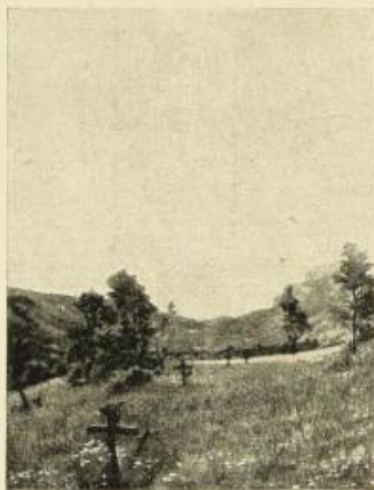
HEUMANN, „Ostermorgen“ Farbig. Bildgrösse 20,5:15,5 cm ohne Rahmen . . . . . M. 1.— in schwarz Oval-Rahmen „ 4.—