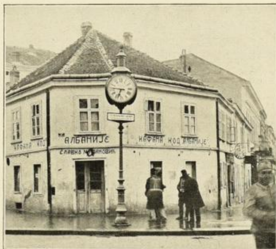
Der Herd des Weltkrieges. Das berühmte Ochran-Kaffeehaus in Belgrad.