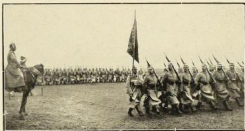
Kaisers Geburtstag in Feindesland. Parade der Truppen vor dem Kronprinzen v. Bayern.

Momentaufnahmen vom Schlachtfelde zeigen uns den grossen Völkerkampf in seiner neuen Gestalt.