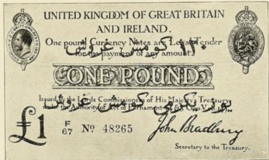
Englische Ein-Pfund-Note mit einem roten Überdruck in türkischen Schriftzügen.