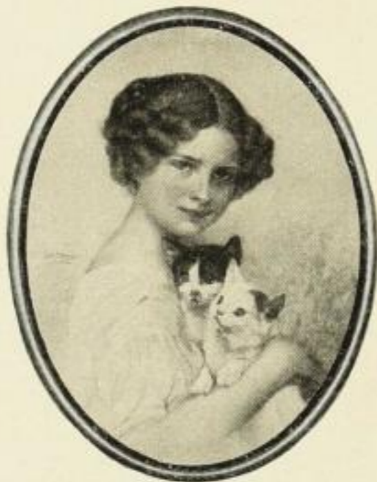
V. SCHRAMM, Drei Kätzchen Orig.-Farb.-Handkupferdr. Bildgr. 33 : 26,5 cm ohne Rahmen . . . . . M. 15.— in ovalem Goldrahmen . . . . . „ 20.— Farbiger Kupfertiefdruck Bildgr. 24 : 19 cm ohne Rahmen . . . . . M. 1.— in ovalem Goldrahmen . . . . . „ 5.— „ „ Mahagoni-Rahmen . . . . . „ 4.—