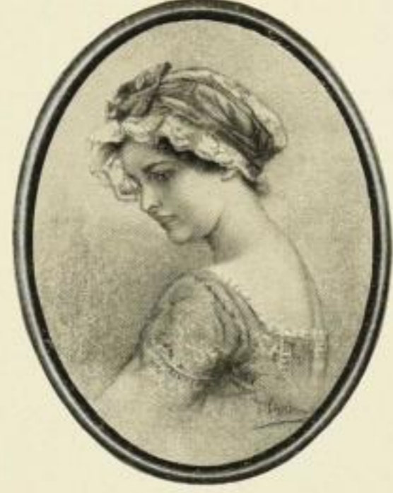
V. SCHRAMM, Manon Orig.-Farb.-Handkupferdr. Bildgr. 33 : 26,5 cm ohne Rahmen . . . . . M. 15.— in ovalem Goldrahmen . . . . . „ 20.— Farbiger Kupfertiefdruck Bildgr. 24 : 19 cm ohne Rahmen . . . . . M. 1.— in ovalem Goldrahmen . . . . . „ 5.— „ „ Mahagoni-Rahmen . . . . . „ 4.—

Betende Hände, Bildgr. 29 : 19 cm M. 1.—, gerahmt in Birnbaum M. 3.50; Veilchenstrauß, Bildgr. 12 : 10,5 cm M. 1.—, gerahmt in Kirschbaum, oval M. 4.—; Das kleine Rasenstück, Bildgr. 12 : 15 cm M. 1.—, gerahmt in Kirschbaum, oval M. 5.—