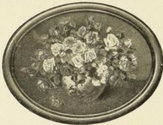
BUCHNER, Rosen. Farbenlichtdruck Bildgröße 56 : 75 cm ohne Rahmen . . . . . M. 25.— in gold. Oval-Rahmen . . . . . „ 65.— in schwarz „ „ 50.— Bildgröße 33 : 43,5 cm ohne Rahmen . . . . . „ 6.— in schwarz Oval-Rahmen . . . . . „ 15.— Bildgröße 9 : 12 cm ohne Rahmen . . . . . „ 0.50 in schwarz Oval-Rahmen . . . . . „ 1.50