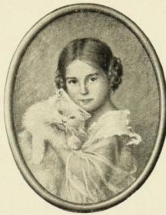
MENGERSHAUSEN, Gute Freunde Farbig. Bildfläche 18 : 24 cm ohne Rahmen . . . . . M. 1.— in ovalem Goldrahmen . . . . . „ 5.— „ „ Mahagoni-Rahmen . . . . . „ 4.—