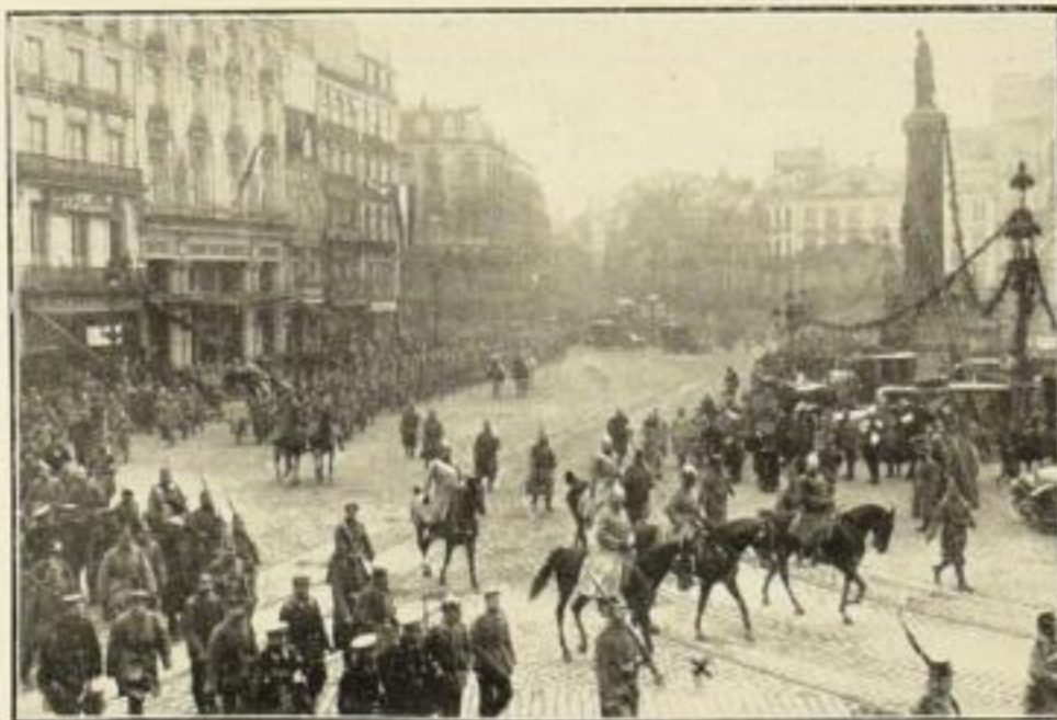
Rückkehr der Truppen von der Parade. An der Spitze der Kronprinz v. Bayern.

Prachtband mit Goldschnitt Preis M. 2.70. Luxus-Ausgabe in Ganzleder mit Gold Preis M. 4. —