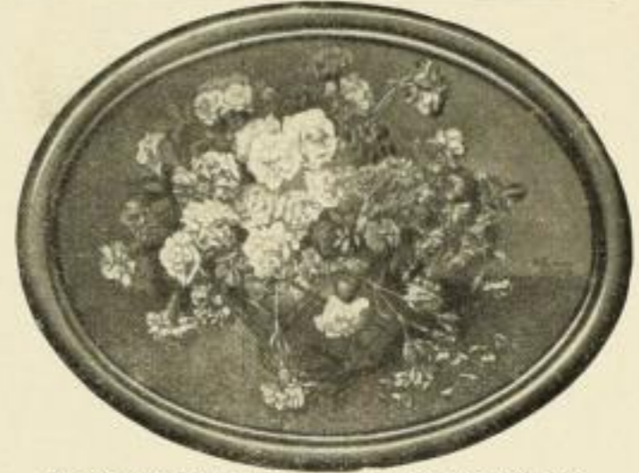
BUCHNER, Nelken. Farbenlichtdruck Bildgröße 56 : 75 cm ohne Rahmen . . . . . M. 25.— in gold. Oval-Rahmen . . . . . „ 65.— in schwarz „ „ 50.— Bildgröße 33 : 43,5 cm ohne Rahmen . . . . . „ 6.— in schwarz Oval-Rahmen . . . . . „ 15.— Bildgröße 9 : 12 cm ohne Rahmen . . . . . „ 0.50 in schwarz Oval-Rahmen . . . . . „ 1.50