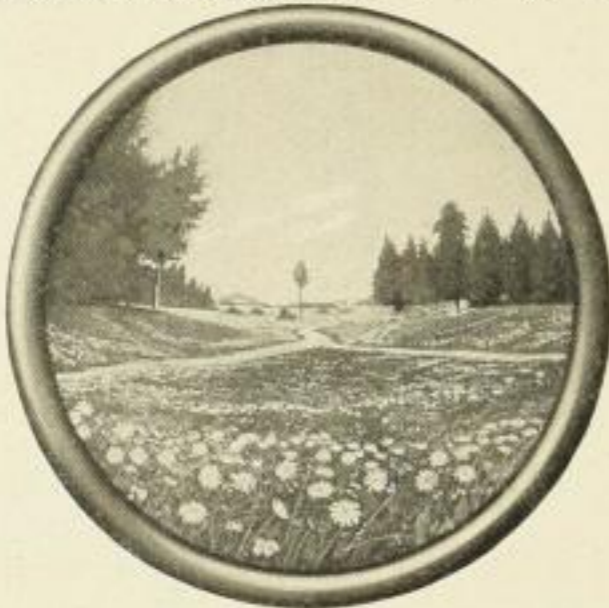
FELGER, Stilles Tal Farbig. Bildgröße 21 : 21 cm ohne Rahmen . . . . . M. 1.— in schwarzem Rundstab-Rahmen . . . . . „ 3.50