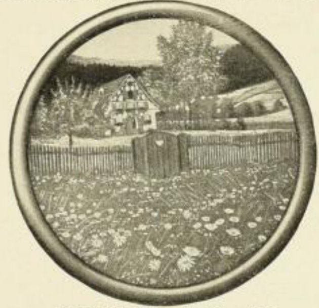
FELGER, Wie einst im Mai Farbig. Bildgröße 21 : 21 cm ohne Rahmen . . . . . M. 1.— in schwarzem Rundstab-Rahmen . . . . . „ 3.50