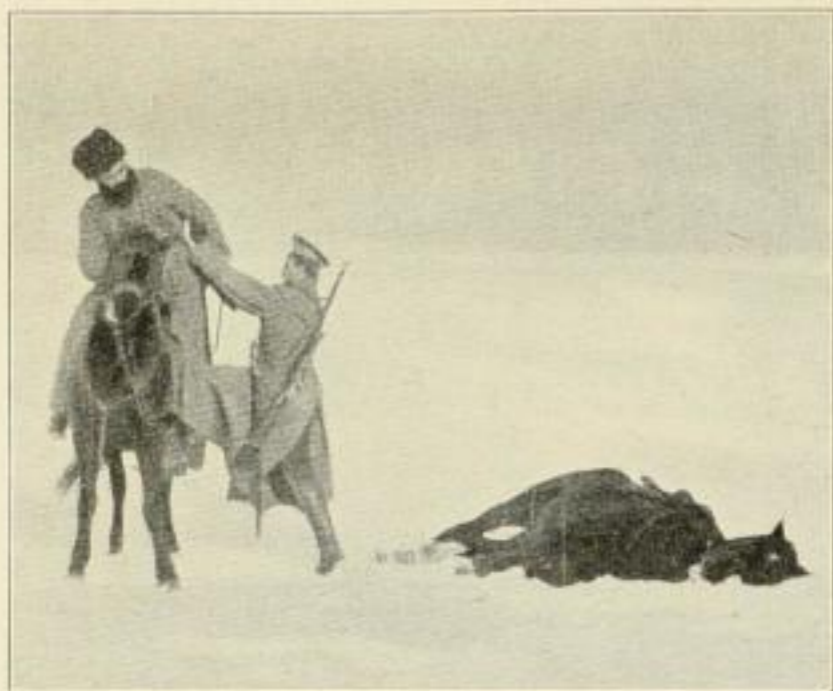
Ein Kosak nimmt einen Kameraden, dessen Pferd den Anstrengungen erlegen ist, mit auf sein Pferd.

Die Dritte Folge meines Kriegswerkes führt uns bis zum 1. Jan. 1916. Die allerletzten Ereignisse, die Eroberung Serbiens, die Saloniki-Geschichte findet man schon mit zahlreichen photographischen Abbildungen und Dokumenten vertreten. Einen besonderen Wert erhält dieser Band durch die vielen seltenen, bis jetzt