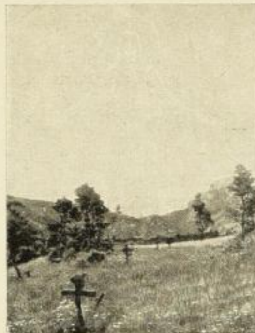
HEUMANN, „Ostermorgen“ Farbig. Bildgröße 20,5 : 15,5 cm ohne Rahmen . . . . . M. 1.— in schwarz Oval-Rahmen „ 4.—