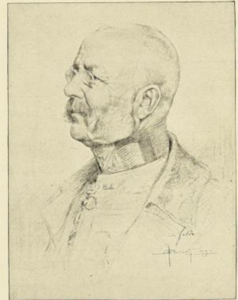
Feldmarschall Erzherzog Friedrich.

nur bis 1. Juni unter Berufung auf diese Anzeige.