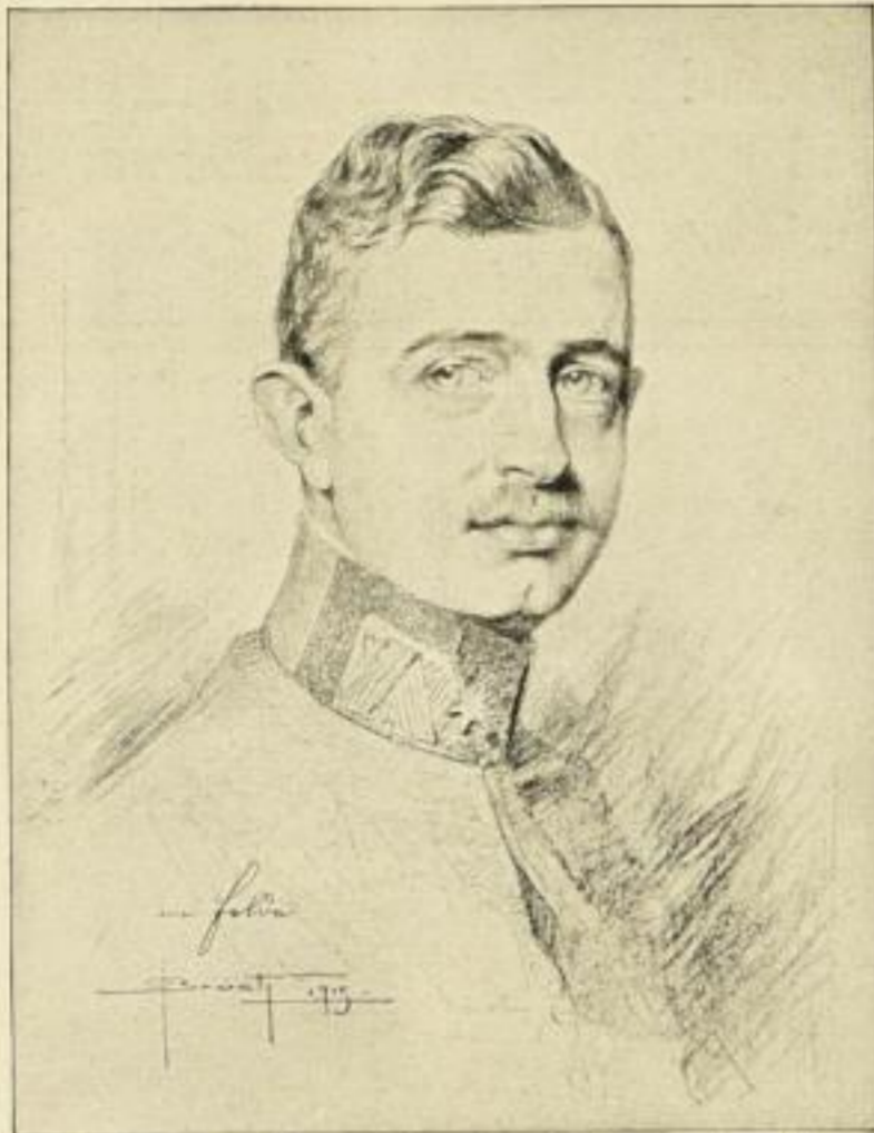
Erzherzog-Thronfolger Karl Franz Joseph.

Bildgröße 28,5 : 22 cm, Papiergröße 54,5 : 37 cm.