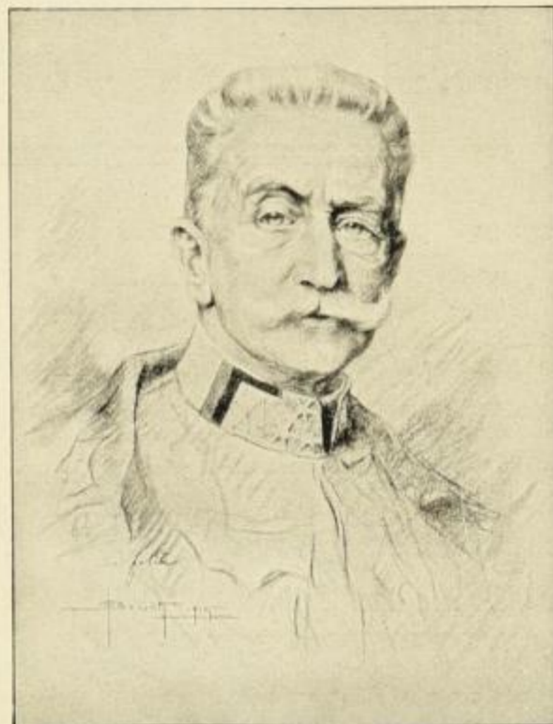
Generaloberst Conrad von Hötzendorf.

Neuer illustrierter Prospekt über unsere Bildnisfolge „Deutschlands Führer in großer Zeit“ auf Wunsch unberechnet und portofrei.