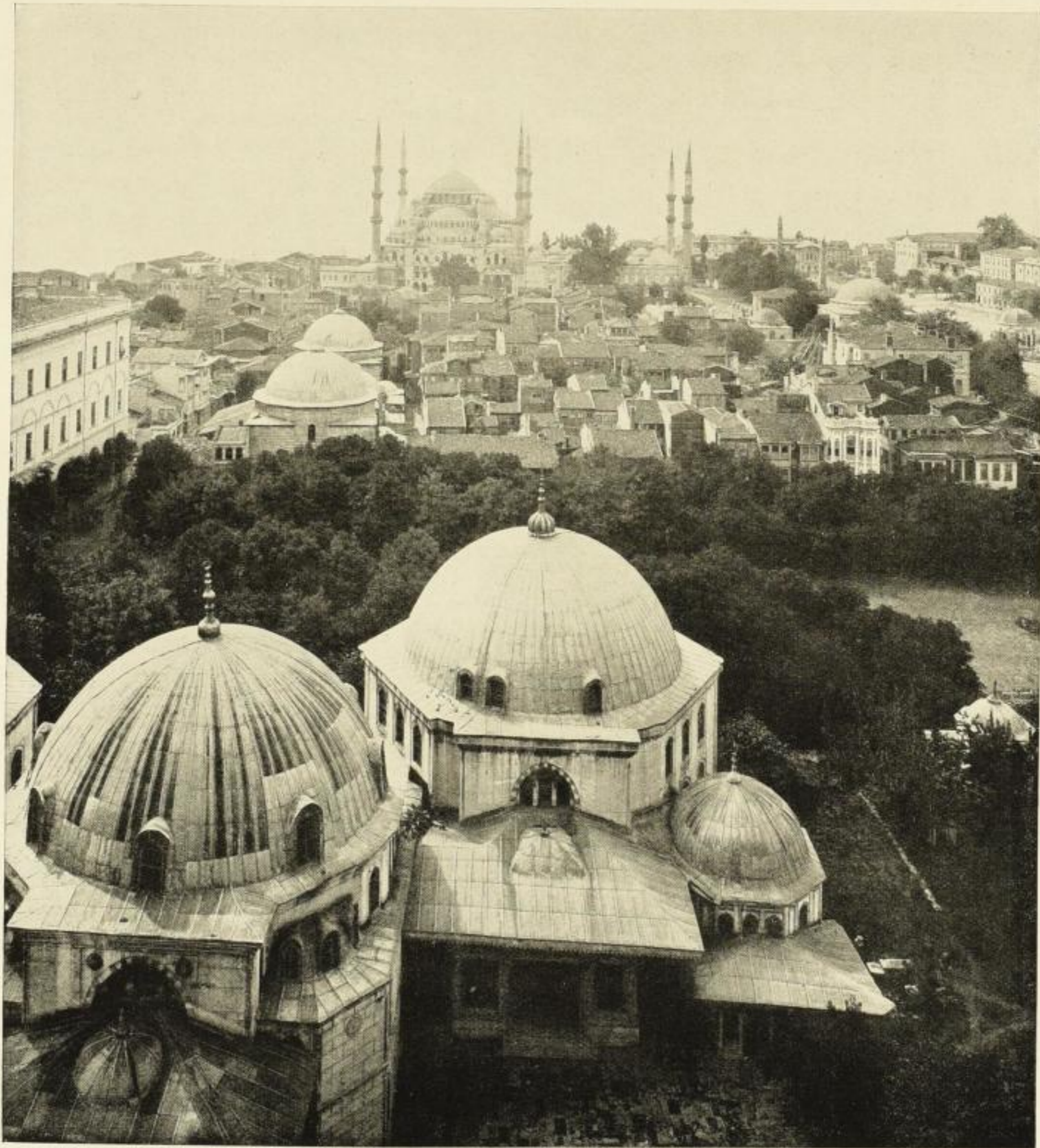
Konstantinopel. Blick von der Hagia Sophia auf Achmedmoschee und Hippodrom (rechts der Kaiser Wilh.-Brunnen).