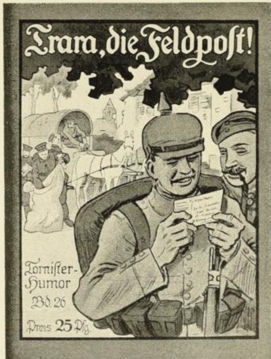
Tornister-Humor Bd. 26 Preis 25 Pf.