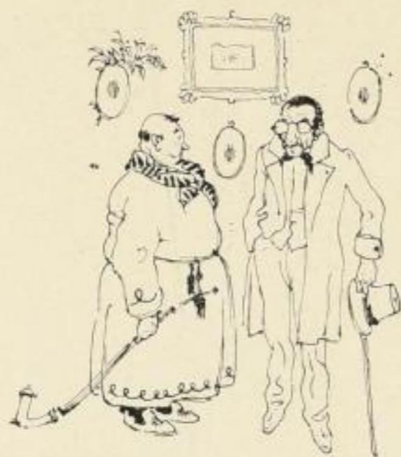
(Im Buche mehrfarbig)

Fast vergessen ist diese unbeschreiblich drollige und dabei anheimelnde Biedermeier-Humoreske aus der Zeit der ersten Eisenbahnzüge; so schlagend ist ihr Witz, so liebenswürdig, daß selbst der Kummervolle ihrem Bann nicht widerstehen kann. Unnützlich zu sagen, daß Emil Preectorius durch diesen anregungsreichen Stoff zu außergewöhnlichen Kabinettstückchen seiner graziösen und humorvollen Kunst angeregt wurde.