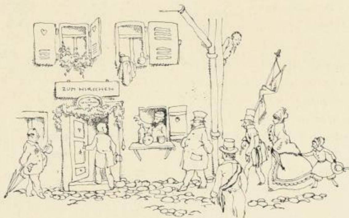
(Im Buche mehrfarbig)

Kartoniert Mk. 28.— später Mk. 32.— Vorzugsausgabe Mk. 100.— später Mk. 200.— Mappe mit Erstabzügen auf Japan, signiert, ebenso.