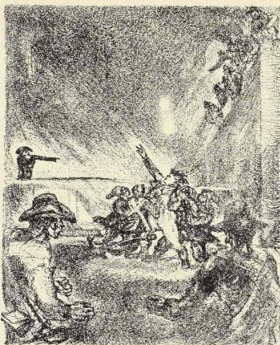
Probekbild von Walo von May zu Büchner, Danton's Tod