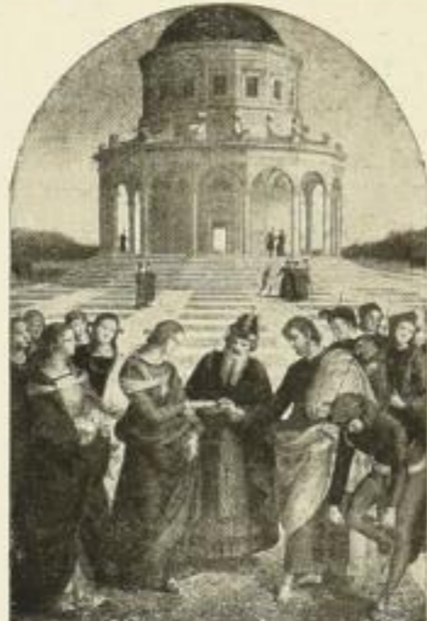
Mariä Vermählung Raffael