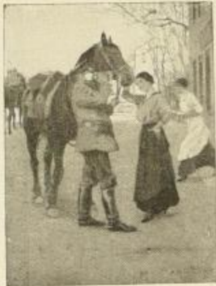
„Ein frischer Trunk“

Albert Langen, Verlag für Literatur und Kunst in München