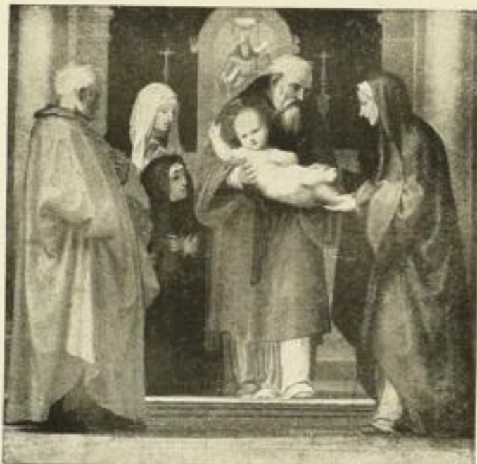
Darstellung Jesu im Tempel. Fra Bartolommeo

die sich infolge ihrer originalgetreuen Wiedergabe eines sehr großen Beifalles des Publikums erfreuen.