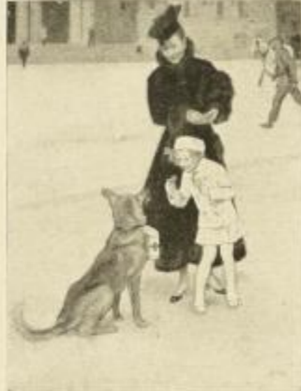
„Fürs Rote Kreuz“