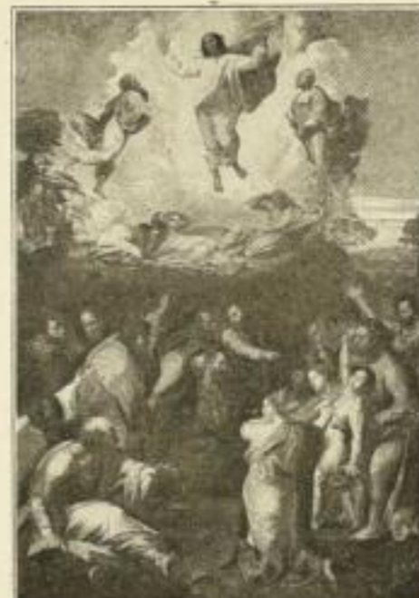
Verklärung Christi Raffael