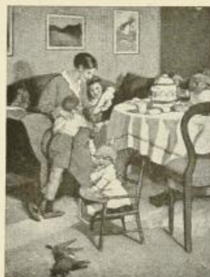
„Gute Nachrichten v. d. Front“