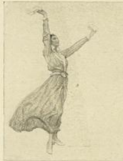
„In der Heimat, in der Heimat...“