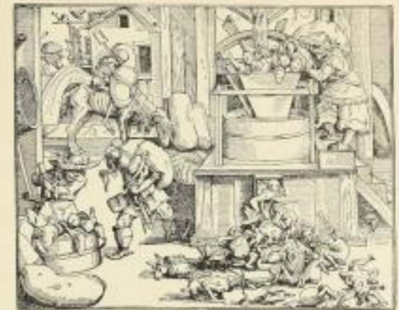
Werkstatt von Tobias Stimmer. Holzschnitt mit Kupferdruck aus dem Jahre 1841.