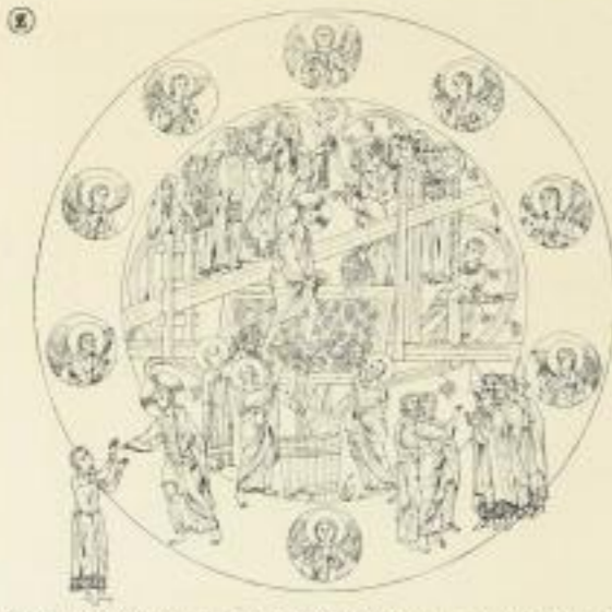
Salmagundi von der Salmafprobe. Horatio Delicaram. Der Kunst der Zeichnung 1891/1900.