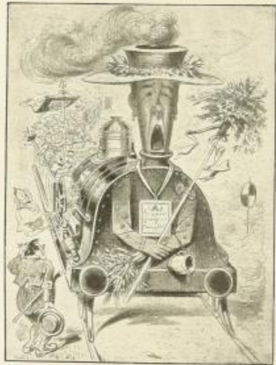
Die Karikatur des Weltkrieger zum ersten Male bei Enzler - Wien 1916.