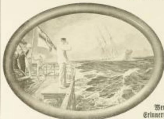
Der letzte Gruß.

Ein Bild bei Kämpfern... I. Künstlicher Lichtdruck III. 4.—, in Eiche gerahmt (34 x 53 cm) III. 13.—, oval gerahmt (36 x 44 cm) III. 15.—, oval. II. Einfarbiger Hand-Kupferdruck III. 15.—, in Eiche gerahmt (72 x 92 cm) III. 50.—, oval. III. Farbiges Hand-Kupferdruck III. 20.—, in Eiche gerahmt (72 x 92 cm) III. 100.—, oval. Vergroßert: I. Bildgröße 21 x 27 cm, mit Rahmen 28 x 36 cm III. 4.—, oval. II. Bildgröße 30 x 34 cm, mit Rahmen 38 x 42 cm III. 25.—, oval. III. Bildgröße wie bei II. III. 40.—, oval.