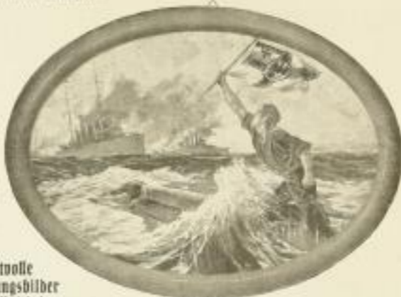
Der letzte Mann.

Ein Bild bei Kämpfern... I. Künstlicher Lichtdruck III. 4.—, in Eiche gerahmt (34 x 53 cm) III. 13.—, oval gerahmt (36 x 44 cm) III. 15.—, oval. II. Einfarbiger Hand-Kupferdruck III. 15.—, in Eiche gerahmt (72 x 92 cm) III. 50.—, oval. III. Farbiges Hand-Kupferdruck III. 20.—, in Eiche gerahmt (72 x 92 cm) III. 100.—, oval. Vergroßert: I. Bildgröße 21 x 27 cm, mit Rahmen 28 x 36 cm III. 4.—, oval. II. Bildgröße 30 x 34 cm, mit Rahmen 38 x 42 cm III. 25.—, oval. III. Bildgröße wie bei II. III. 40.—, oval.