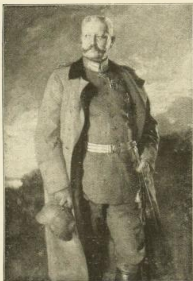
No. 280. ISER, Der Kaiser im Felde. Bildgröße 62 1/2 x 103 cm . . . . . M. 35.— Im Eichenrahmen 78 x 119 cm . . . . . M. 75.— Im Goldrahmen 80 x 121 cm . . . . . M. 75.— Im Bronze-Patina-Rahmen 80 x 121 cm . . . M. 90.—