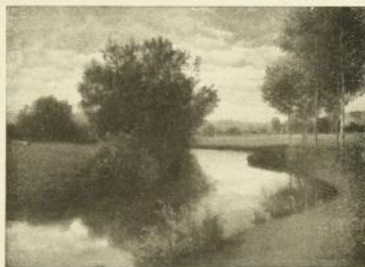
No. 182. H. RÜDISÜHLI: Wiesenbach. Bild 34 x 48 cm, weiss. Karton 56 x 72 cm M. 12.50