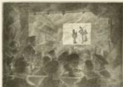
Im Kino des Marinekorps.

Wertvolle Erinnerungsbilder an den Weltkrieg.