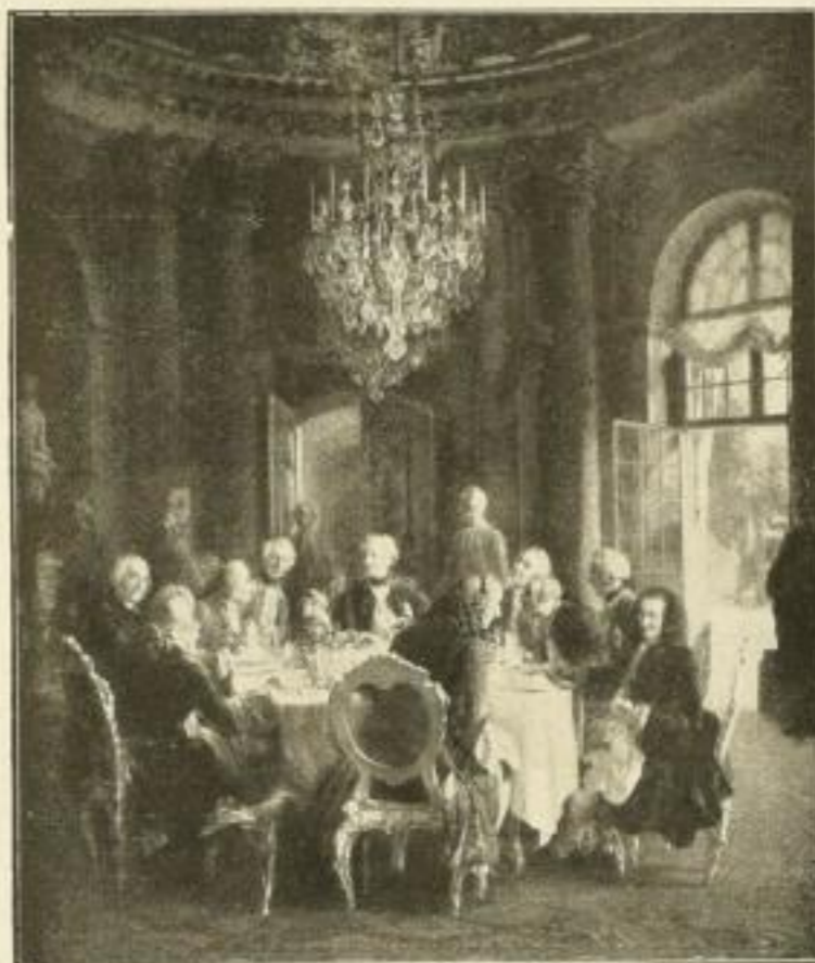
No. 185. A. v. MENZEL: Tafelrunde Friedrichs d. Gr. Bild 52 x 62 cm, weiss. Karton 75 x 97 cm M. 25.— Im Gold-Rokoko-Rahmen 65 x 78 cm . . . M. 55.—