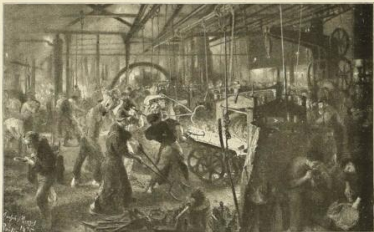
No. 281. A. v. MENZEL: Eisenwalzwerk (National-Galerie, Berlin). Bildgröße 58 1/2 x 94 3/4 cm M. 50.— Im Eichenrahmen 75 x 111 cm M. 80.—, Im Goldrahmen 74 x 110 cm M. 100.—