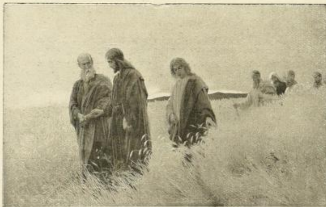
No. 137. J. R. WEHLE: Und sie folgten ihm nach. Grosse Ausgabe: Bild 47 x 74 cm, im Passepartout 72 x 98 cm M. 25.— Mittlere Ausgabe: Bild 34 x 54 cm, weisser Karton 55 x 72 cm M. 12.50 Kleine Ausgabe: Bild 20 x 31 cm, weisser Karton 40 x 51 cm M. 6.25