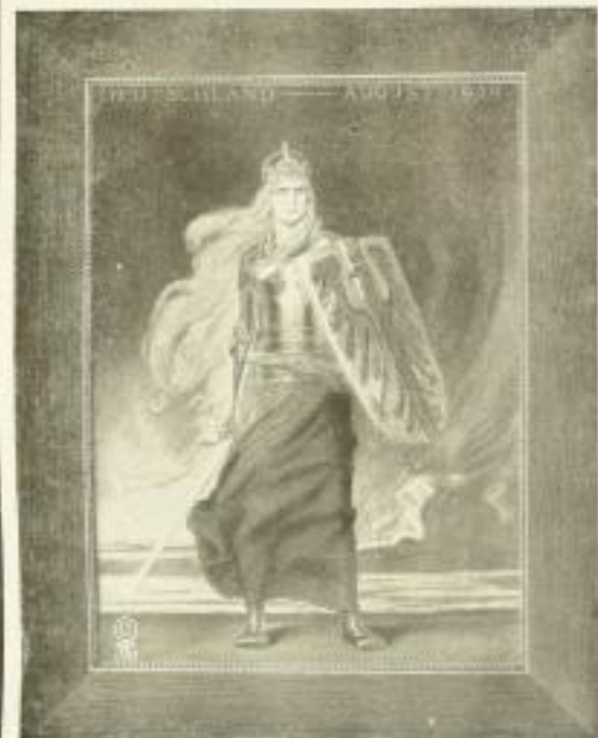
Deutschland - August 1914.

Ein Bild bei Kämpfern... I. Künstlicher Lichtdruck III. 4.—, in Eiche gerahmt (34 x 53 cm) III. 13.—, oval gerahmt (36 x 44 cm) III. 15.—, oval. II. Einfarbiger Hand-Kupferdruck III. 15.—, in Eiche gerahmt (72 x 92 cm) III. 50.—, oval. III. Farbiges Hand-Kupferdruck III. 20.—, in Eiche gerahmt (72 x 92 cm) III. 100.—, oval. Vergroßert: I. Bildgröße 21 x 27 cm, mit Rahmen 28 x 36 cm III. 4.—, oval. II. Bildgröße 30 x 34 cm, mit Rahmen 38 x 42 cm III. 25.—, oval. III. Bildgröße wie bei II. III. 40.—, oval.