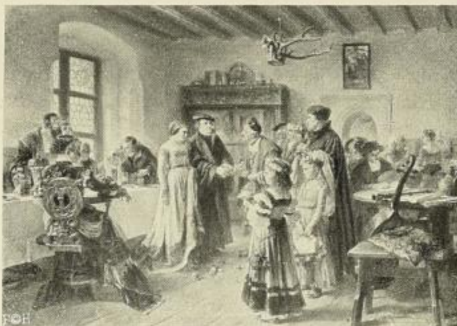
K. Weigandt, Luthers Hochzeit.

Die angeführten Größen geben das Papierformat an, die Bildgrößen sind entsprechend kleiner.