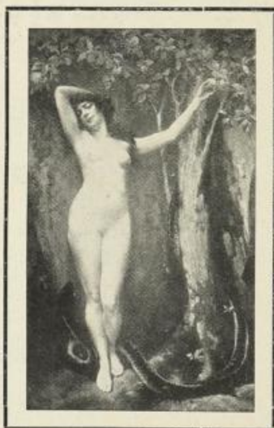
Probe-Abbildung aus „Frauen-Schönheit“