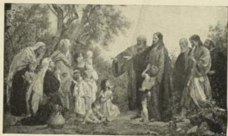
Nr. 132. SCHMID: Lasset die Kindlein . . . Bild 43 x 74 cm . . . . . M. 30.—