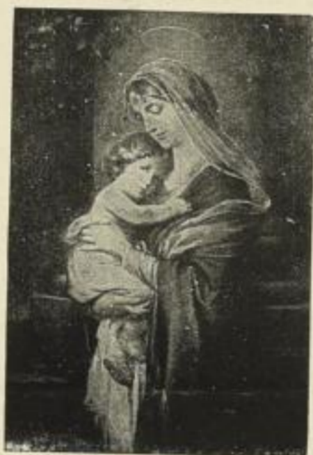
Nr. 153. UNTERSBERGER: Madonna. Bild 65 x 97 cm . . . . . M. 30.—