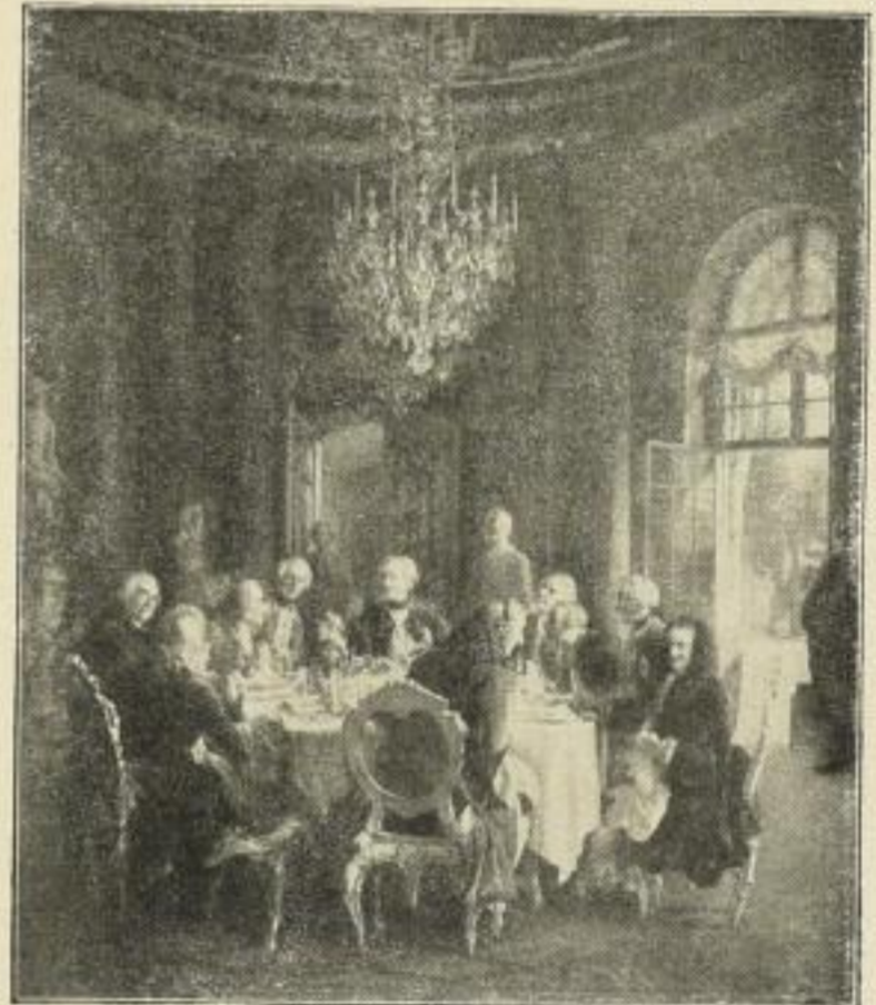
Nr. 185. MENZEL: Tafelrunde Friedrichs des Grossen. Bild 52 \times 62 cm, weisser Rand 76 \times 97 cm . . . M. 30.—