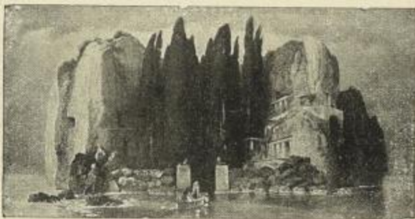
Nr. 146. BÖCKLIN: Die Insel der Toten. Bild 35\frac{1}{2} \times 68 cm, weisser Rand 58 \times 86 cm M. 30.—

Rabattangabe finden Sie 3 Seiten weiter!