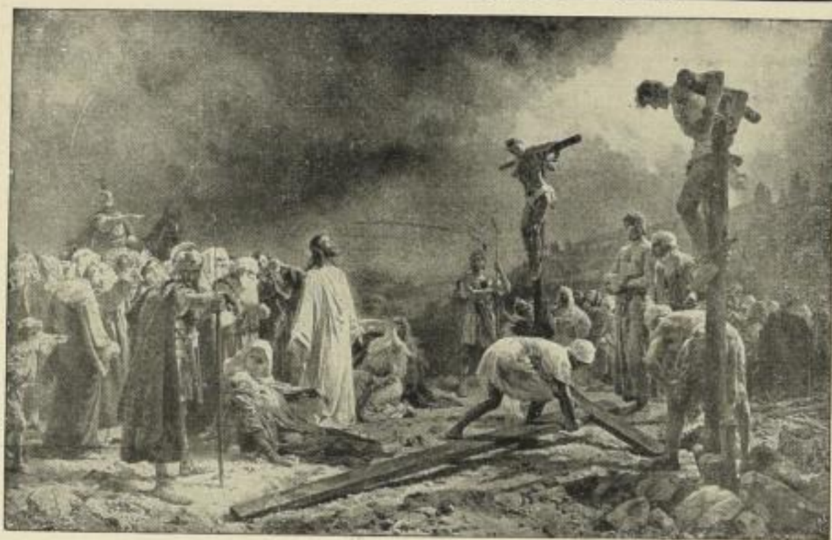
Nr. 176. CLEMENTZ: Golgatha. Bild 61 1/2 x 96 1/2 cm . . . . . M. 45.—