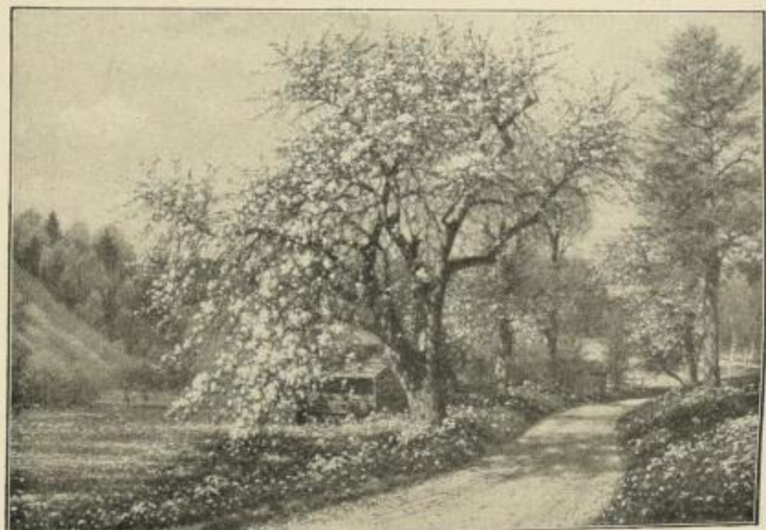
Nr. 289. MÜLLER-LANDECK: Frühling. Bild 63\frac{1}{2} \times 91\frac{1}{2} cm M. 45.—