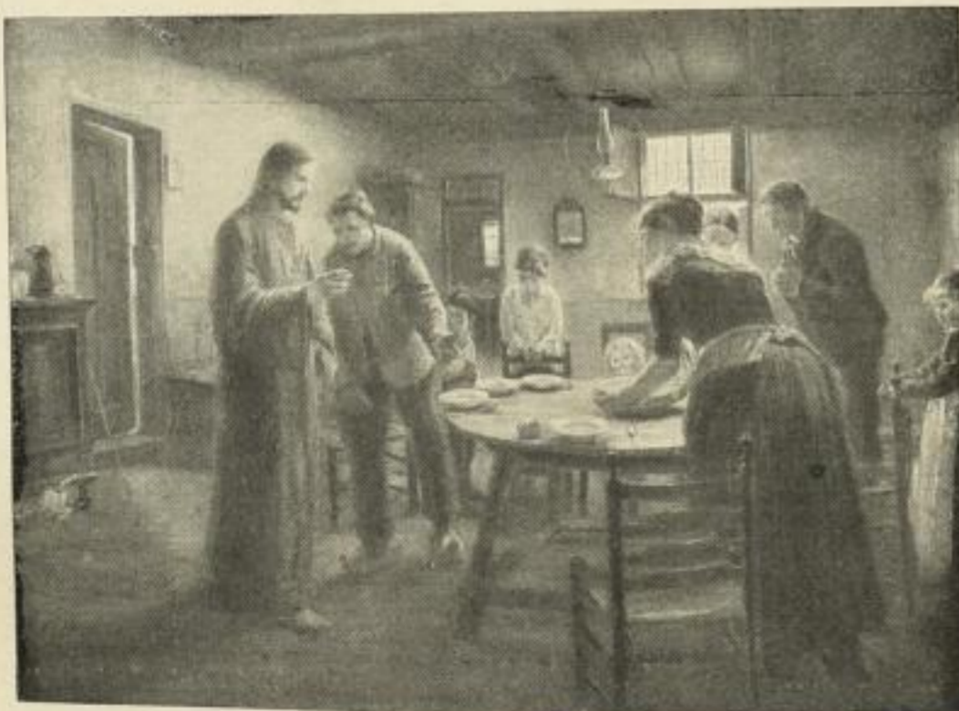
Nr. 271. UHDE: Komm, sei unser Gast. Bild 50x68 cm, Rand 72x94 cm M. 30.—