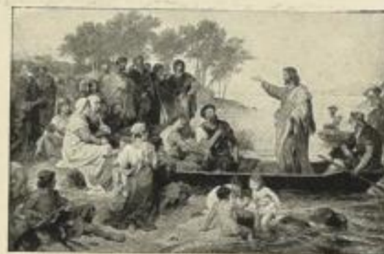
HOFMANN: Seepredigt. Nr. 200. Bild 46 x 71 1/2 cm M. 30.— Nr. 200c. Bild 63 x 98 cm . M. 45.—