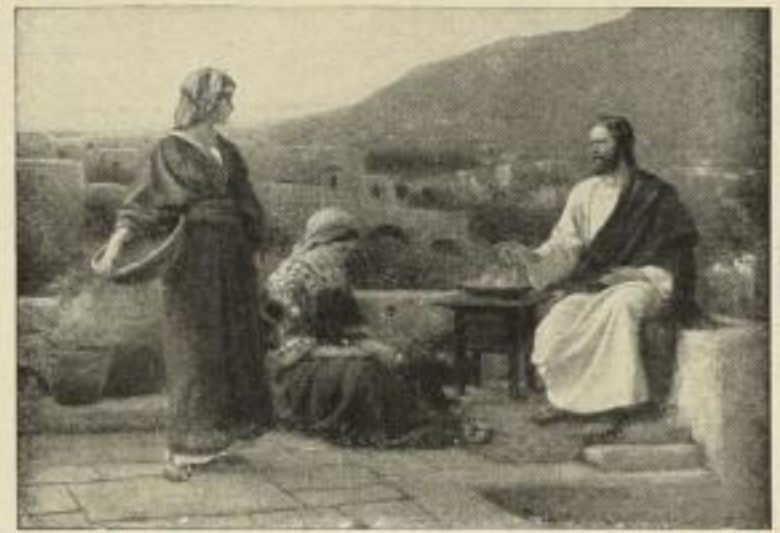
Nr. 165. SEEGER: Jesus bei Maria und Martha. 50x71 cm . . . . . M. 30.—