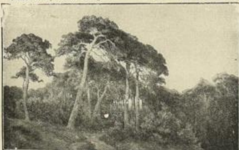
Nr. 66. MEISSNER: Märk. Wald. 27x42 1/2 cm M. 15.—

Dass. Bild, kleine Ausgabe, Bild 34 1/2 x 44 1/2 cm M. 15.—