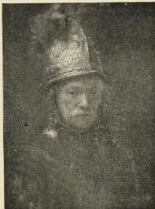
Nr. 292. REMBRANDT: Mann m. Goldhelm. 50x67 cm M. 30.—