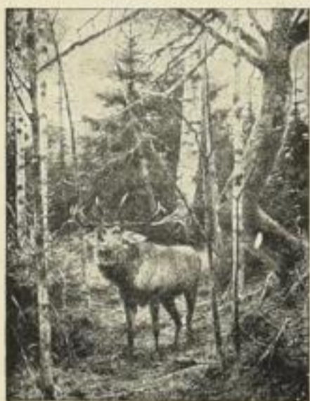
Nr. 52. FRIESE: Rothirsch. Bild 53x69 cm M. 30.—

Dass. Bild, kleine Ausgabe, Bild 34 1/2 x 44 1/2 cm M. 15.—