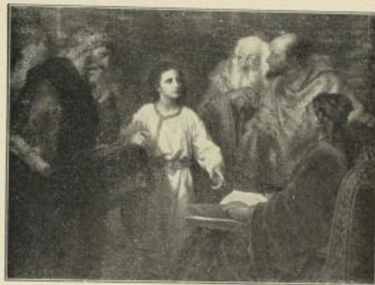
Nr. 249. HOFMANN: Der 12jährige Jesus im Tempel. Bild 50 x 67 1/2 cm . . . . . M. 30.—