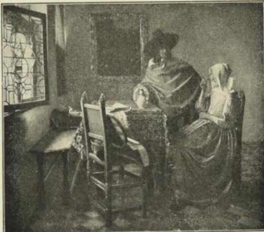
Nr. 224. VERMEER: Herr und Dame beim Wein. 53x63 cm M. 30.—