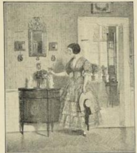
Nr. 273. BAYERLEIN: Tage der Rosen. Bild 43x51 cm, Rand 61x73 cm M. 15.—