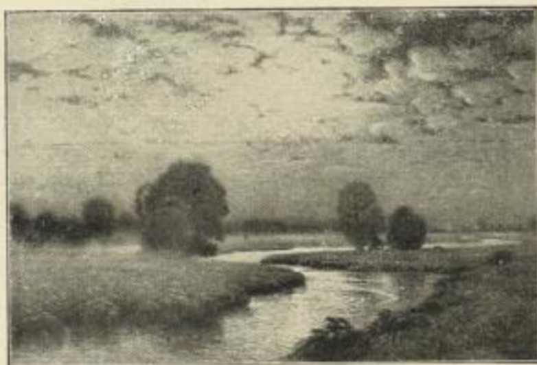
Nr. 214. HARTIG: Mondnacht. Bild 47 1/2 x 78 1/2 cm, weisser Rand 73x98 cm M. 30.—

Obiger Rahmen vergriffen. Im Rahmen wie bei Nr. 258. Fröschl (siehe vorige Seite) M. 180.—