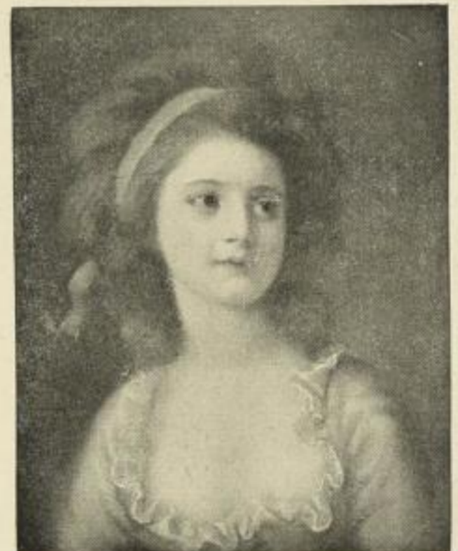
Nr. 267. Portrait der Gräfin Potocka. Bild 39x49 cm, Rand 56x72 cm M. 15.—