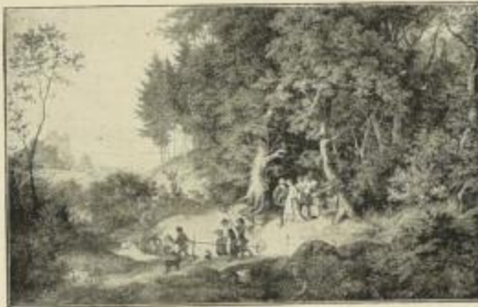
Nr. 213. RICHTER: Brautzug i. Frühling. 46x74 cm, Rand 75x95 cm M. 30.— „ 213c. „ „ „ 60x97 „ „ M. 45.—