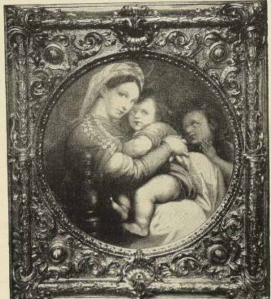
Nr. 2. RAFAEL: Madonna della Sedia. Bild 70 cm Durchmesser M. 45.—

Obiger Rahmen vergriffen. Im Rahmen wie bei Nr. 258. Fröschl (siehe vorige Seite) M. 180.—