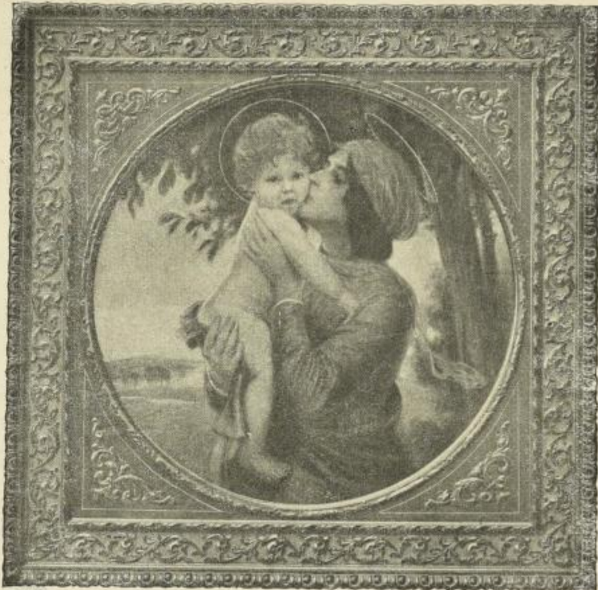
Nr. 258. FRÖSCHL: Madonna. Bild 64\frac{1}{2} cm Durchmesser . . . . M. 30.— In obigem Gold-Renaissance-Rahmen 89 \times 89 cm . . . . . M. 172.—

Farbige Kunstblätter nach berühmten Gemälden alter und neuer Meister.