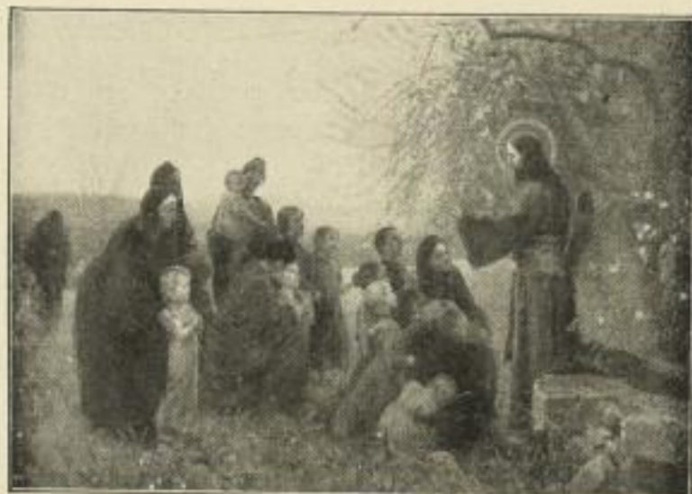
Nr. 225. FUGEL: Jesus die Kindern segnend. Bild 50 \times 72 cm . . . . . M. 30.—

Rabattangabe finden Sie 3 Seiten weiter!