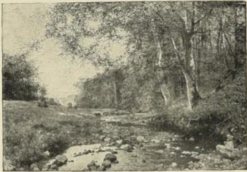
Nr. 138. FLICKEL: Harzlandschaft. Bild 63x90 cm . . . . . M. 45.—