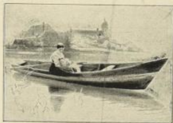
Nr. 192 RAUPP: Friede. Bild 63 x 92 cm, M. 45.—