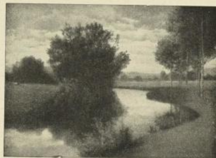
Nr. 182. RÜDISÜHLI: Wiesebach. Bild 34 x 48 cm, weisser Rand 56 x 72 cm M. 15.— Als Gegenstück erschien: Nr. 183: KOPP: Feldweg.