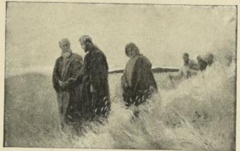
Nr. 137. WEHLE: Und sie folgten ihm nach. Bild 47 \times 74 cm M. 30.— Nr. 137a. Bild 34 \times 54 cm, weisser Rand 55 \times 72 cm M. 15.— Nr. 137b. Bild 20 \times 31 cm, weisser Rand 40 \times 51 cm M. 7.50