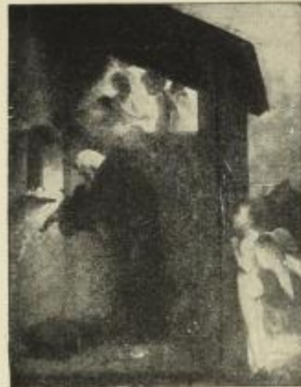
Nr. 81. BÖCKLIN: Eremit. 48x63 cm . . . . . M. 30.—