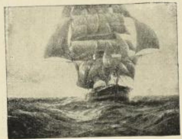
Nr. 188. PETERSEN: Hochsee. Bild 71x92 cm M. 45.—