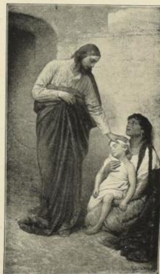
Nr. 262. MAX: Jesus heilt . . . 42 x 73 cm M. 30.—