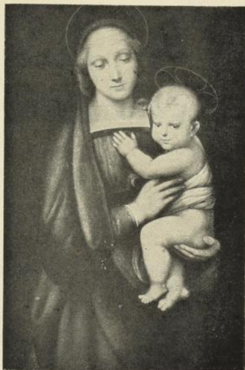
Nr. 3. RAFAEL: Madonna del Granduca. 54 x 81 cm M. 45.—