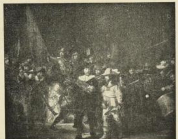
Nr. 198. REMBRANDT: Nachtwache. 73x88 cm M. 45.—

Rabatt: 40% wenn Bild mit Rand, 50% wenn Bild ohne Rand. 7/6 in gleicher Preislage.