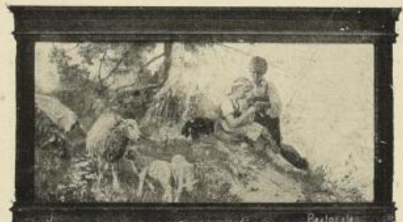
Nr. 53. MEYERHEIM: Pastorale. Bild 24x49 cm M. 15.—