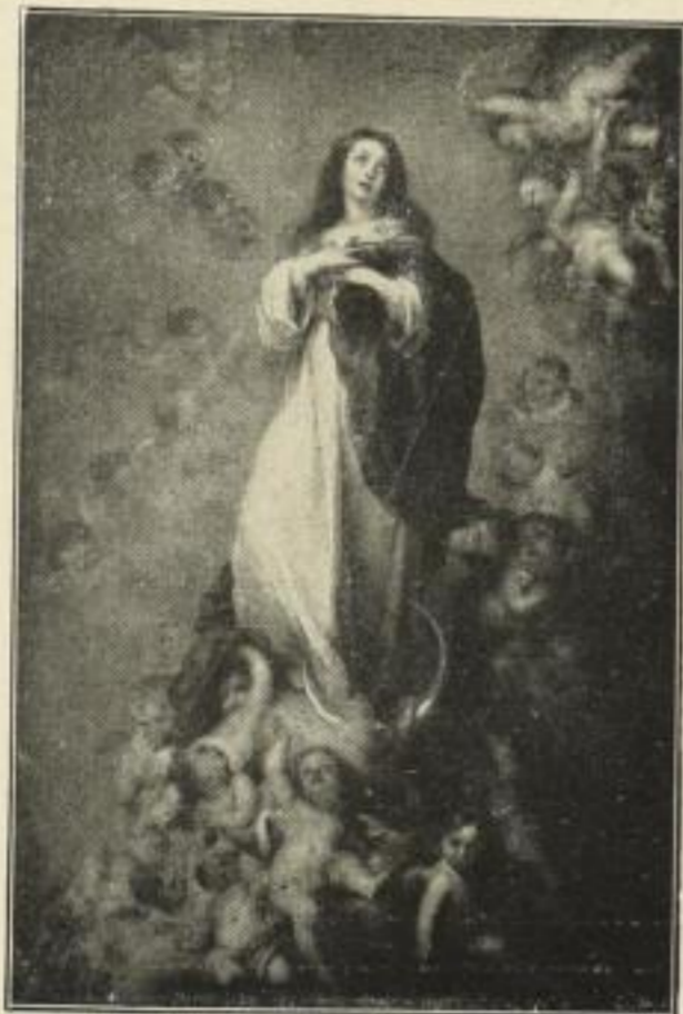
Nr. 241. MURILLO. Immaculata. 64 x 95 cm M. 45.—