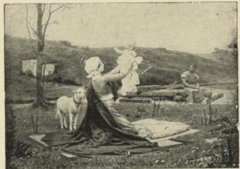
Nr. 172. ZENISEK: Heilige Familie. Bild 72x99 cm M. 30.—