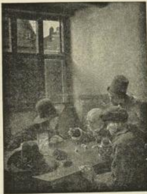
Nr. 196. CL. MEYER: Würfler. 51x66 cm M. 30.—