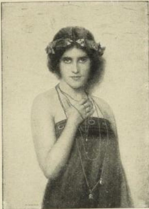
Nr. 108. NONNENBRUCH: Jugend. 44x63 cm M. 30.—