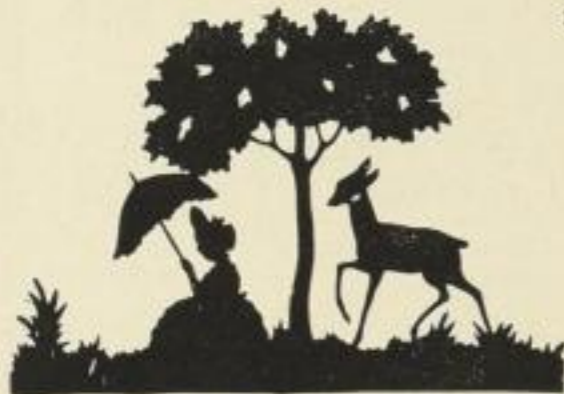
34. Das Rehlein. 8 M.