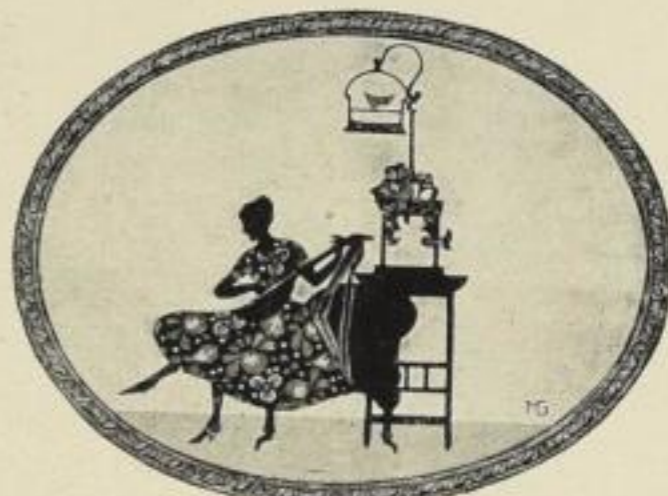
Bei der Laute

Bildgröße: 18×24 cm Karton: 20,5×25,5 cm