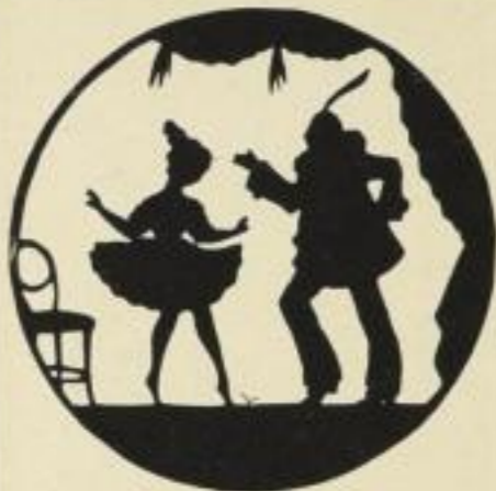
21. Fasching. 9 M.