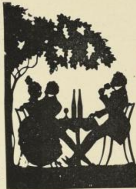
30. Bei einem Wirt wundermild. 12 M.