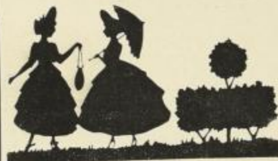
33. Promenade. 10 M.