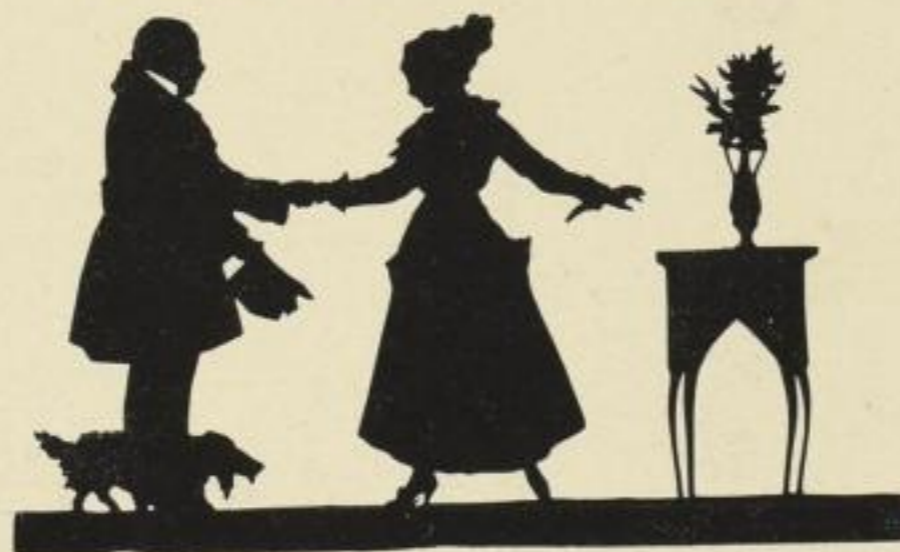
39. Besuch. 8.50 M.