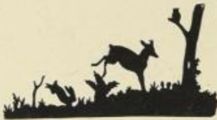
25. Waldidyll. 6 M.