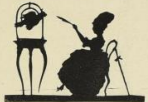
28. Ihr Liebling. 8 M.