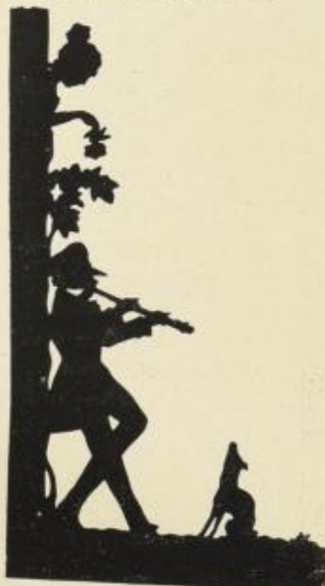
38. Ein Ständchen. 7 M.