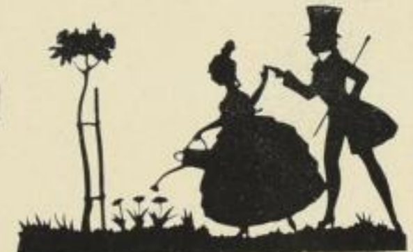
37. Tändelei. 10 M.