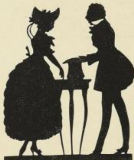
35. Werbung. 8 M.