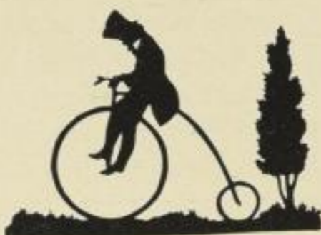
26. Bahn frei. 8 M.