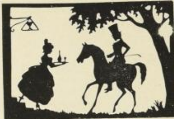
29. Morgentrunf. 10 M.