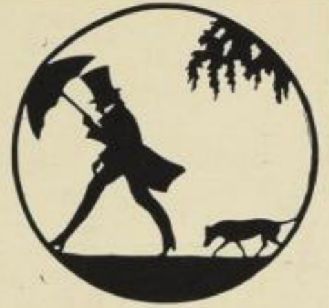
24. Windig. 7.50 M.