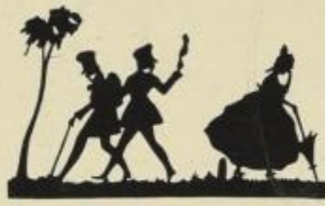
23. Geschieden muß sein. 8 M.