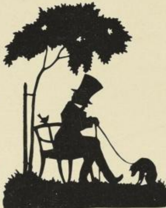
31. Weltentrübt. 10 M.