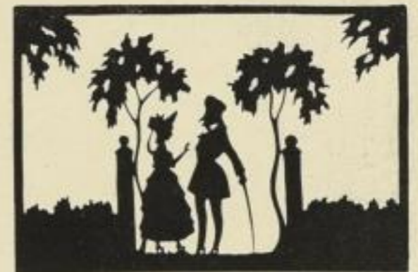
32. Rendez-vous. 12 M.