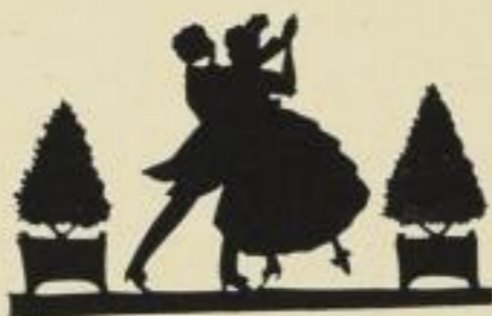
22. Wiener Walzer. 10 M.