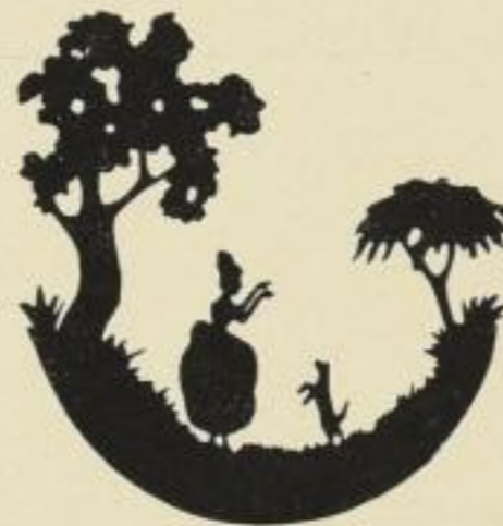
36. Bitte, bitte. 7 M.