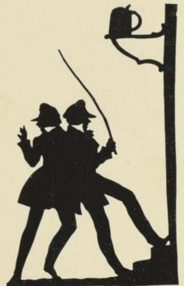
40. Früh um fünf. 8 M.