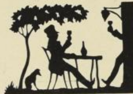
27. Ein guter Tropfen. 8 M.