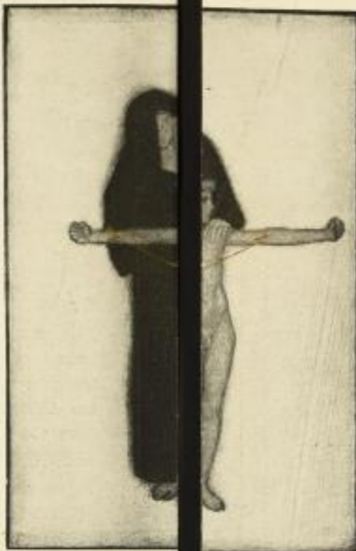
Das Gefühl der Abhängigkeit