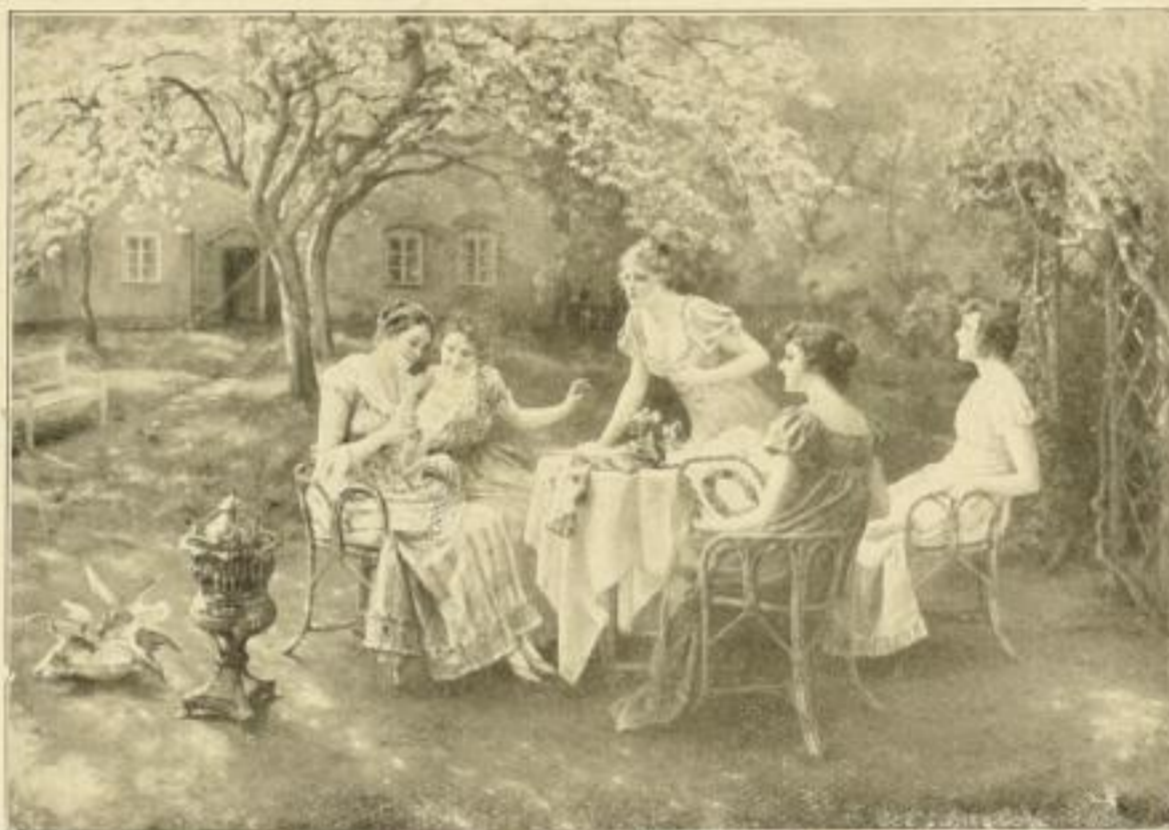
H. Koch, Indiskretionen Bild 34×47 cm, Karton 59×73 cm M. 12.—