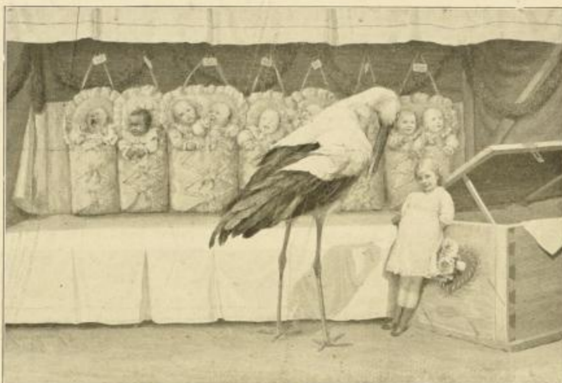
A. Grimm, Wer die Wahl hat . . . . . Bild 31×47 cm, Karton 58×76 cm M. 6.—