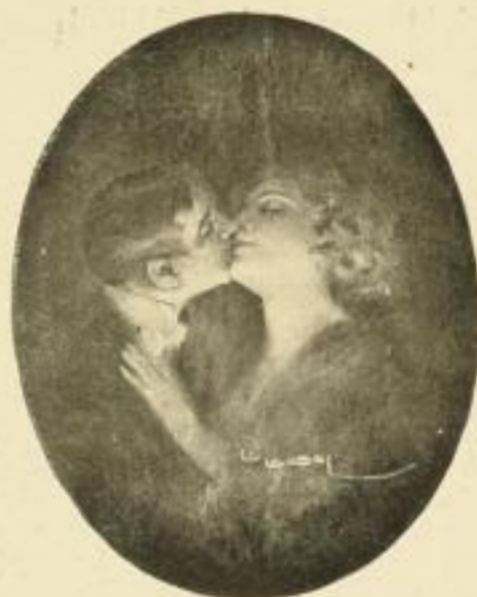
L. Usabal, Seligkeit Bild 19×24 cm, Karton 25×32 cm M. 2.50