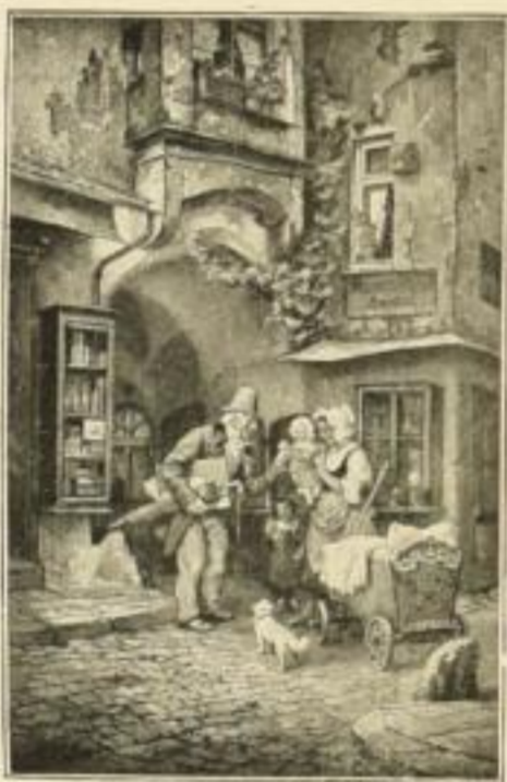
J. Frank, Nesthäkchen Bild 28×19 cm, Karton 44×34 cm M. 4.—