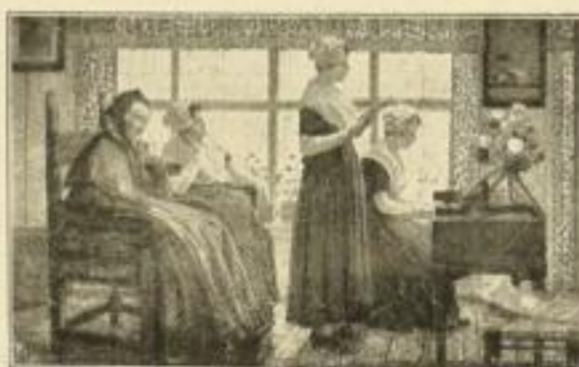
W. Firlé, Sonntagsmorgenfeier Bild 22×29 cm, Karton 32×40 cm M. 4.—