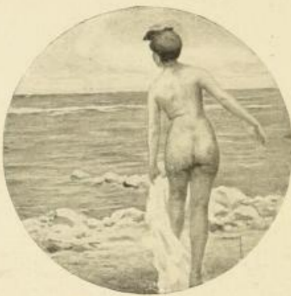
L. Usabal, Sommertag Bild 24×24 cm M. 2.50

auf den Markt bringe, die ihrer künstlerischen Qualität, einwandfreien technischen Ausführung und Gangbarkeit wegen lebhaftes Interesse erregen werden. Von meinen Neuheiten kann ich, des beschränkten Raumes halber, nur die nachstehend als »demnächst erscheinend« zur Ankündigung bringen: