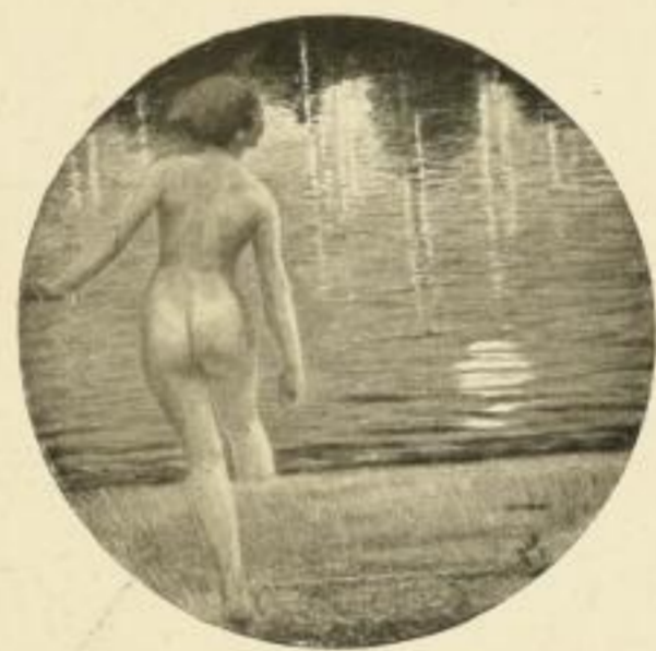
L. Usabal, Sommernacht Bild 24×24 cm M. 2.50