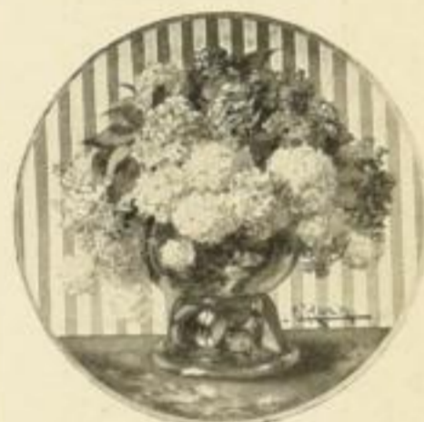
C. Koch, Flieder Bild 24×24 cm M. 2.50