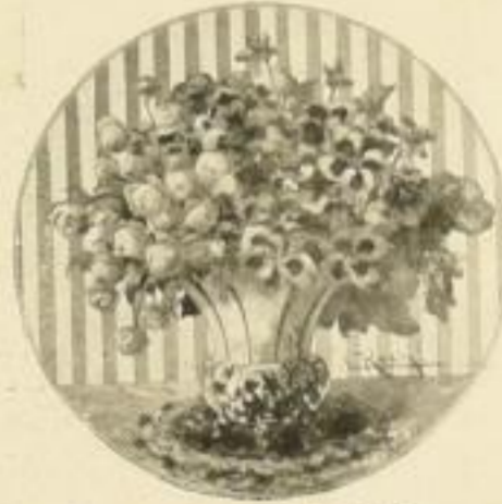
C. Koch, Sumpfdotterblumen Bild 24×24 cm M. 2.50

Bezugsbedingungen: Sämtliche Kunstblätter liefere ich mit 40% Rabatt und mit Freiemplar 11/10.