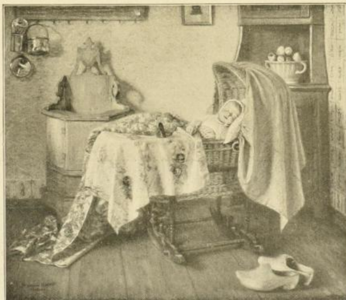
H. Knopf, Langschläfer Farbenlichtdruck 72×85 cm, Karton 87×104 cm M. 50.—