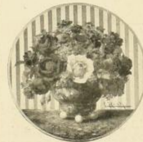
C. Koch, Rosen Bild 24×24 cm M. 2.50