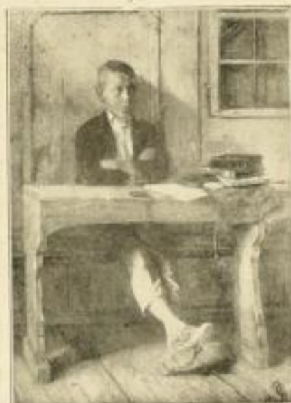
G. Iglar, Lausbub' Bild 19×13 cm M. 1.50