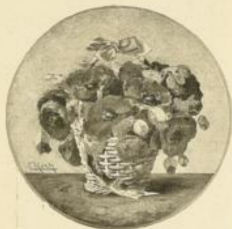
C. Koch, Mohnblumen Bild 24×24 cm M. 2.50