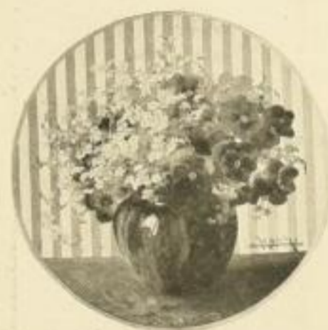
C. Koch, Vergissmeinnicht Bild 24×24 cm M. 2.50