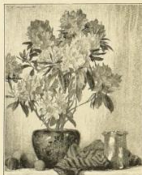
L.v. Langenmantel, Rhododendron Bild 37×30 cm, Karton 59×48 cm M. 6.—