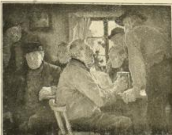
H. Best, Neue Steuervorlage Bild 23×29 cm, Karton 34×47 cm M. 4.—