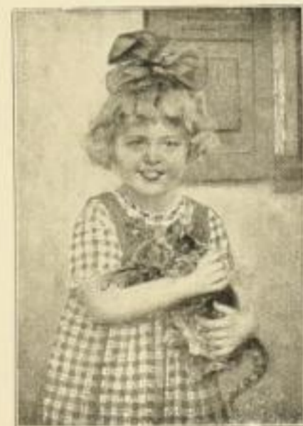
R. Voelcker, Kätzchen Bild 26×18 cm, Karton 44×34 cm M. 4.—