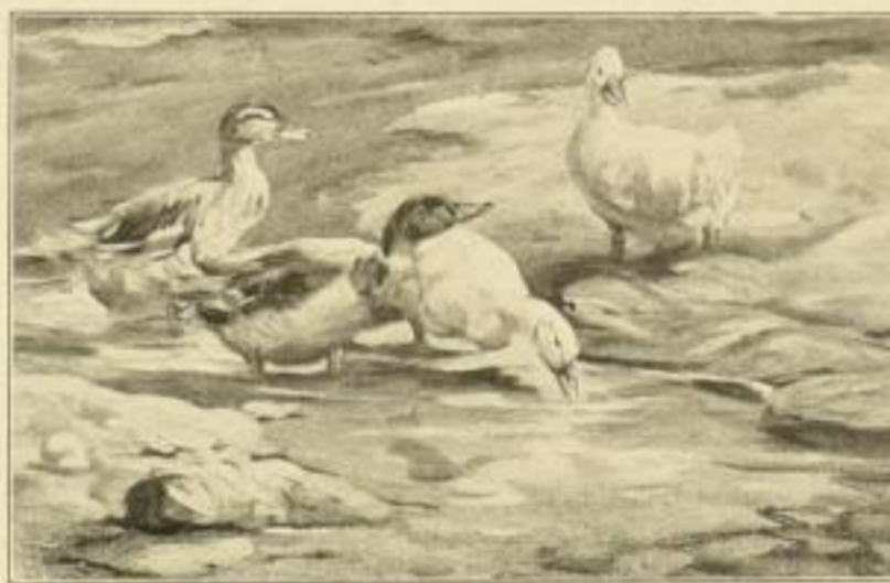
W. Tiedjen, Enten am Weiher Bild 27×40 cm, Karton 48×58 cm M. 6.—