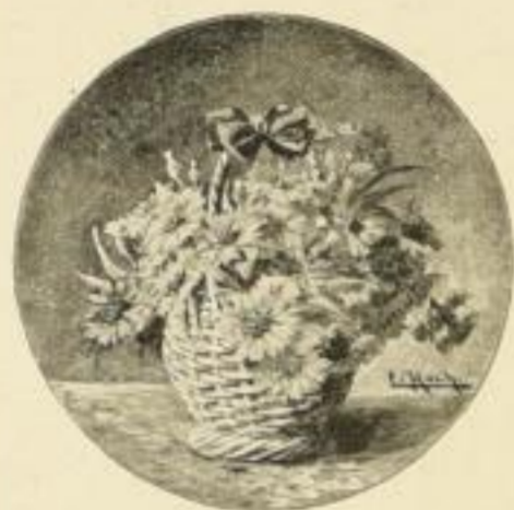
C. Koch, Kornblumen Bild 24×24 cm M. 2.50

Ein Kunstblatt in Vierfarbendruck, das man seines feinen Humors wegen bald in tausenden Familien finden wird, ist: Grimm, Wer die Wahl hat, hat die Qual.