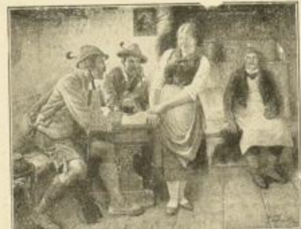
M. Wachsmuth, Gefährliche Gäste Bild 23×29 cm, Karton 39×47 cm M. 4.—

Bezugsbedingungen: Sämtliche Kunstblätter liefere ich mit 40% Rabatt und mit Freixemplar 11/10.