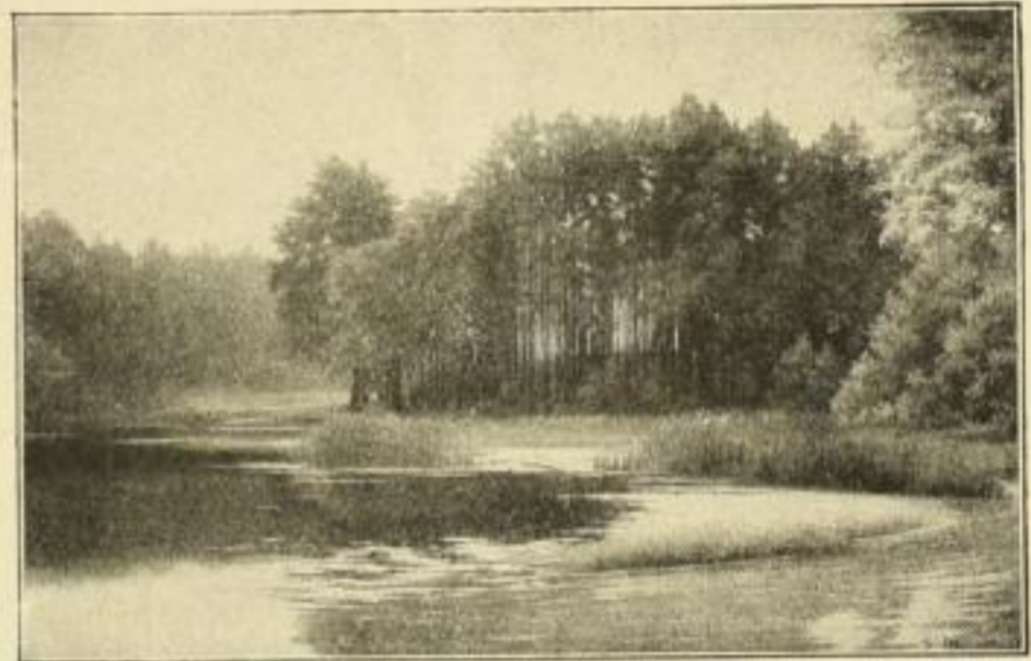
Nr. 2519 G. Marschall. Stilles Wasser Vierfarbendruck Bildgrösse 18 \times 26 cm Papiergrösse 24 \times 32 cm M. 2. —