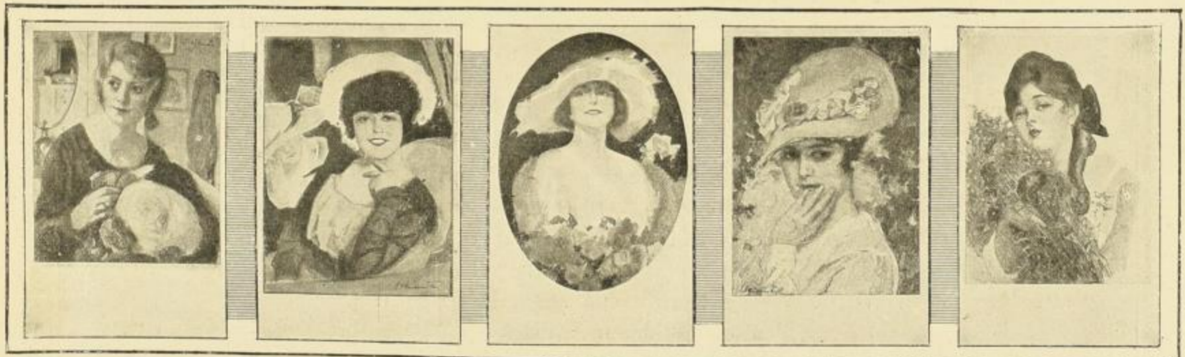
E. Heilemann: Schöne Frauen

Je 5 in feinstem farbigen Kunstdruck ausgeführte Luxuskarten in Umschlag. Jede Serie 1 M. Verkaufspreis, 70 Pf. bar, 100 Serien gemischt für 60 M. bar