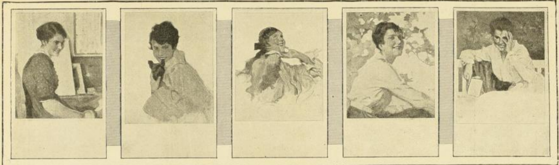
B. Wennerberg: Meine Modelle