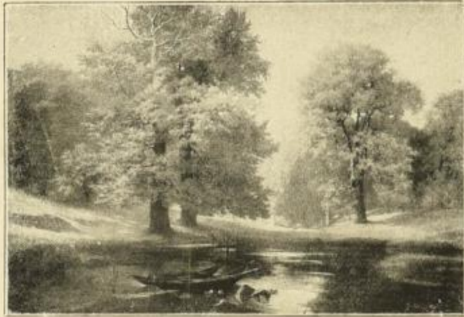
Nr. 2518 G. Marschall. Frühling im Walde Vierfarbendruck Bildgrösse 18 \times 26 cm Papiergrösse 24 \times 32 cm M. 2. —

Kunstverlag Gebrüder Schnitzer Berlin SW 68, Ritterstraße 71