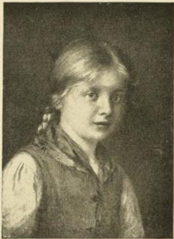
Nr. 2517 's Katerl. Vierfarbendruck Bildgr. 17\frac{1}{2} \times 24\frac{1}{2} cm Papiergr. 24 \times 31 cm M. 2. —