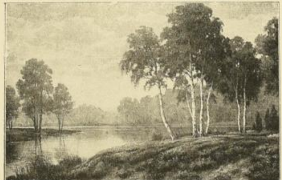
Nr. 2521 L. Sörensen. Birken am Wasser Vierfarbendruck Bildgrösse 18 \times 26 cm Papiergrösse 24 \times 32 cm M. 2. —