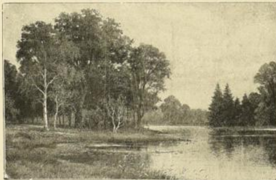
Nr. 2520 L. Sörensen. Wenn der Wald sich färbt Vierfarbendruck Bildgrösse 18 \times 26 cm Papiergrösse 24 \times 32 cm M. 2. —