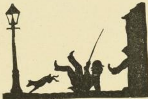
Nr. 48: Abschied