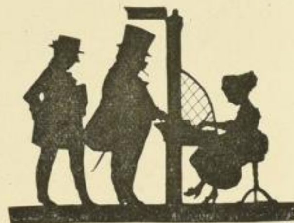
Nr. 49: Am Briefmarkenschalter