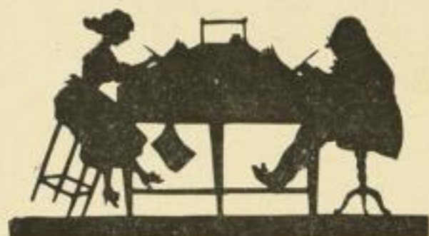
Nr. 41: Im Kontor

Ⓛ Folge III. Jedes Blatt 10 M. Verkaufspreis