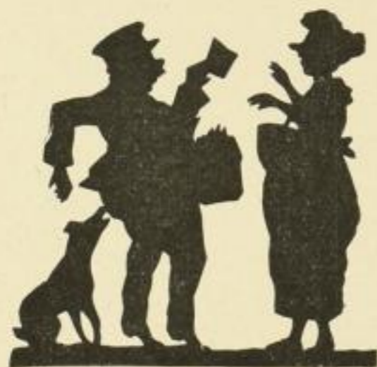
Nr. 50: Von ihm

Den beiden ersten Folgen der Otto'schen Scherenschnitte folgt die dritte, humoristische. Wenn den ersten Blättern schon der große Erfolg beschieden war, so wird es auch hier bei dieser neuen Folge in besonderer Weise der Fall sein. Der Verkaufspreis ist auf 10 M. für jedes Blatt festgesetzt, der Nettopreis auf 6 M. Die ganze Folge rabattiere ich mit 45%. Jedes Blatt ist signiert und mit Titelfstreifen versehen. Da ich bereitwillig umtausche, so ist das Risiko kein großes. Von einigen der früher erschienenen Silhouetten habe ich Briefverschlussiegel herstellen lassen, die ich zum Selbstkostenpreise von M. 2. — das Hundert abgebe. Der Versand erfolgt in der Reihenfolge des Einlaufs. Die Sendungen gehen direkt von Mainz „Eingeschrieben“ den Bestellern zu. Ich bitte nach Möglichkeit um direkte Bestellung.