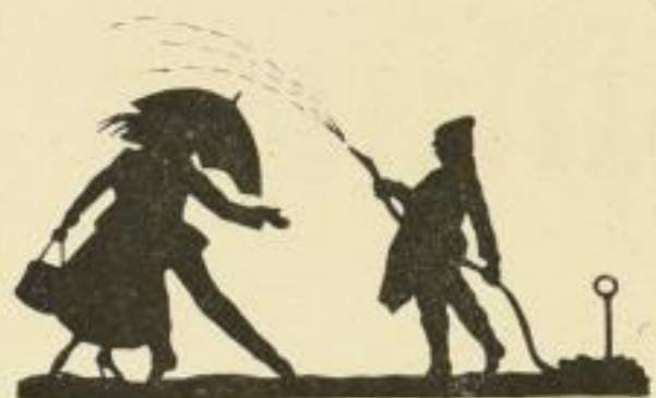
Nr. 44: Dedung