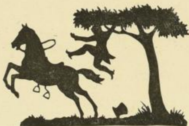
Nr. 45: Absalom