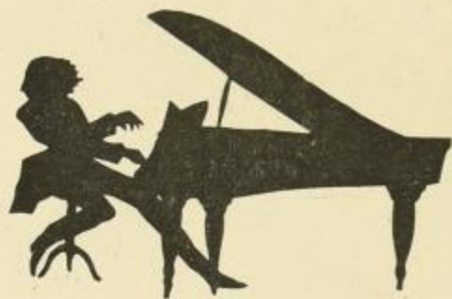
Nr. 47: Der große Künstler