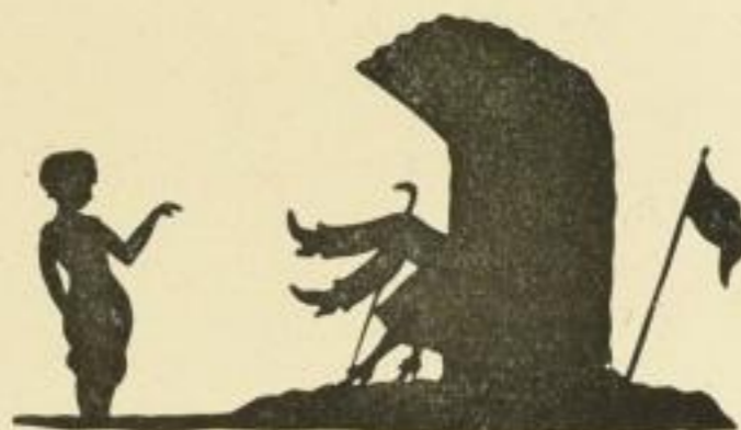
Nr. 46: Strandbad