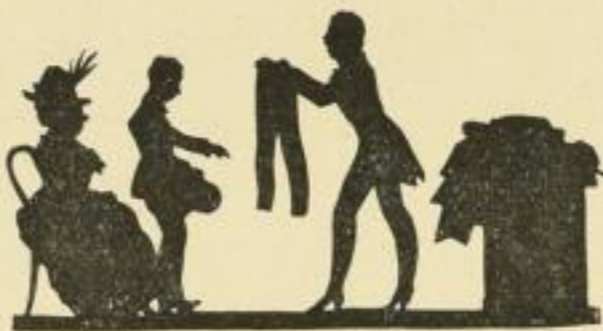
Nr. 42: Die neue Hofe