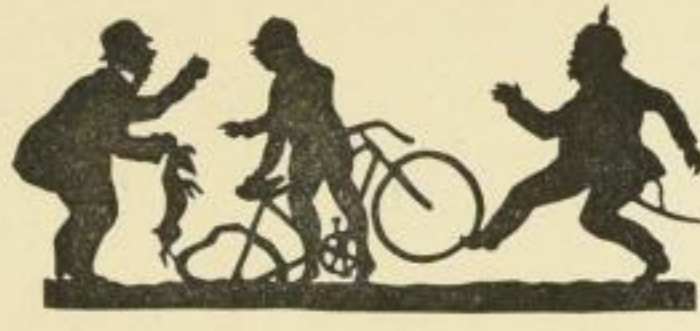
Nr. 43: Doppelter Schaden