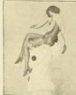
18. E. Litke: Liebeskegel.