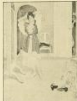
10. B. Wennerberg: „Der Herr wartet!“