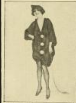
5. Raphael Kirchner: Der rote Pierrot.