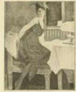
8. B. Wennerberg: Faschingsliebe.