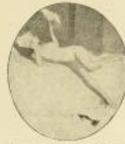
7. Krenes: Verträumte Stunden.