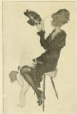
1. Raphael Kirchner: Der grösste Amor.