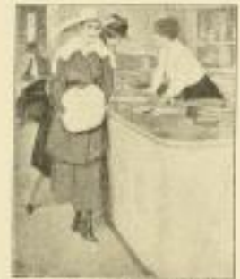
16. B. Wennerberg: Der süße Backstich.