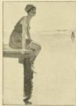
3. B. Wennerberg: Strandszene.