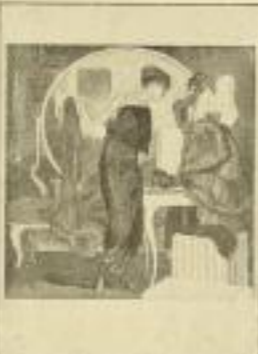
14. F. de Bayros: Schwere Wahl.