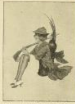
4. Raphael Kirchner: Goldfische.