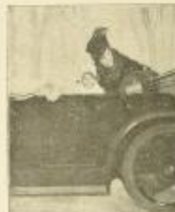
9. B. Wennerberg: Baby's Autofahrt.