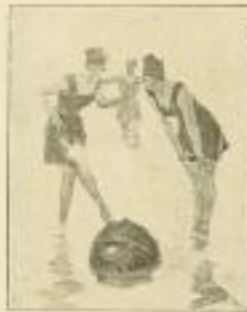
2. B. Wennerberg: Im Spiel der Wellen.