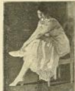
11. B. Wennerberg: In Erinnerung.