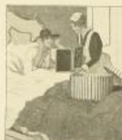
17. B. Wennerberg: Der aseie flut.