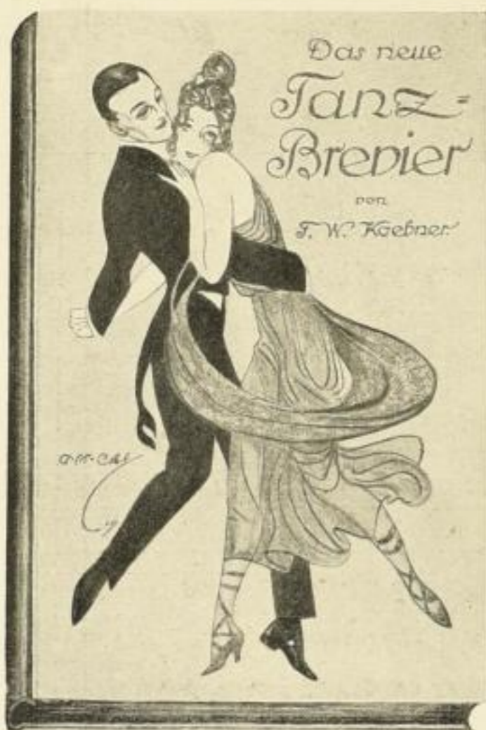
Verkleinerte Wiedergabe des reizvollen bunten Titelbildes

In neuer, den veränderten Zeitverhältnissen angepasster Bearbeitung erscheint demnächst in entzückender Friedenausstattung das 41. bis 50. Tausend des mit Spannung erwarteten Bandes: