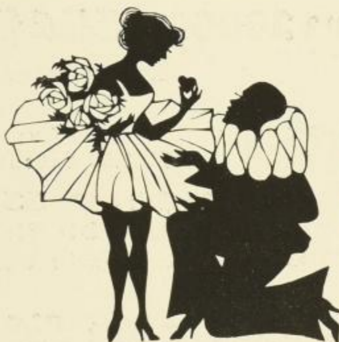
Gib mir dein Herz

Verantwortlicher Redakteur: Emil Thomas. — Verlag: Der Börsenverein der Deutschen Buchhändler zu Leipzig, Deutsches Buchhändlerhaus. — Druck: Ramm & Seemann. — Adresse der Redaktion und Expedition: Leipzig, Gerichtsweg 26 (Buchhändlerhaus).