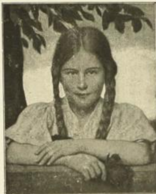
L. v. Zumbusch, Das Luiserl

Kartongrösse ca. 50/65 Bildgrösse . . ca. 35/42