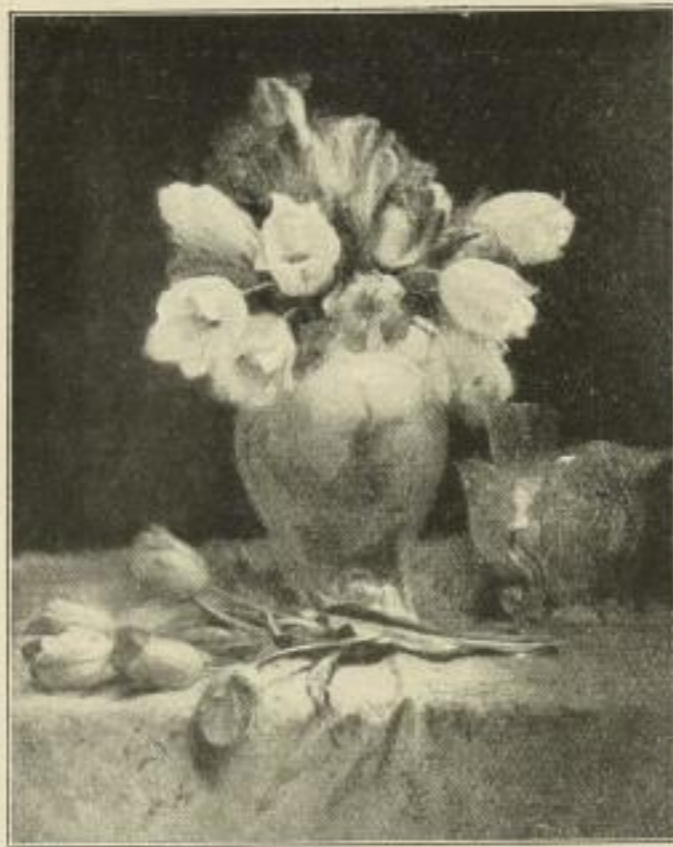
Nr. 238. Hoffmann: Tulpen. Bild 55 x 69 cm, weisser Rand 72 x 95 cm M. 50.—