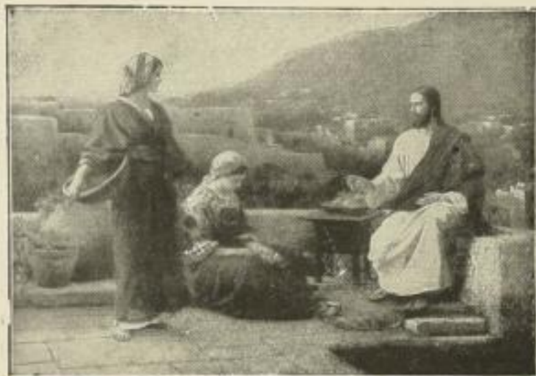
Nr. 165. Seeger: Jesus bei Maria und Martha. Bild 50×71½ cm . . . . . M. 50.—