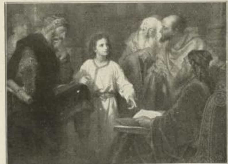
Nr. 249. Hofmann: Der zwölfjährige Jesus im Tempel. Bild 50 \times 67\frac{1}{2} cm . . . M. 50.—