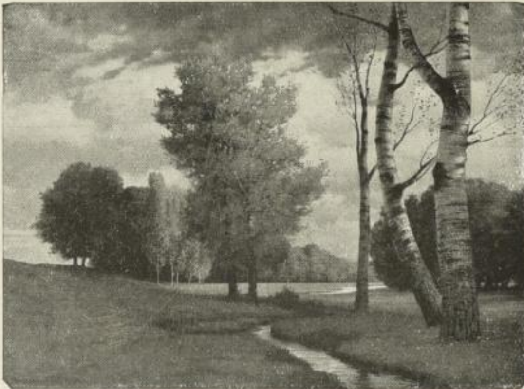
Nr. 194. Rüdigsühli: Herbst im Wiesengrund. Bild 50\frac{1}{2} \times 69\frac{1}{2} cm, weisser Rand 73 \times 97 cm . . . M. 50.—