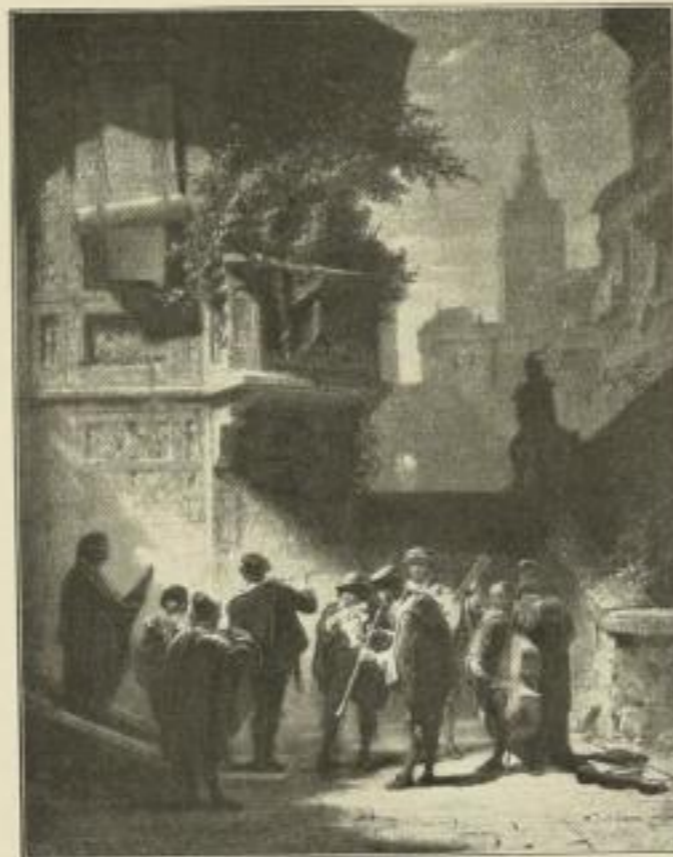
Nr. 219. Spitzweg: Serenade. Bild 49 1/2 x 64 cm . . M. 50.—