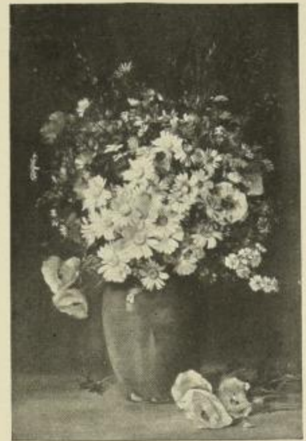
Nr. 250. Würthle: Feldblumen. Bild 46 x 69 cm, weisser Rand 61 x 90 cm M. 50.—