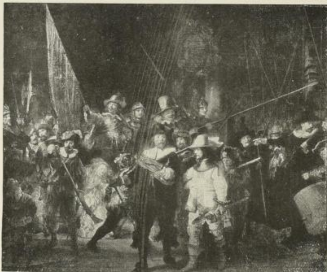
Nr. 198. Rembrandt: Nachtwache. Bild 73x88 1/2 cm . M. 100.—