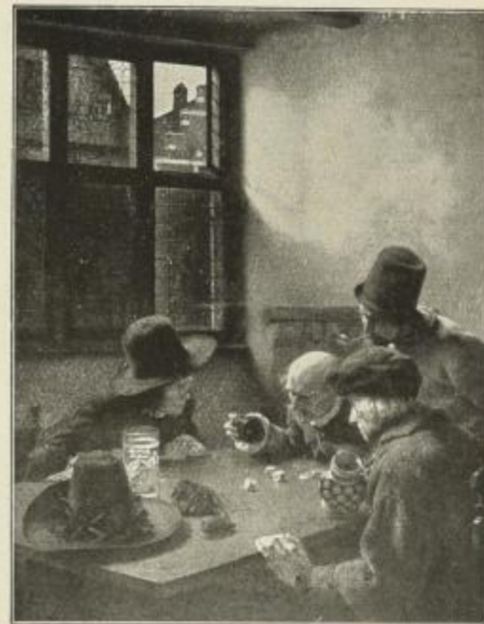
Nr. 196. Claus Meyer: Die Würfler. Bild 51x66 cm . . . . . M. 50.—