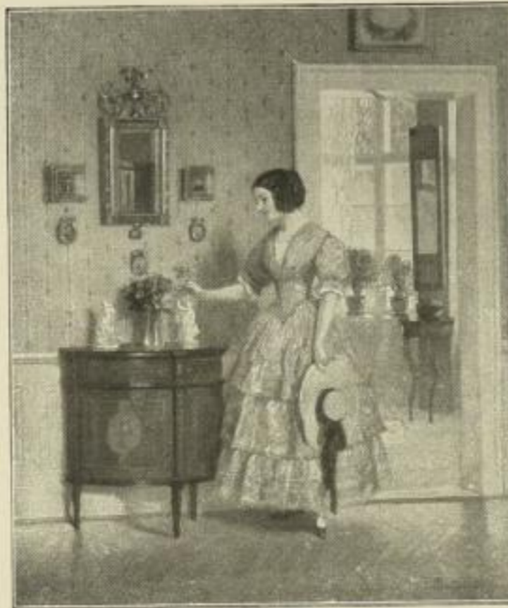
Nr. 273. Bayerlein: Tage der Rosen. Bild 43 x 51 cm, weisser Rand 61 x 73 cm M. 25.—