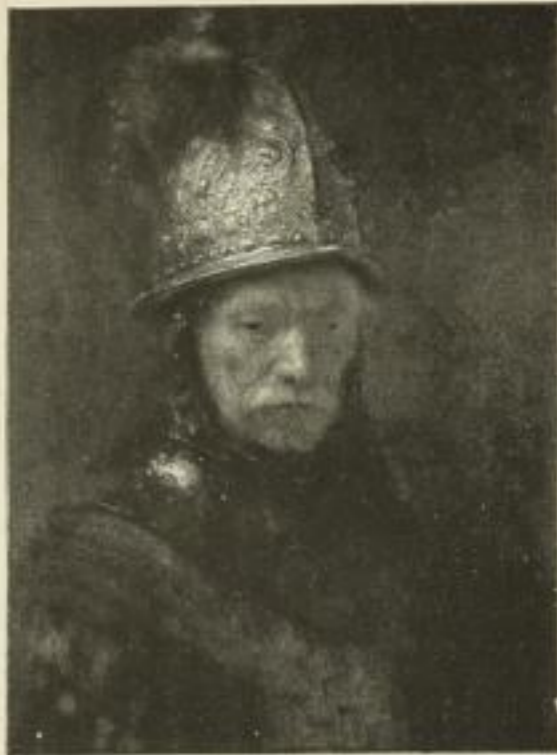
Nr. 292. Rembrandt: Mann mit Goldhelm. Bild 50×67 cm . . . . . M. 50.—