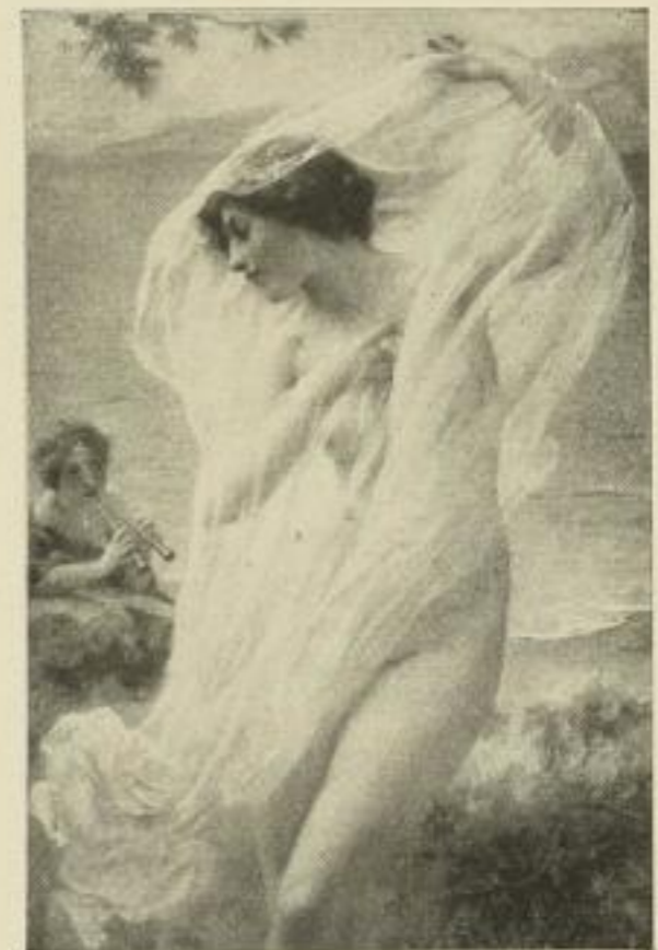
Nr. 264. Lenoir: Pompejanische Tänzerin. Bild 45 x 73 cm, weisser Rand 65 x 95 cm M. 50.—