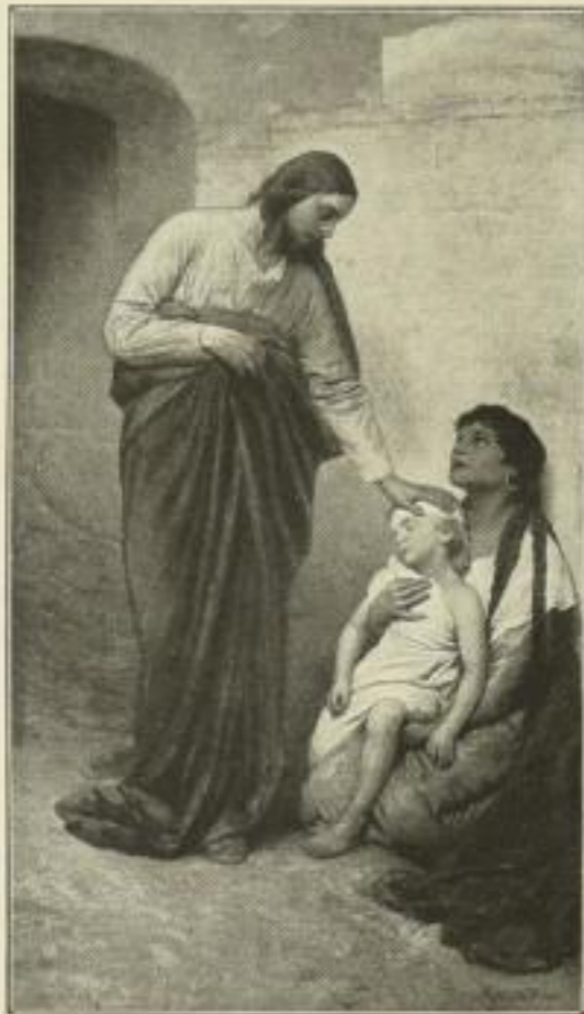
Nr. 262. G. Max: Jesus heilt ein krankes Kind. Bild 42×73 cm, weisser Rand 65×96 cm M. 50.—

Die hierin genannten Preise ver- stehen sich einschliessl. Teuerungszu- schlag und einschliessl. Luxussteuer.