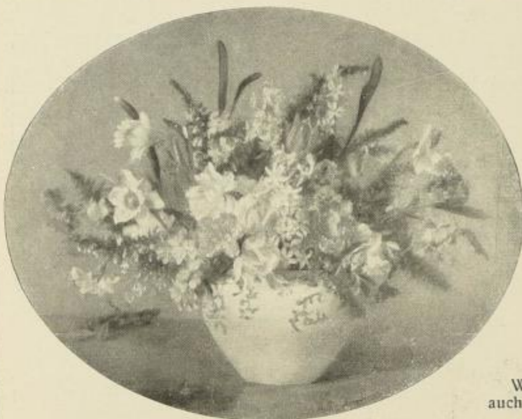
Nr. 286. Keller-Hermann: Frühlingsblumen. Bild 60 x 74 cm M. 50 —