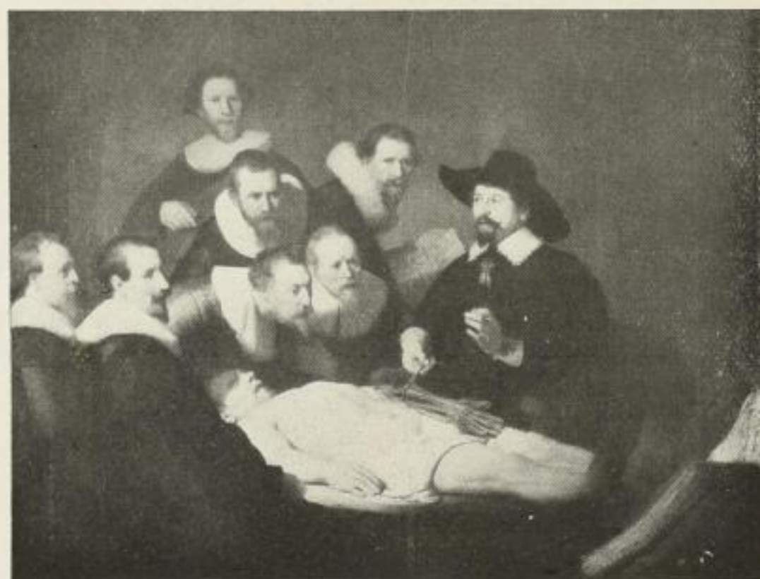
Nr. 268. Rembrandt: Die Anatomie. Bild 55x73 cm . . . M. 50.—