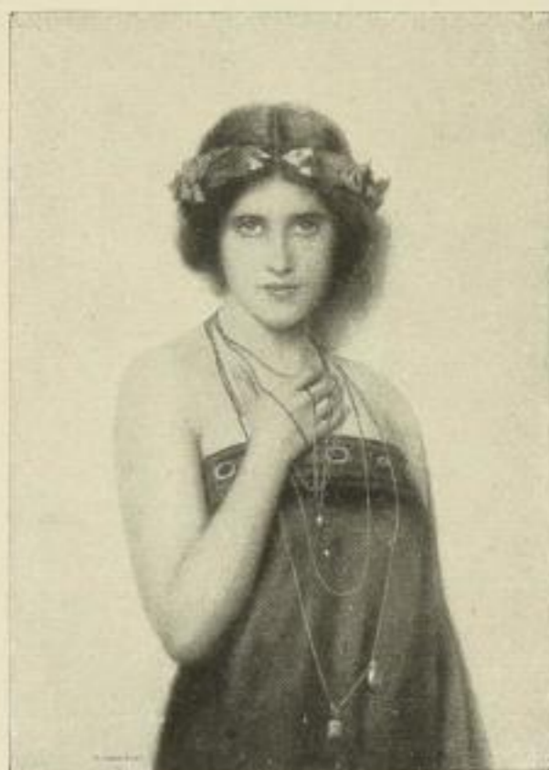
Nr. 180. Nonnenbruch: Jugend. Bild 44 x 63 cm, weisser Rand 72 x 97 cm M. 50.—