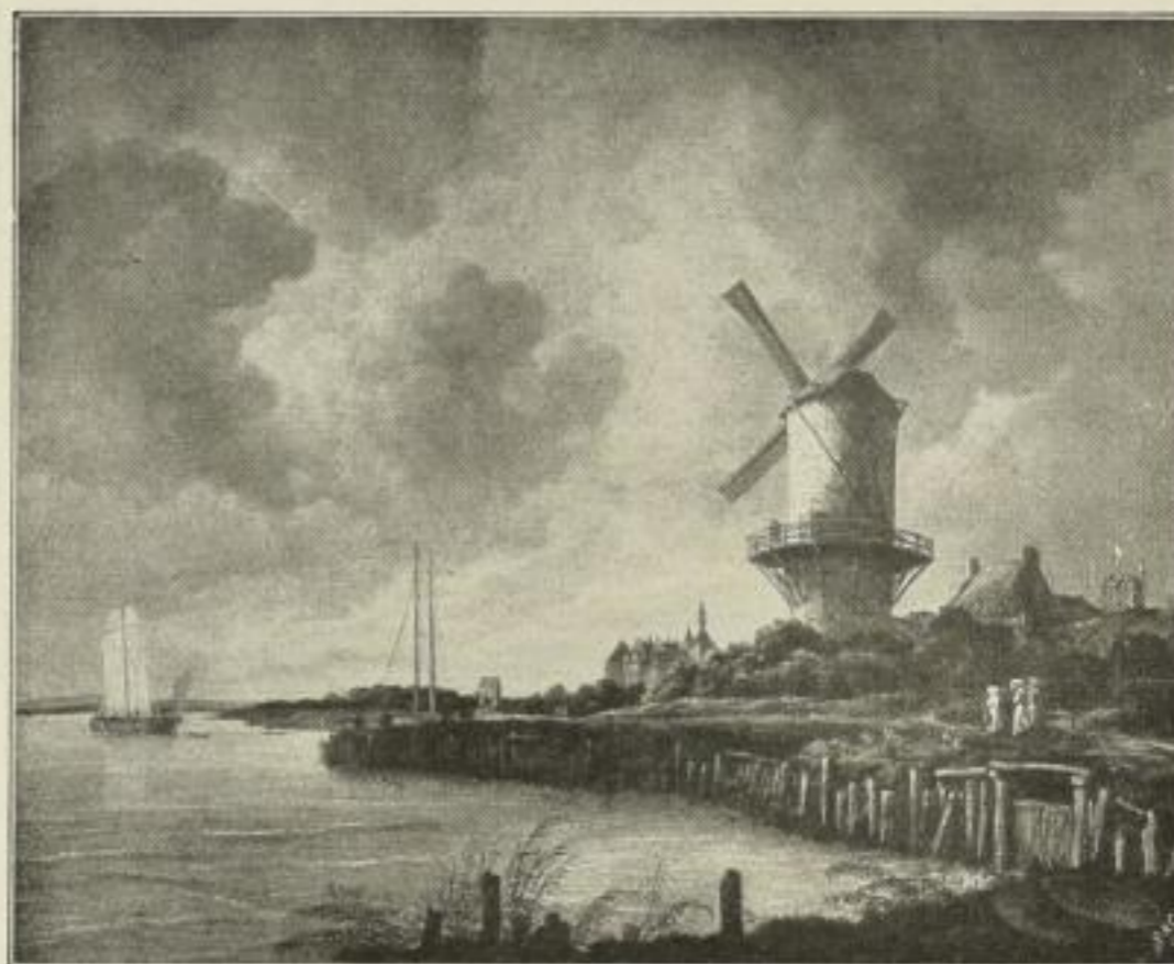
Nr. 135. Ruisdael: Windmühle. Bild 72x90 cm . . . M. 100.—