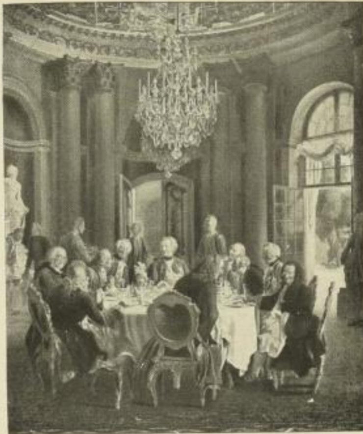
Nr. 185. Menzel: Tafelrunde Friedrichs d. Gr. Bild 52×62 cm, weisser Rand 74×95 cm M. 50.—