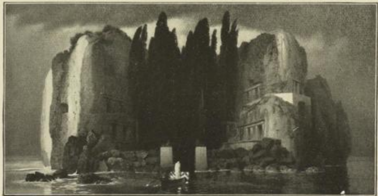
Nr. 146. Böcklin: Die Insel der Toten. Bild 35½×68 cm, weisser Rand 57×86 cm M. 50.—

Hauptkatalog portofrei gegen Voreinsendung von M. 3.50