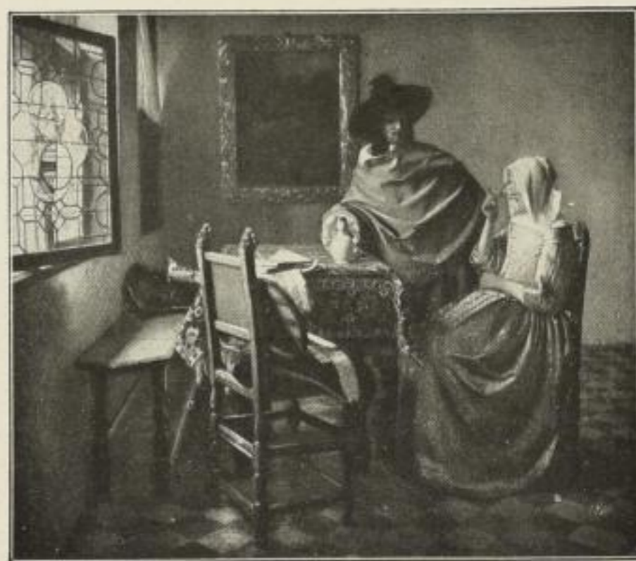
Nr. 224. Vermeer: Herr u. Dame beim Wein. 53x63 cm M. 50.—