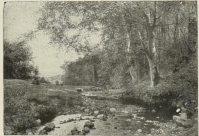
Nr. 138. Flickel: Harzlandschaft. Bild 63 \times 90 cm . . . M. 75.—