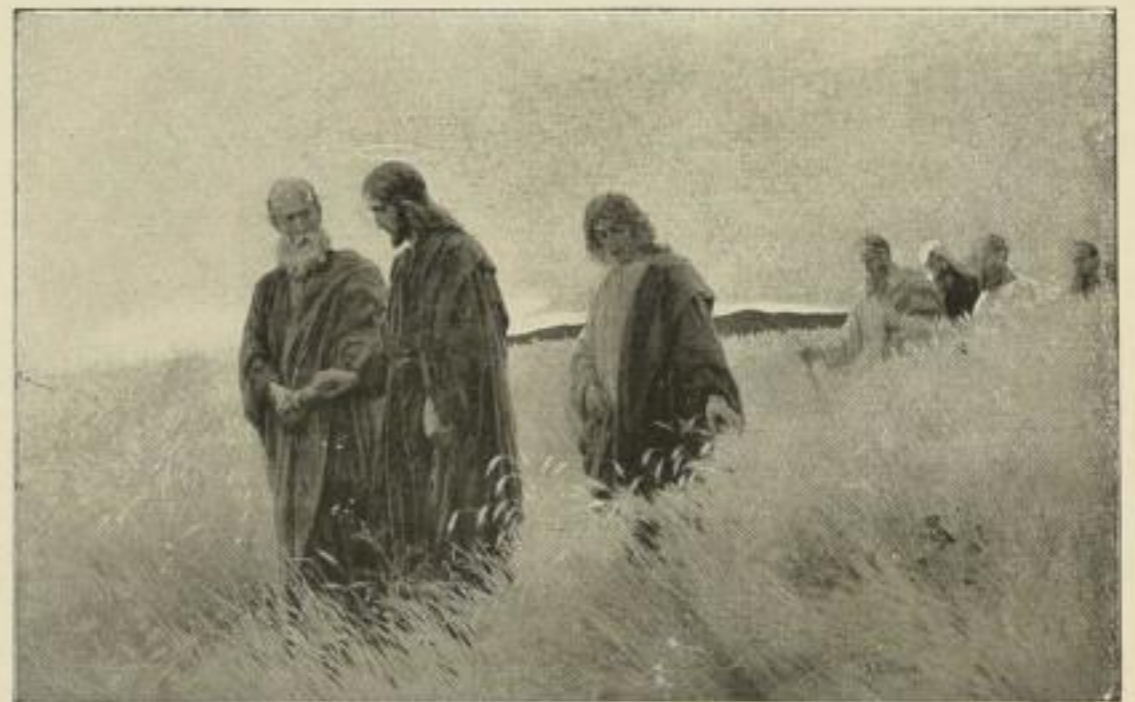
Wehle: Und sie folgten ihm nach. Nr. 137. Bild 47×74 cm M. 50.— Nr. 137a. Bild 34×54½ cm, weisser Rand 55×72 cm . . . M. 25.—