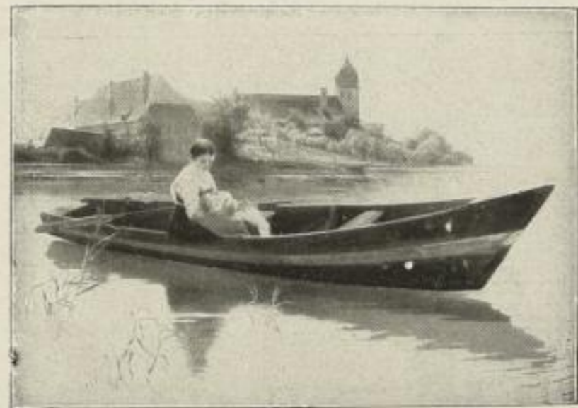
Nr. 192. Raupp: Friede. Bild 63 \times 92 cm M. 75.—