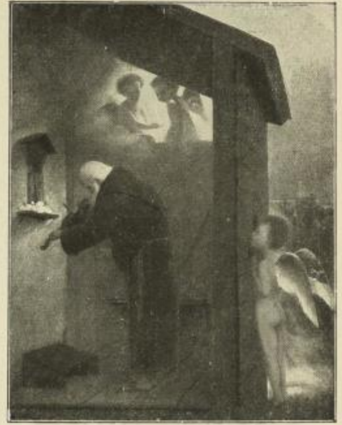
Nr. 81. Böcklin: Der Eremit. Bild 48×63 cm . . . M. 50.—