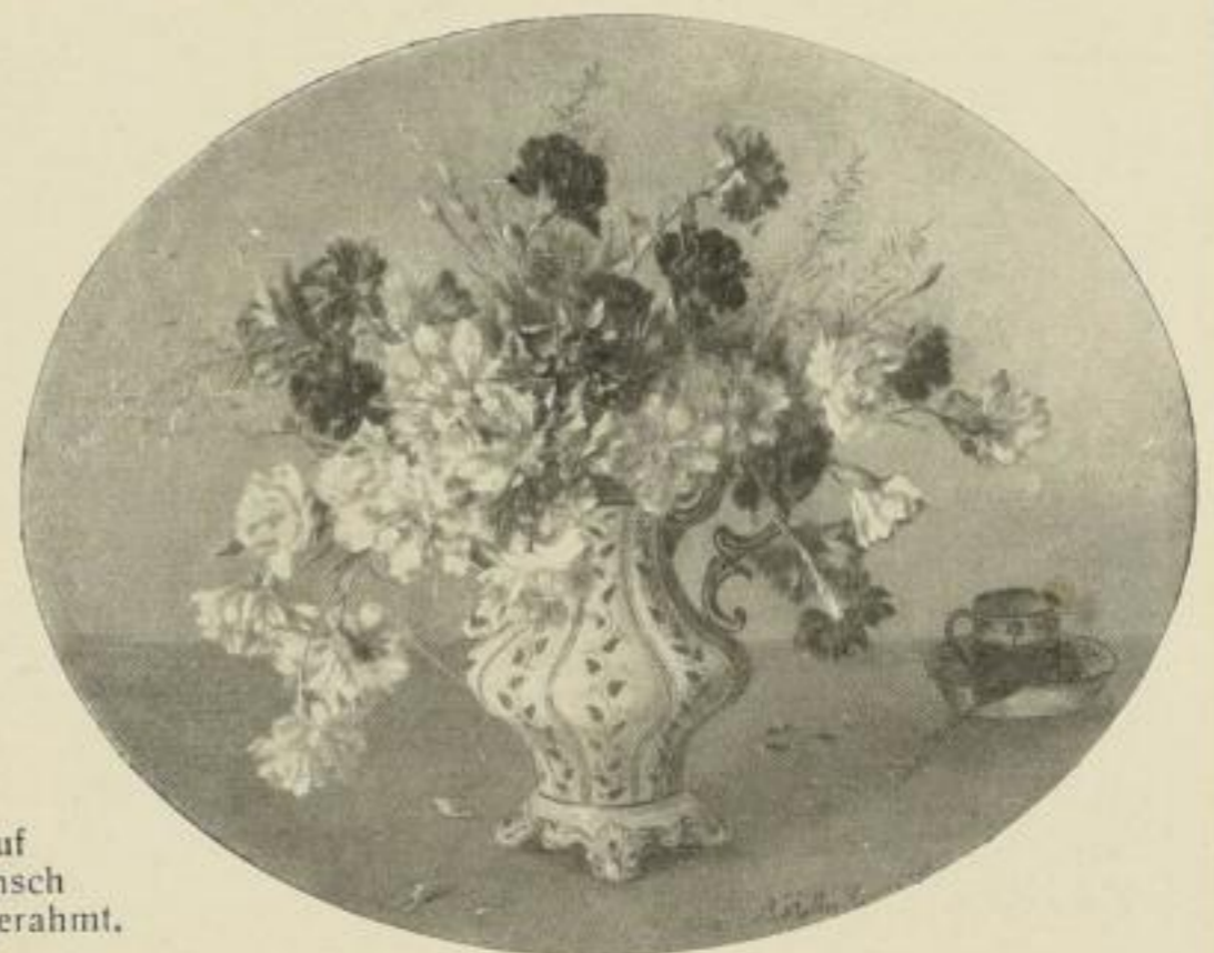
Nr. 285 Keller-Hermann: Nelken. Bild 60 x 74 cm M. 50.—