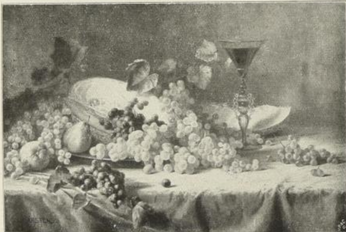
Nr. 133. Carstens: Stilleben. Bild 60 \times 87\frac{1}{2} cm . . . M. 75.—