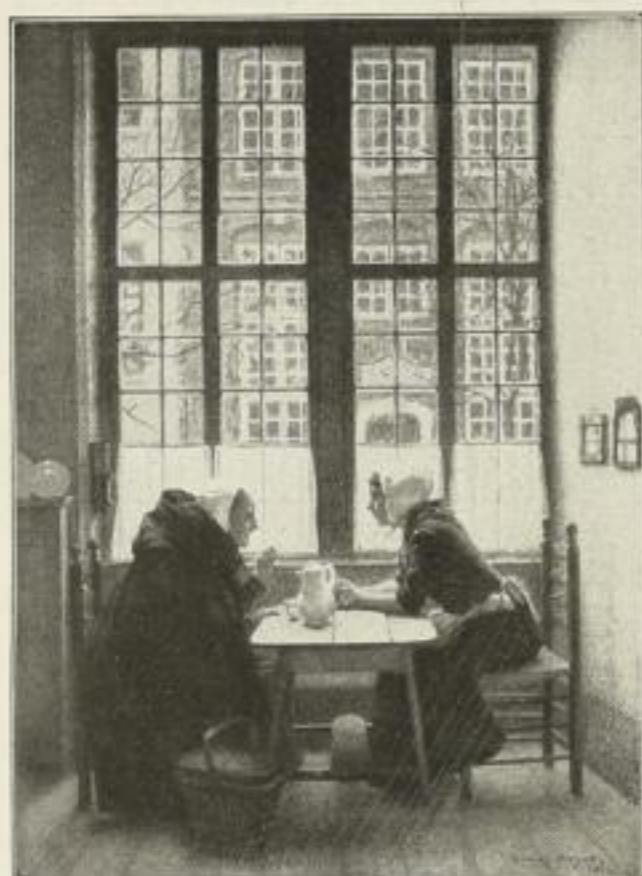
Nr. 229. Claus Meyer: Nachbarinnen, Bild 51x70 cm . . . . . M. 50.—