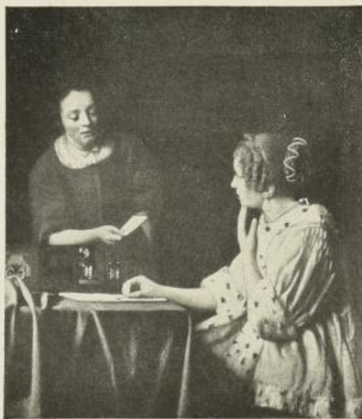
Nr. 275. Vermeer: Meisterin und Dienerin. Bild 52 1/2 x 60 1/2 cm . . . . . M. 50.—