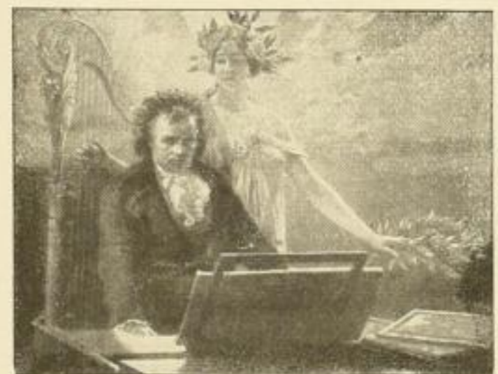
R. Eichstaedt: Beethoven und die Muse

Kupferätzung, Bildgrösse 49:64 cm Einfarbig M. 90.— ord. Handkoloriert M. 175.— ord. Folio einfarbig M. 15.— ord. Handkoloriert M. 30.— ord. Kabinett einfarbig M. 5.50 ord. Handkoloriert M. 11.— ord.