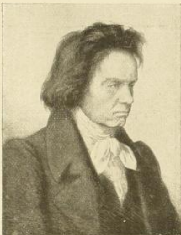
Hans Weyl: Beethoven (Profil) Original-Radierung, Bildgrösse 41:32 cm Drucke mit faks. Unterschrift auf Bütten M. 55.— ord.

Die Preise der hier angezeigten Radierungen und des Scherenschnittes verstehen sich ausschliesslich Luxussteuer.