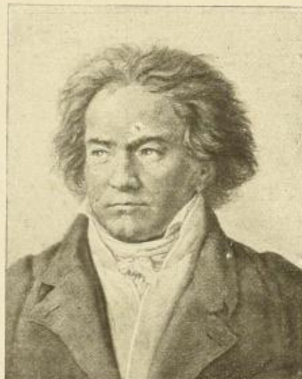
A. von Kloeber: Beethoven Kupferätzung, Bildgrösse 41:33 cm Einfarbig M. 45.— ord. Koloriert M. 80.— ord.