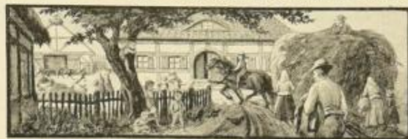
Schäferhaus von Wenzel. Fackelzug von Wenzel. Verlag (Mag. Oskar Preuss) Straßburg 1914.

Nicht in mühelosem Genusse betrachtet er die Bilder, die ihm die Natur entgegenhält. An jedem Blick knüpft sich ein Wunsch, an jedem Eindruck ein Vorsatz. Jedes Ding hat für ihn einen Zweck, denn alles, das fruchtbar wird, das Tier und der Mensch soll nützlich hervorbringen nach seinem Willen. Seine Tätigkeit ist ewig, wie das Leben der Erde. Ihm wird die höchste Freude des Schaffens zuteil, denn was sein Befehl von der Natur fordert: Pflanze und Tier, das wächst unter seiner Hand zu eigenem frohen Leben empor.