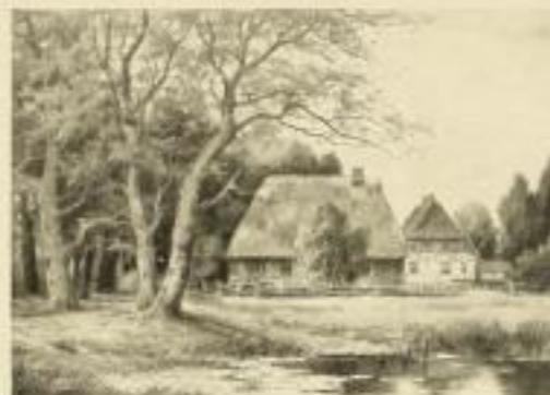
Nr. 2543. L. Stensen, Am Waldsee. Bildgröße 30 x 42, Papiergröße 38 x 48.