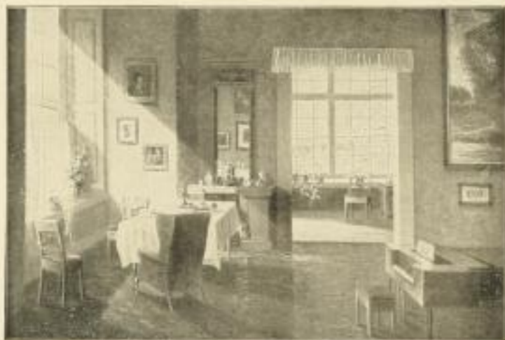
Nr. 2547. Paul Gehrmann, Winterabend. Bildgröße 55 x 81, Papiergröße 72 x 98.