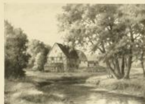
Nr. 2544. L. Stensen, Mühlbach. Bildgröße 30 x 42, Papiergröße 38 x 48.

Ladenpreis M. 12.— 40% und 13/12 gemischt