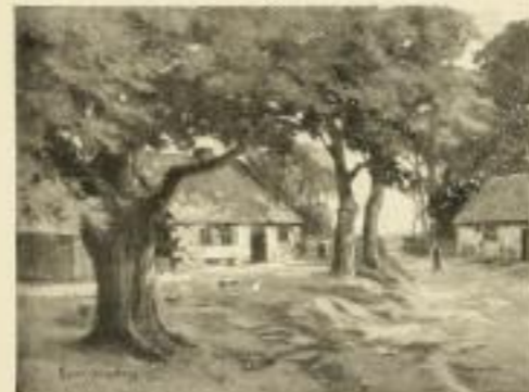
Nr. 2545. K. v. Borsowski, Am Ende des Dorfes. Bildgröße 30 x 40, Papiergröße 38 x 48.

Ladenpreis M. 12.— 40% und 13/12 gemischt