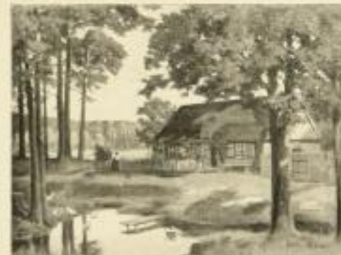
Nr. 2546. K. v. Borsowski, Am Teich. Bildgröße 30 x 40, Papiergröße 38 x 48.

Verlagskatalog, Katalog Original-Graphik erster Künstler, Abbildungen gerahmter Bilder auf Verlangen gern zu Diensten. Wir bitten um tätigste Verwendung.