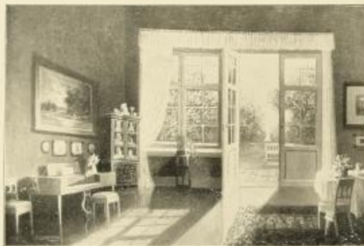
Nr. 2548. Paul Schmidt, Fühlingsmorgen. Bildgröße 55 x 81, Papiergröße 72 x 98.

Weitere Bilder erster Künstler in Vorbereitung