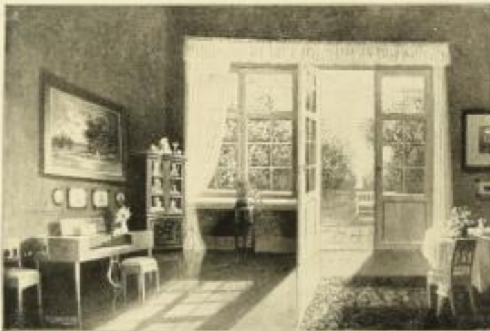
Nr. 2548. Paul Gehrmann, Frühlingstagen. Bildgröße 55x81, Papiergröße 72x98.

ⓧ Ladenpreis M. 90.—, 40% u. 7/6 von einem Bilde, 13/12 gemischt Gerahmt in einem 4½ cm breiten Vergolderrahmen mattgold mit polierten Flächen M. 200.— netto Weitere Bilder erster Künstler in Vorbereitung