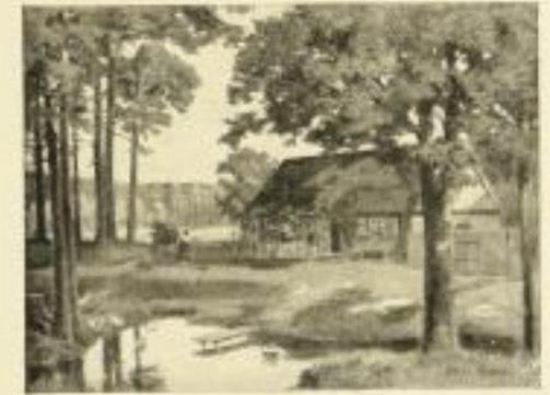
Nr. 2546. K. v. Rozynski, Am Teich. Bildgröße 30x40, Papiergröße 38x48.

Verlagskatalog, Katalog Original-Graphik erster Künstler, Abbildungen gerahmter Bilder auf Verlangen gern zu Diensten. Wir bitten um tätige Verwendung. ⓧ