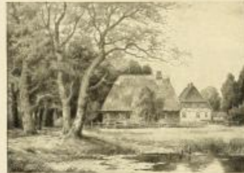
Nr. 2543. L. Strömer, Am Waldesrand. Bildgröße 30x42, Papiergröße 38x48.