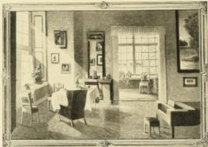
Nr. 2547. Paul Gehrmann, Winterstube. Bildgröße 55x81, Papiergröße 72x98.