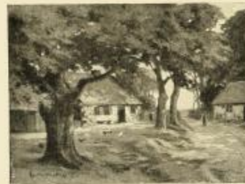
Nr. 2545. K. v. Rozynski, Am Ende des Dorfes. Bildgröße 30x40, Papiergröße 38x48.

Ladenpreis M. 12.— 40% und 13/12 gemischt