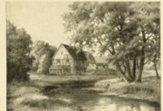
Nr. 2544. L. Strömer, Mithlach. Bildgröße 30x42, Papiergröße 38x48.

Ladenpreis M. 12.— 40% und 13/12 gemischt