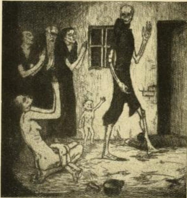
Der höhrende Tod