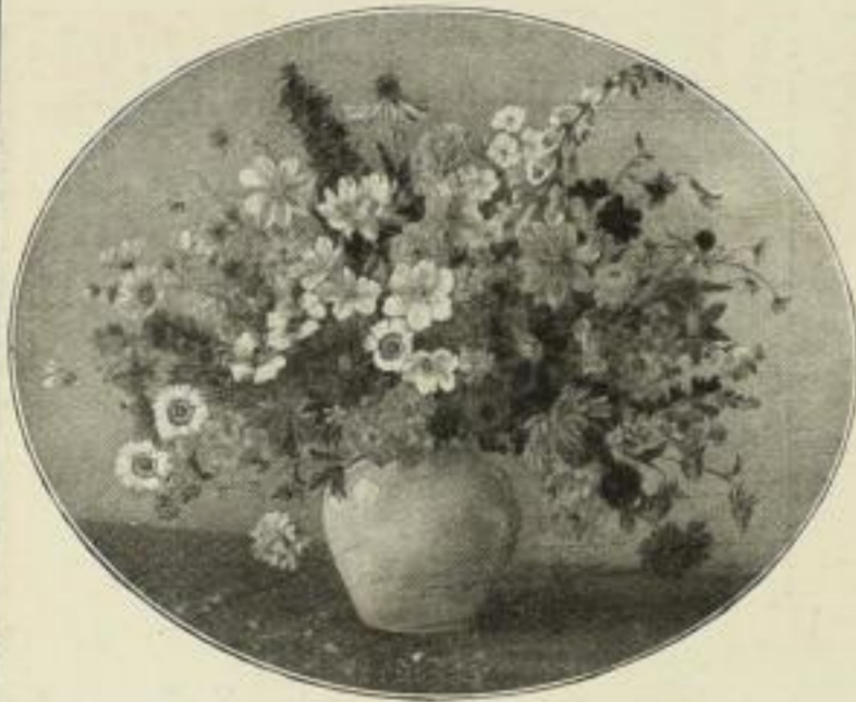
Nr. 287. Keller-Hermann: Herbstblumen. Bild 60x74 cm . . . M. 60.— Im Goldovalrahmen . . . M. 300.—