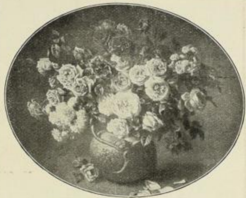
Nr. 288. Hans Buchner: Rosen. Bild 60x74 cm . . . M. 60.— Im Goldovalrahmen . . . M. 300.—