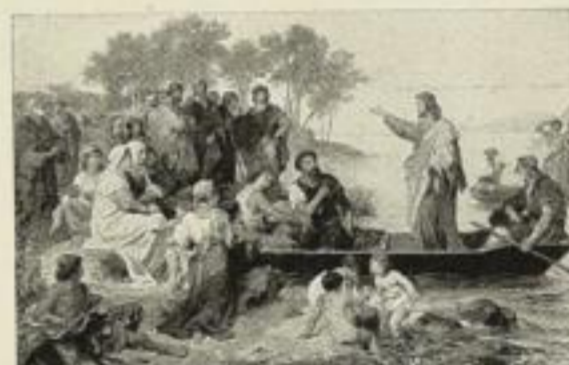
Heinr. Hofmann: Seepredigt. Nr. 200 c. 62x98 cm . . . M. 90,— Nr. 200. 46 1/2 x 71 cm . . . M. 60,— Nr. 200 a. 35 x 55 cm, Rand 56 x 74 cm M. 30,—