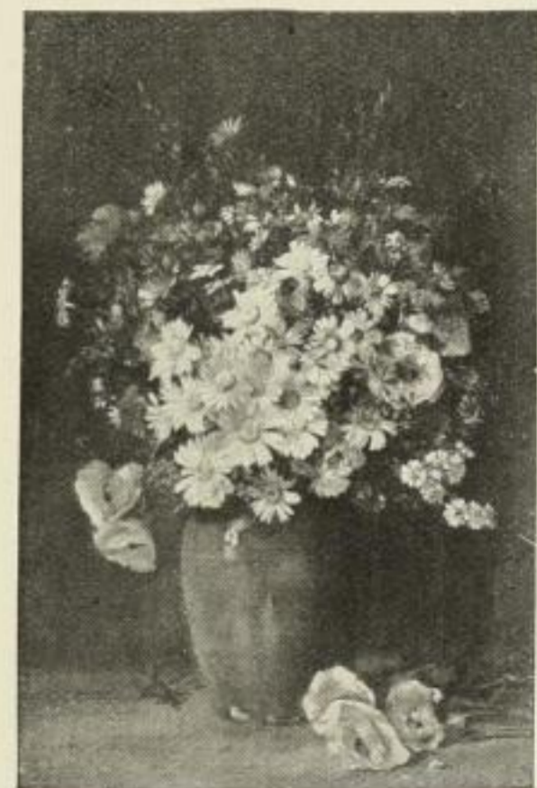
Nr. 250. Würthle: Feldblumen. Bild 46x69 cm, Rand 61x90 cm M. 60.—

Verantwortl. Redakteur: Richard Alberti. — Verlag: Der Börsenverein der Deutschen Buchhändler zu Leipzig, Deutsches Buchhändlerhaus. Druck: Ramm & Seemann. Sämtlich in Leipzig — Adresse der Redaktion und Expedition: Leipzig, Gerichtsweg 26 (Buchhändlerhaus).