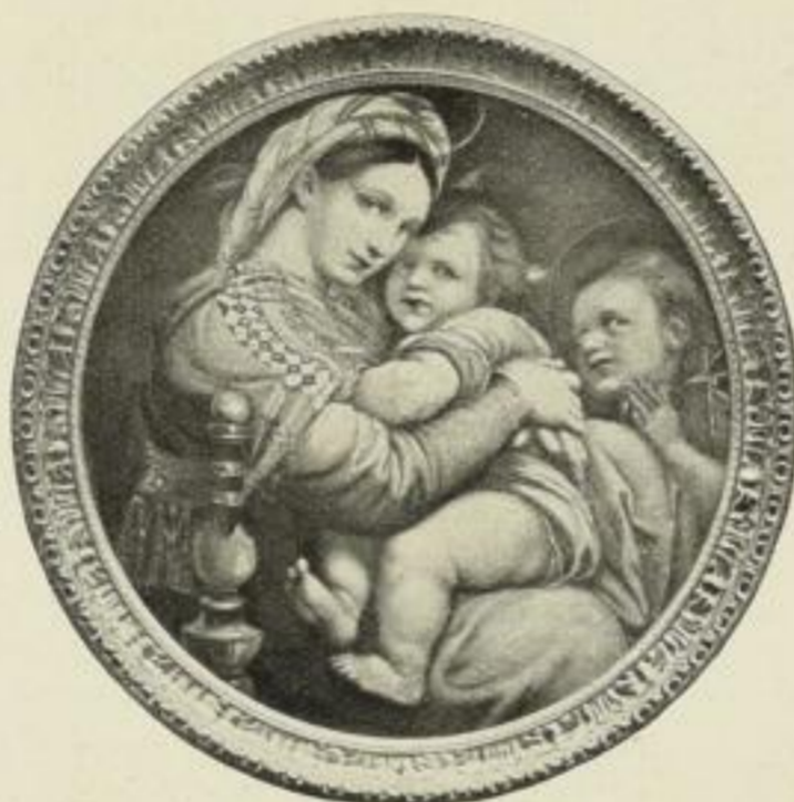
Nr. 2. Rafael: Madonna della Sedia. Bildgröße 70 cm Durchmesser M. 90.— In obigem Goldrahmen . . M. 480.—