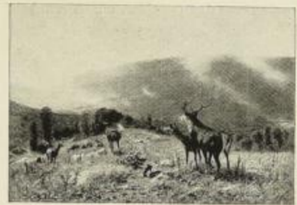
Nr. 190. Kröner: Herbstlandschaft mit Hochwild. (Nationalgalerie, Berlin) Bild 51 1/2 x 74 1/2 cm . . . M. 60.—