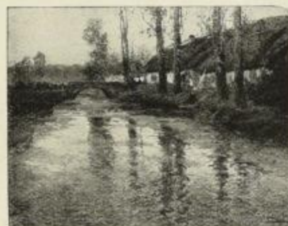
Nr. 167. Thaulow: Novembertag. Bild 51×66 cm, Rand 73×97 cm M. 60.—