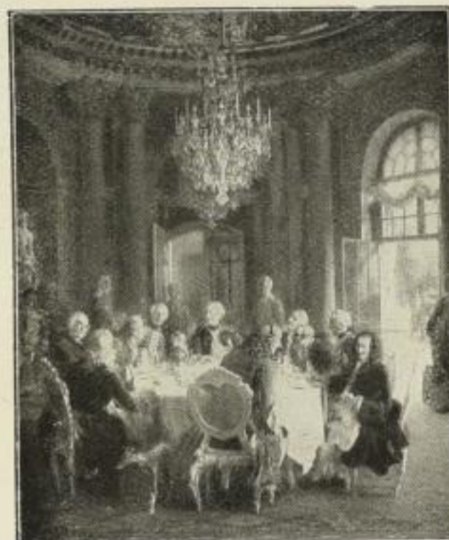
Nr. 185. Menzel: Tafelrunde Friedrichs d. Gr. Bild 52x62 cm, Rand 73x97 cm M. 60,—