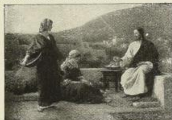
Nr. 165. Seeger: Jesus bei Maria u. Martha. 50×71 cm M. 60.—