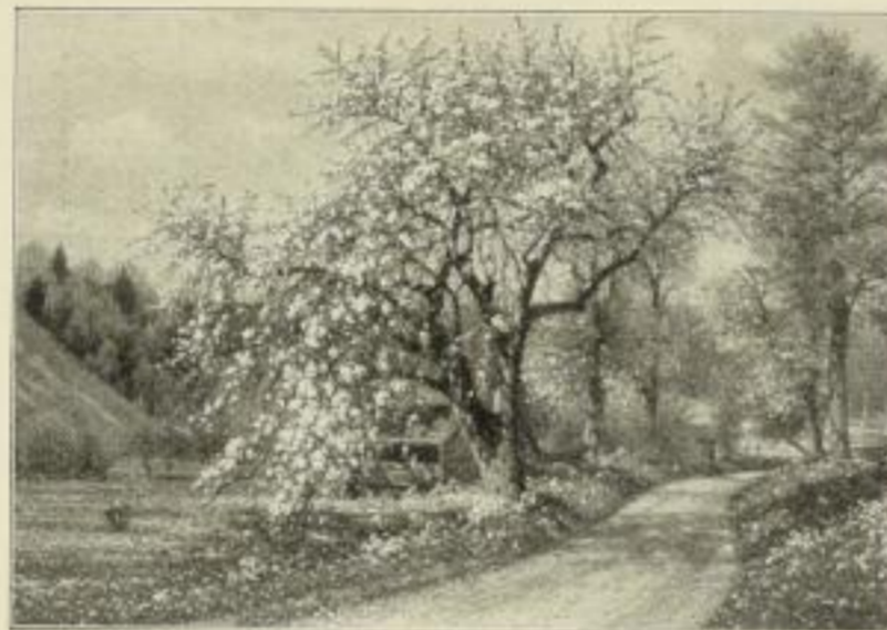
Nr. 289. Müller-Landeck: Frühling. 63x91 cm M. 90.—