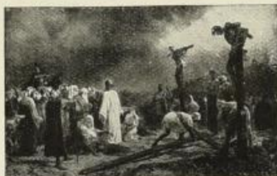
Nr. 176. Clementz: Golgatha. Bild 61 1/2 x 96 1/2 cm M. 90,—