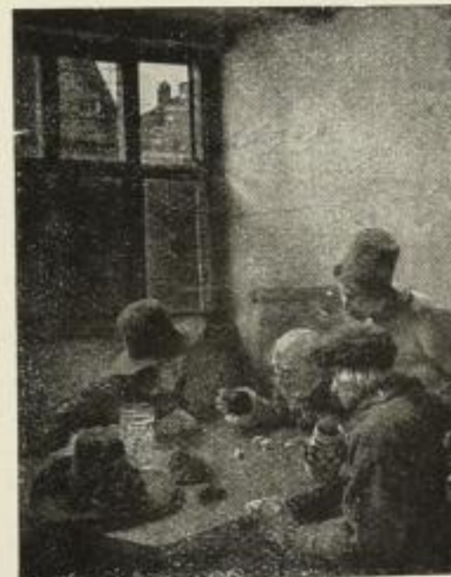
Nr. 196. Cl. Meyer: Würfler. 51x66 cm M. 60,—