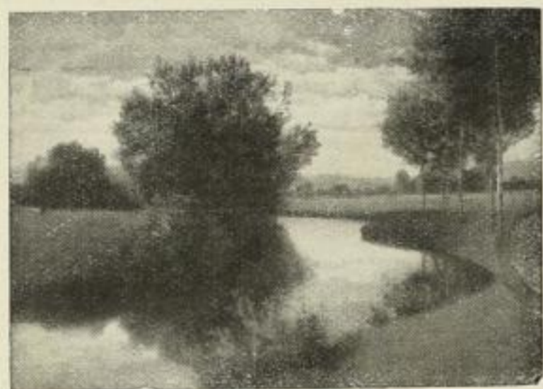
Nr. 182. Rüdisühl: Wiesenbach. Bild 34×48 cm, Rand 56×72 cm M. 30.—