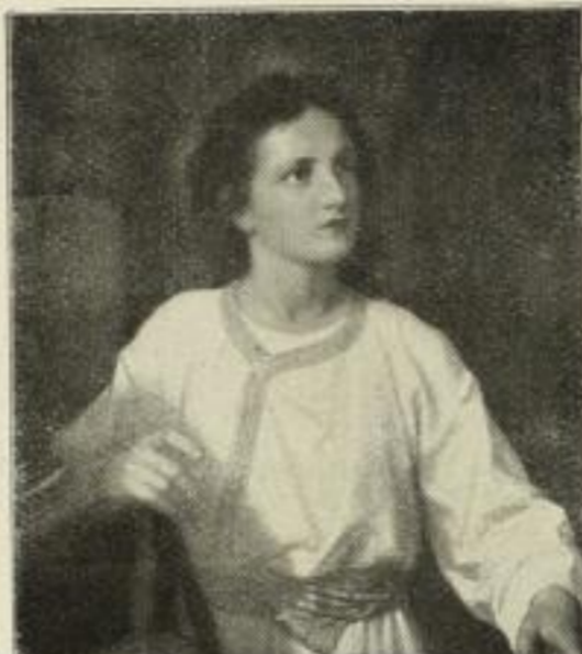
Nr. 291. Hofmann: Jesusknabe. 58×68 cm M. 60.—