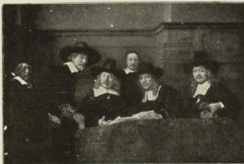
Nr. 211. Rembrandt: Staalmeesters (Amsterdam) Bild 60x89 cm . . . M. 90,— Nationalgalerie, Berlin