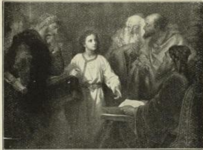
Nr. 249. Hofmann: 12jähr. Jesus im Tempel. 50×67 cm . . . . . M. 60.—

Farbige Kunstblätter nach berühmten Gemälden alter und neuer Meister.