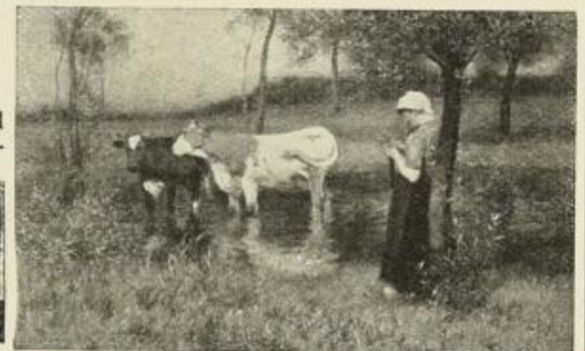
Nr. 184. Jul. Bergmann: Abend am Tümpel. Bild 42×68 cm, Rand 72×97 cm M. 60.—