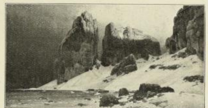
Nr. 283. Bracht: Gestade der Vergessenheit. Bild 35 1/2×68 cm, weisser Rand 57×86 cm M. 60.—