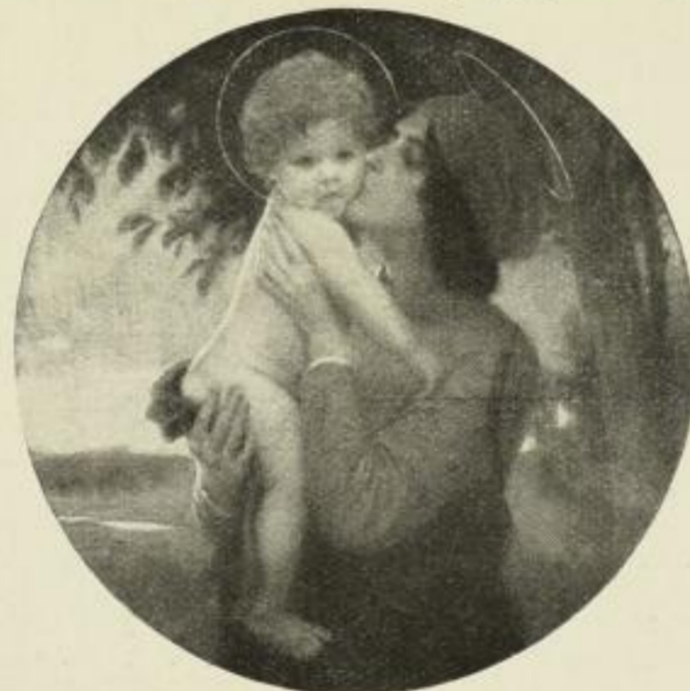
Nr. 258. Fröschl: Madonna. Bild 64 1/2 cm Durchmesser, Rand 72x78 cm M. 60.— Im runden Goldrahmen . . . M. 375.—