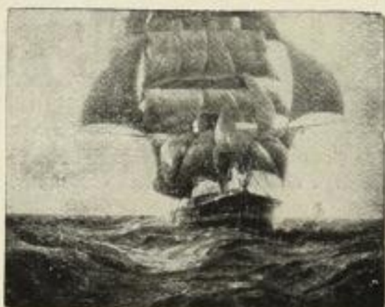
Nr. 188. Petersen: Hochsee. 71×92 cm M. 90.—