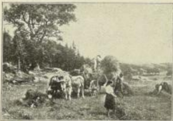
Nr. 58. Meyerheim: Heuernte. Bild 61 1/2 x 88 1/2 cm . . . M. 90.— (Gegenstück zu Flückel: Harzlandschaft)