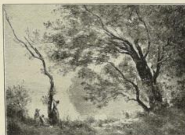
Nr. 231. Corot: Frühlingsmorgen. Bild 50×68 cm, Rand 73×96 cm M. 60.—