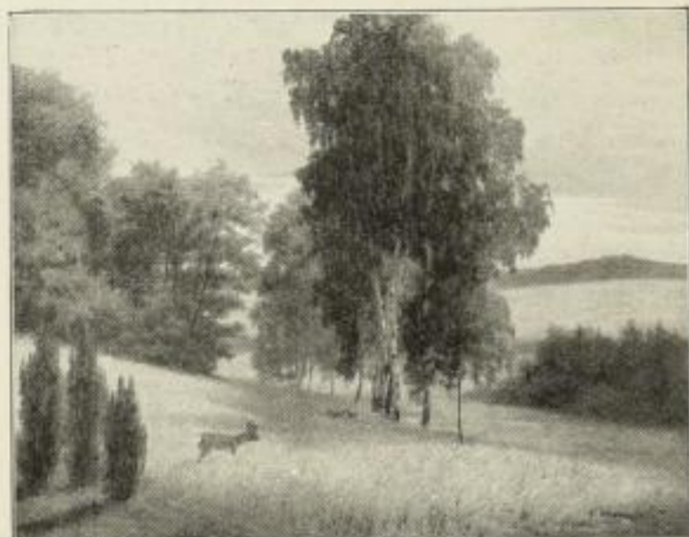
Nr. 266. Marschall: Maienzeit 51×67 cm M. 60.—