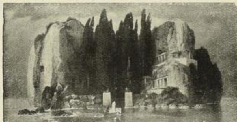
Nr. 146. Böcklin: Die Insel der Toten. Bild 35 1/2×68 cm, weisser Rand 57×86 cm M. 60.—