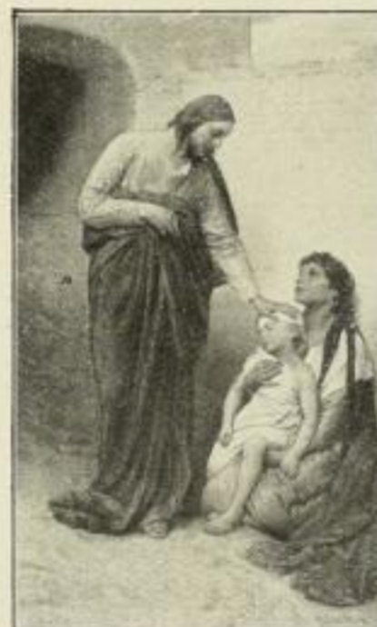
Nr. 262. G. Max: Jesus heilt kr. Kind Bild 42×73 cm, Rand 66×97 cm M. 60.—