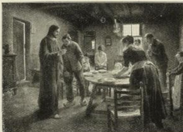
Nr. 271. Uhde: „Komm, Herr Jesus, sei unser Gast.“ Bild 50x68 cm, weisser Rand 72x94 cm M. 60,— Alte Pinakothek, München.