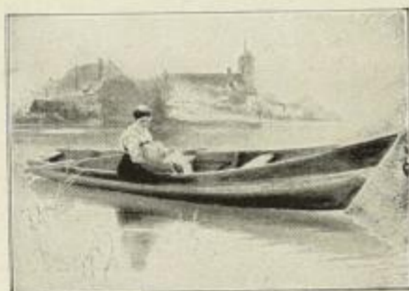
Nr. 192. Raupp: Friede. 63×92 cm M. 90.—