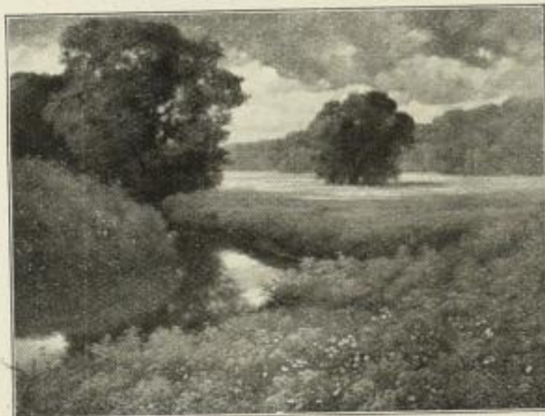
Nr. 272. Rüdisühli: Wiesenbächlein. 50x67 cm M. 60,—