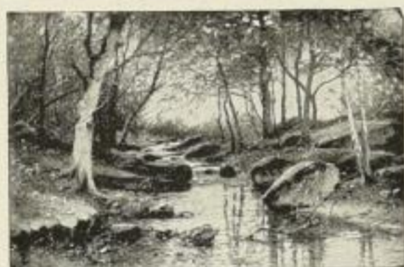
Müller-Kurzwelly: Herbstgold (Ilsetal) Bild 47×72 cm M. 60.—, Bild 33×51 cm M. 30.—