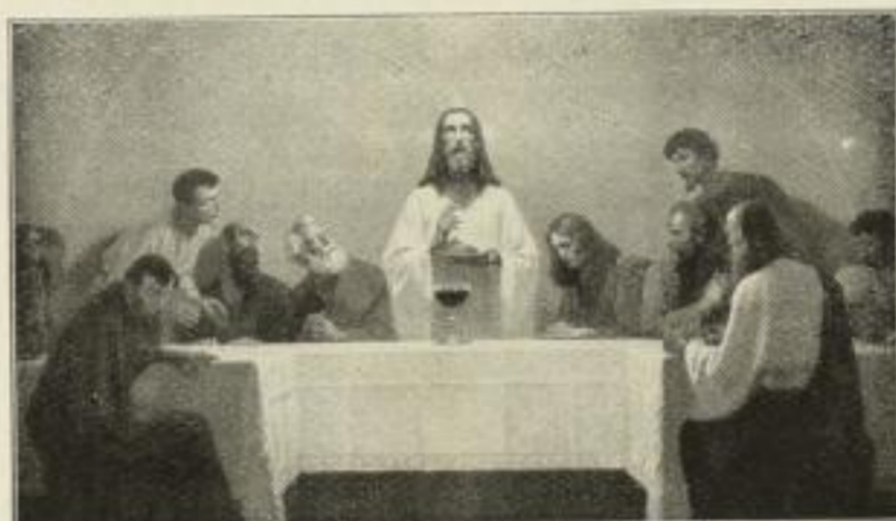
Nr. 193. Fugel: Abendmahl. 57½×100½ cm M. 90.—