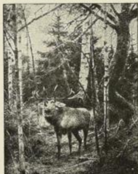
Friese: Rothirsch (Rominten) Nr. 52. Bild 53×69 cm M. 60.— Nr. 52a. Bild 34×44 cm M. 30.—