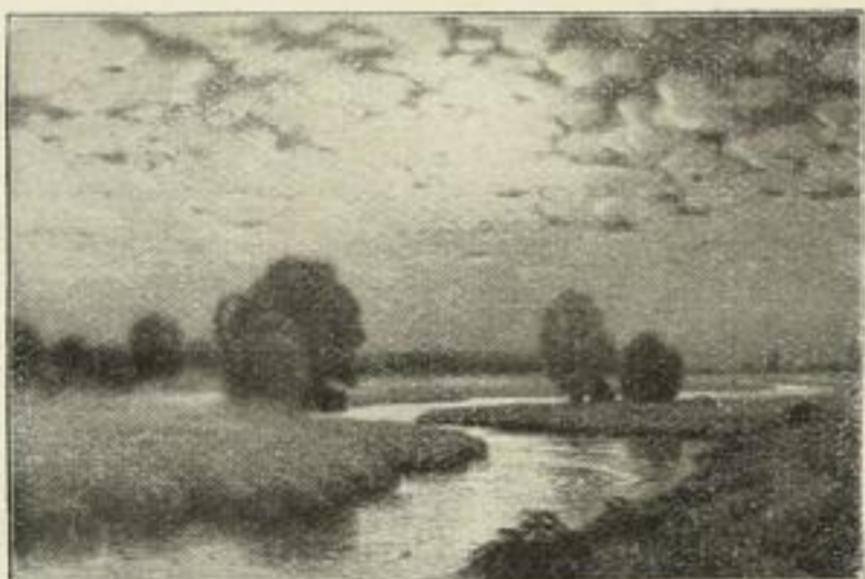
Nr. 214. Hans Hartig: Mondnacht. Bild 47×70 cm, Rand 73×98 cm M. 60.—