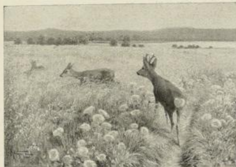
Nr. 212. Wagner: Rehe. 52×75 cm M. 60.—