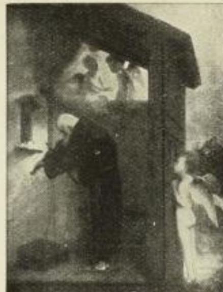
Nr. 81. Böcklin: Eremit. 48×63 cm . . . . . M. 60.—