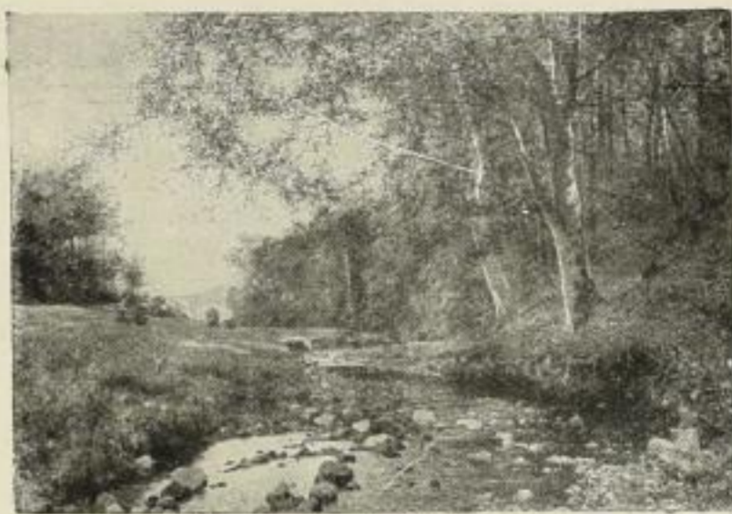
Nr. 138. Flickel: Harzlandschaft. 63×90 cm M. 90.—