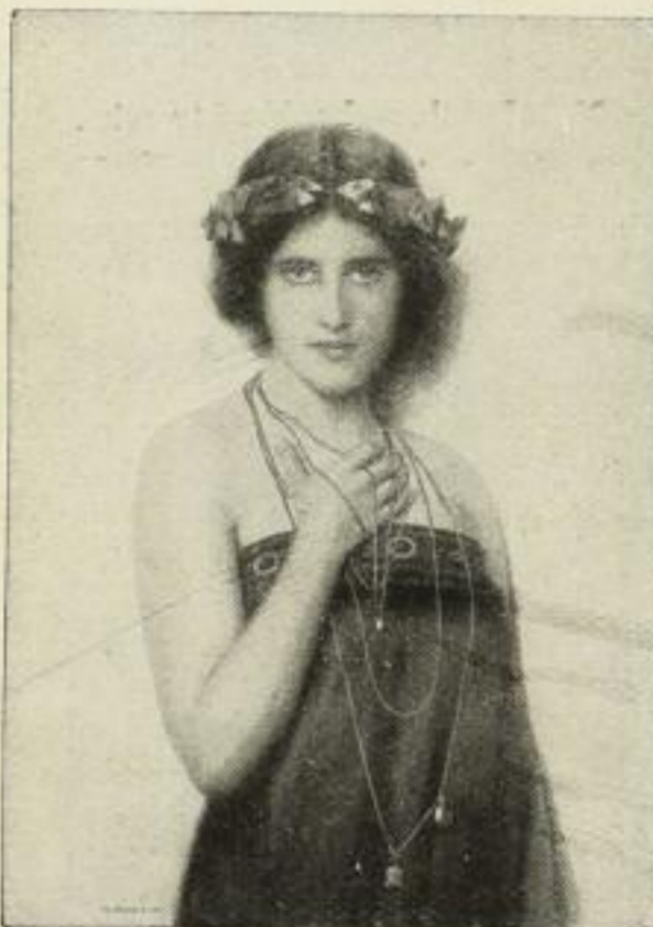
Nr. 180. Nonnenbruch: Jugend. Bild 44x63 cm, Rand 72x97 cm M. 60.—