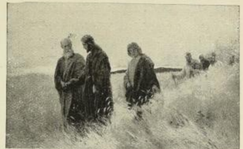
J. R. Wehle: Und sie folgten ihm nach. Nr. 137. Bild 47×74 cm . . . . . M. 60.— Nr. 137a. Bild 34×54 cm, Rand 55×72 cm M. 30.— Nr. 137b. Bild 20×31 cm, Rand 40×51 cm M. 15.—