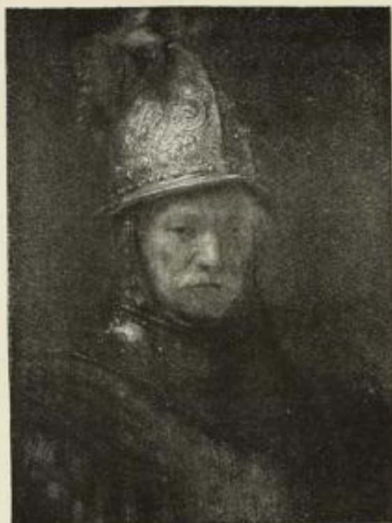
Nr. 292. Rembrandt: Mann mit Goldhelm. (Kaiser-Friedrich-Museum, Berlin) Bild 50x67 cm . . . M. 60,—