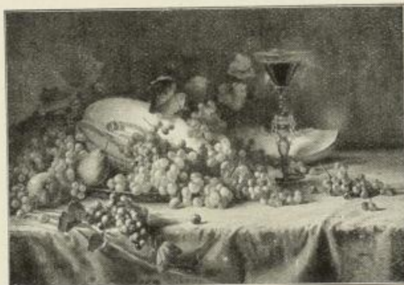
Nr. 133. Carstens: Stilleben 60x87 cm M. 90,—