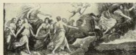
Nr. 115. Guido Reni: Aurora. Bild 35×84 cm . . . . . M. 60.—