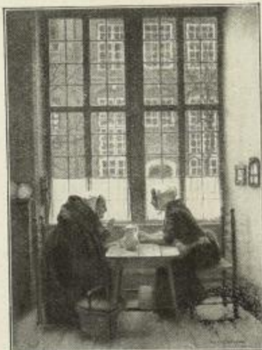
Nr. 229. Cl. Meyer: Nachbarinnen. 51x70 cm M. 60,—