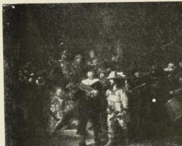
Nr. 198. Rembrandt: Nachtwache. 73x88 cm . . . M. 120,—