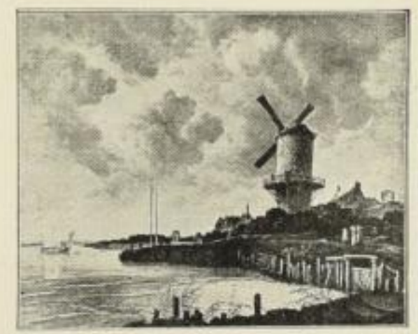
135. Ruisdael: Windmühle. 72×90 cm M. 120.—