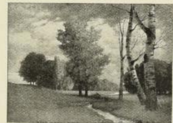
Nr. 194 Rüdissühli: Herbsti. Wiesengrund. Bild 50x69 cm, Rand 73x97 cm M. 60.—