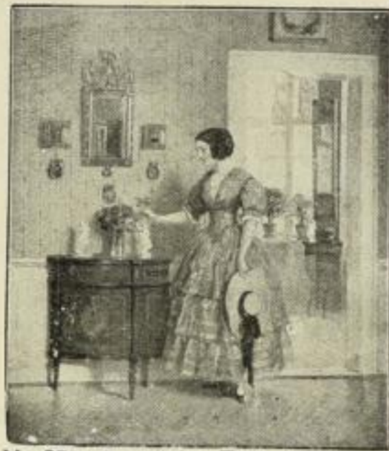
Nr. 273. Bayerlein: Tage der Rosen. Bild 43x51 cm, Rand 61x73 cm M. 30.—