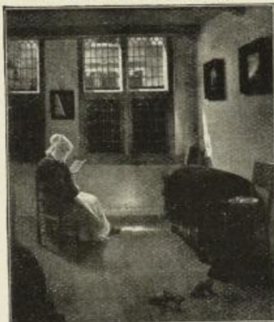
Nr. 245. P. de Hooch: Holländische Wohnstube. Bild 52x63 cm . . . M. 60,—