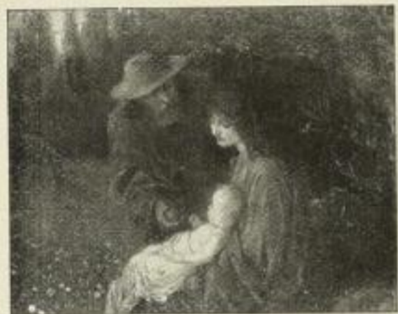
Nr. 195. Zimmermann: Ruhe. 58×72 cm M. 60.—