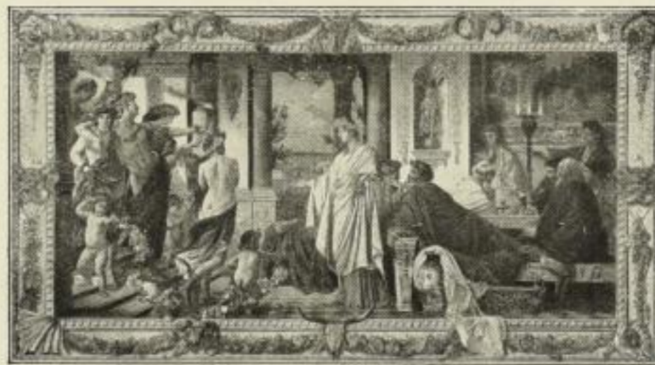
274. Feuerbach: Gastmahl des Platon. 51×94 cm M. 90.—