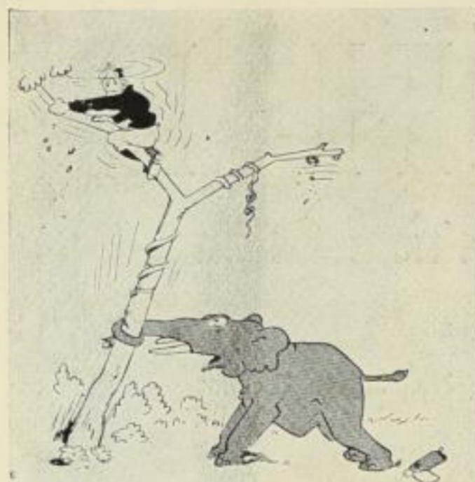
Doch in den Ästen kaum abgeragt, Macht ihm das Nütteln neue Sorgen.