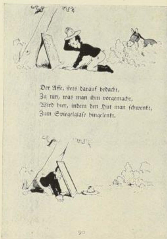
Der Affe, stets darauf bedacht, Zu tun, was man ihm voraemacht, Wird hier, indem den Hut man schwenkt, Zum Schwätzlatsche hingelent.