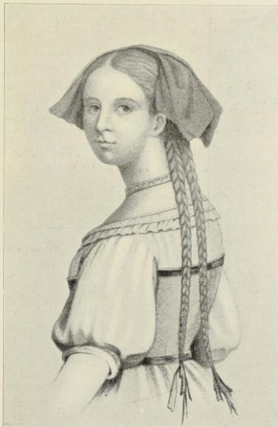
Das sogenannte falsche Friederikenporträt