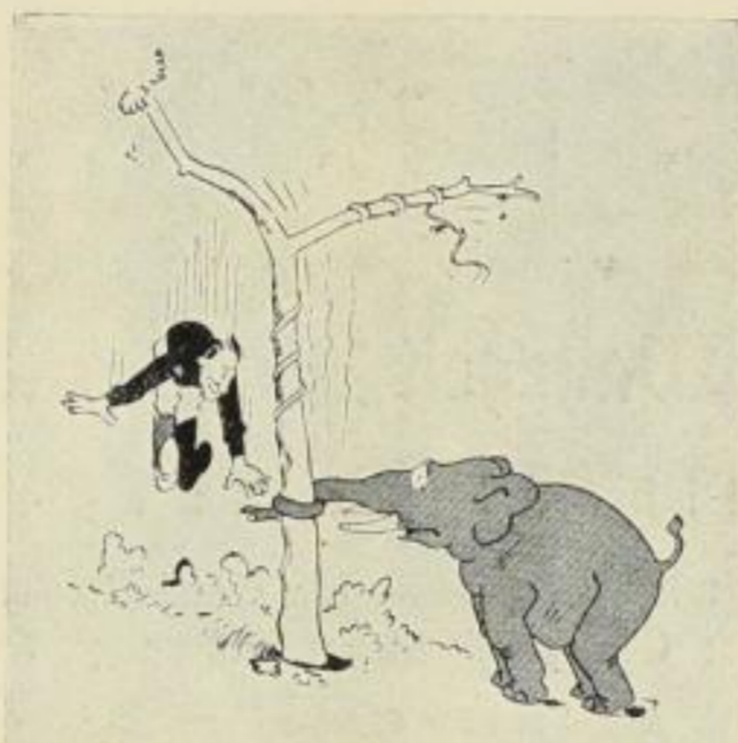
Im Fallen aber greife bebende Die Hand hier nach dem Nüttelnde.