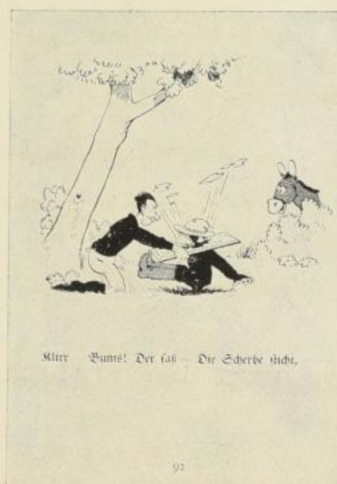
Alter Punkt! Der sah — Die Scherbe nicht.