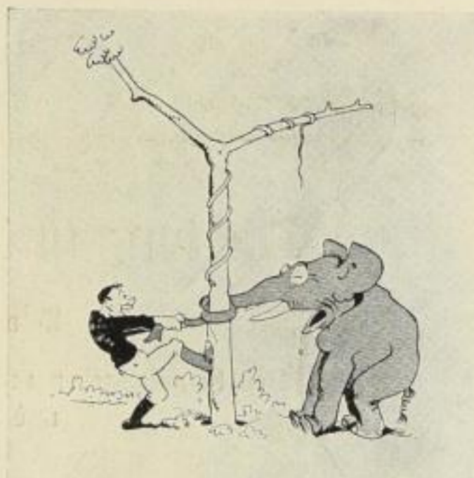
Ein Aneken wurde rasch geschürzt, Der Elefant ist sehr bestürzt.