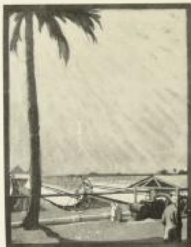
Das Sonnenkraftwerk bei Meadi (Verkleinerte Wiedergabe einer farbigen Tafel)

Kultur der Technik. Ein Wurf zum Geleit. — Quer durch den Lötschberg. Die Wunder der ersten Alpenbahn. — Im Eisenwerk. — Im Meer hinab. Die Entwicklung der Taucherei. — Die Heissdampflokomotive. — Im Stillwerk. Die Erfindung der Eisenbahnsicherungen. — Schnellverkehr im Dvahl. — Mensch und Maschine. — Das Geheimnis der Metallfadenlampe. — Die Eroberung der Wüste. — Das höchste Haus der Welt. — Zum Gipfel der Jungfrau. — Der grösste Bahnhof der Erde. — Sternspeker von einst und heute. — usw. usw.