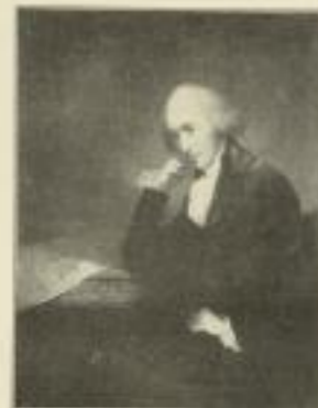
James Watt (Verkleinerte Wiedergabe eines ganzseitigen Porträts)