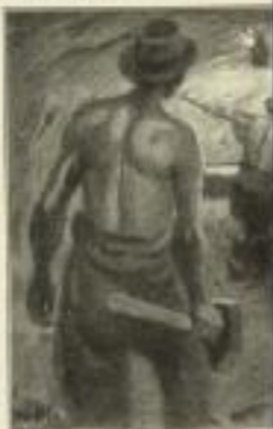
Im Richtigstollen (Verkleinerte Wiedergabe einer farbigen Tafel)

schriebenen Einzeldarstellungen an der Hand eines äusserst reichen, mit grösster Sorgfalt zusammengestellten Grundlagentextes wie etwa „Die Technik im XX. Jahrhundert“, ebensowenig ein Buch der Erfindungen und Erfindungen, das nur für den Fachmann Interesse haben, sondern