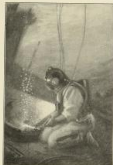
Taucher im schlauchlosen Tauchapparat (Verkleinerte Wiedergabe einer farbigen Tafel)