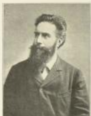
Wilh. Konrad Röntgen (Verkleinerte Wiedergabe eines ganzseitigen Porträts)

In 20 Lieferungen mit 20 farbigen Tafeln und mehreren hundert Bildern im Text