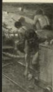
Im Bergtunnels (Verkleinerte Wiedergabe einer farbigen Tafel)

Wegweiser über den Ozean. Dieiselkompass, Unterwasserschiffsignale. — Selbsttätige Leuchtfeuer. — Die Eroberung der Luft. — Versunkene Schätze. — Das Sonnenkraftwerk Meadi. — Brückenbau. — Die Flamme als Säge. — Wasserkraftwerke. — Die Zählung des Nils. — Am hängenden Seil. — Vom Schwarzpulver zum Treiböl. — Kündliche Erdleuchte. — Der Kreislauf der Meeresströmungen. — Das Rheinfeldkabel. — Die Fesselung der Niagara. — Der Dananakanal. — Abfallverwertung. — 25 Jahre Radknoten. — usw. usw.