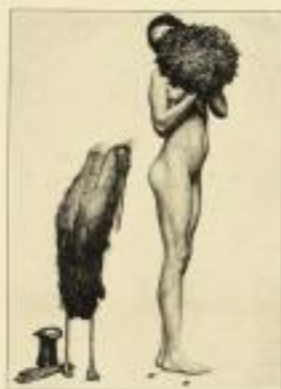
Auf Präsentstücken Original-Färbung Bildgröße 41,00 cm GM 25.-