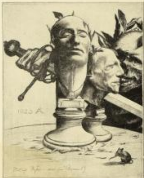
Was ist Recht — Was sind Namen? Original-Färbung