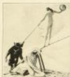
Auf der Schackel Original-Färbung - Bildgröße 21,00 cm GM 25.-