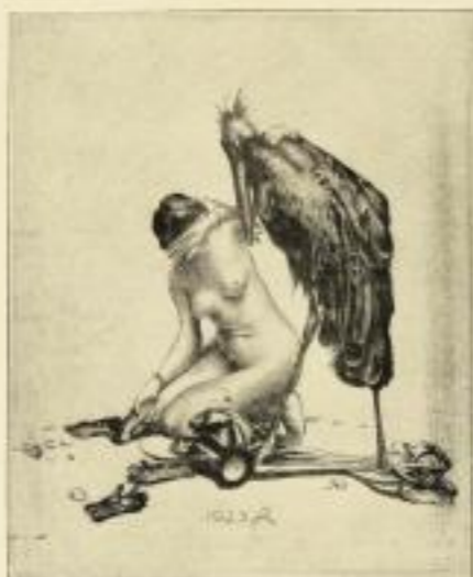
Das letzte Feind Original-Färbung