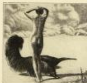
Wahre Arbeit — Original-Färbung - Bildgröße 21,00 cm GM 25.-