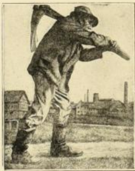
Hackenträger Original-Radierung · Bildgr. 60:47 cm GM. 30.-