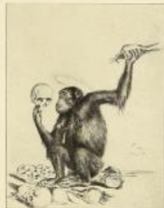
Encephalotransscopus (Hirnschädelbau) Original-Färbung - Bildgröße 20,00 cm - GM 25.-