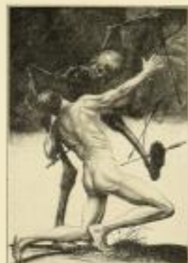
Totenkampf Original-Färbung - Bildgröße 41,00 cm GM 25.-