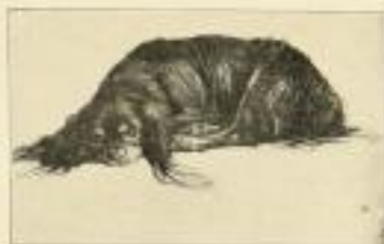
Mein Quack Original-Färbung - Bildgröße 21,00 cm GM 25.-