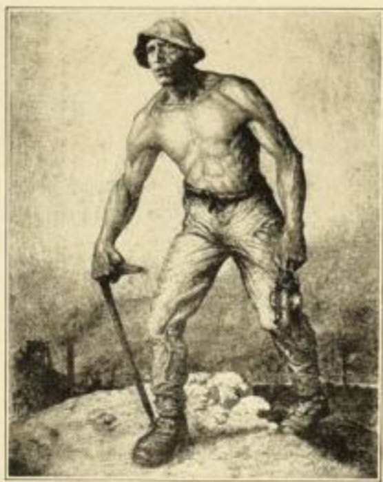
Grubenarbeiter Original-Radierung · Bildgröße 63,5:49 cm GM. 30.-