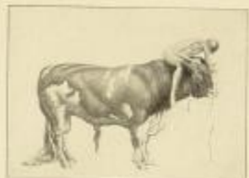
Die Stärkere Original-Färbung - Bildgröße 24,70 cm GM 25.-