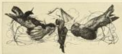
Einmal Original-Färbung - Bildgröße 21,00 cm - GM 25.-