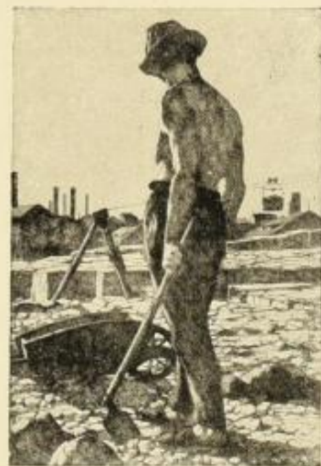
Ziegeleiarbeiter Original-Radierung · Bildgr. 58:39 cm GM. 30.-

Der Künstler hat den „arbeitenden Menschen“ in einer Reihe weiterer Blätter dargestellt, von denen wir hervorheben möchten: Brückenbau - Im Hafen - Begegnung - Belehrung - Kartoffelschälerin à GM. 30.-