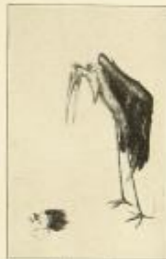
Eiferkracht Original-Färbung Bildgröße 21,00 cm GM 25.-