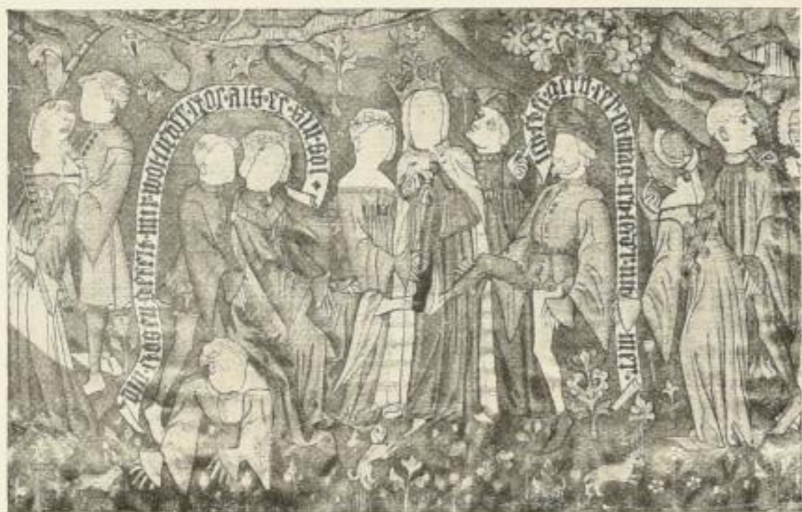
Aus R. F. Burckhardt: Gewirkte Bildteppiche des 15. und 16. Jahrhunderts in Basel.

Folioband in Ganzleinen oder Halbleder. 66 Seiten mit 55 Abbildungen, 25 farbige Lichtdrucktafeln. Preis 160 Goldmark.