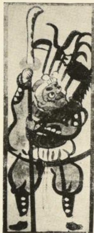
Aus Ernest Fenollosa: Ursprung und Entwicklung der chinesischen u. japan. Kunst, 2. Auflage. 2 Quartbände in Halbleder mit 260 Abbildungen auf 191 Tafeln, darunter 15 mehrfarbigen. 256 und 251 Seiten. Preis 80 Goldmark.