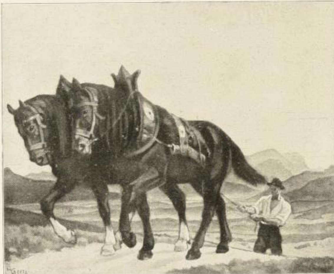
Nr. 409B. W. Georgi, Auf dem Heimweg. Farbenlichtdruck 53x66 cm. Ladenpreis Festmark 20.-