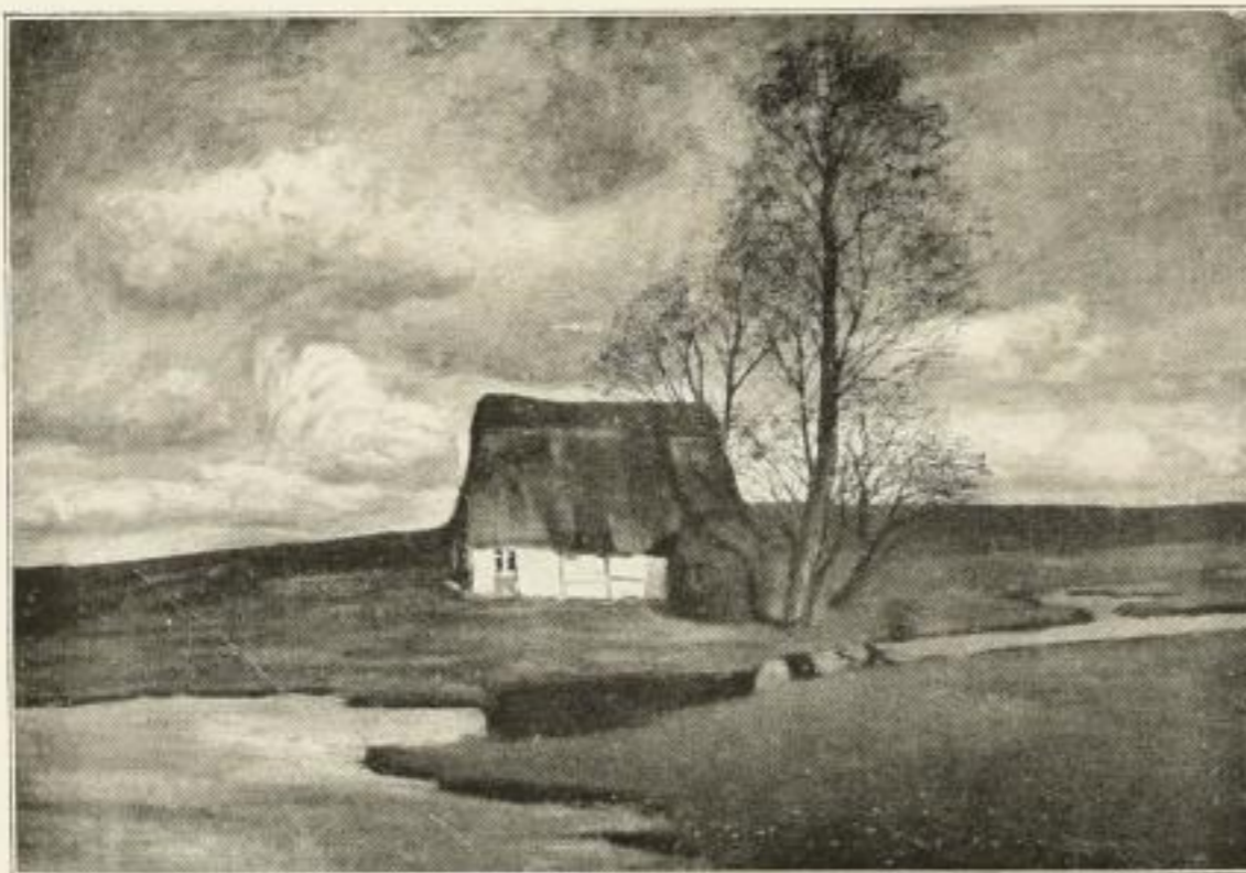
Nr. 410B. C. Vinnen, Haus im Moor. Farbenlichtdruck 49x72 cm. Ladenpreis Festmark 25.-