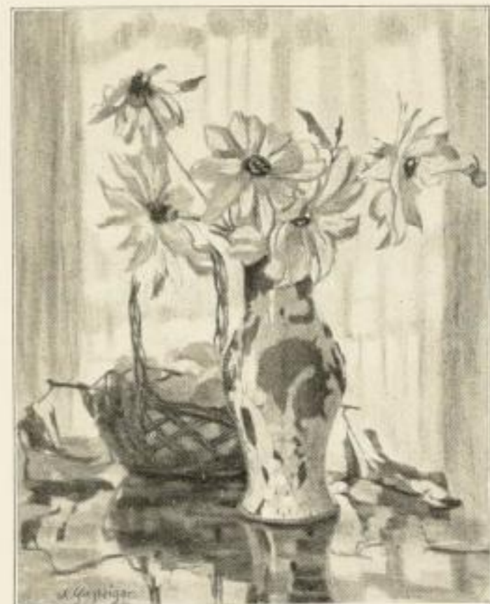
A. Gasteiger, Die rote Vase Nr. 436B. Farbenlichtdruck 51x39 cm. Ladenpreis Festmark 15.-