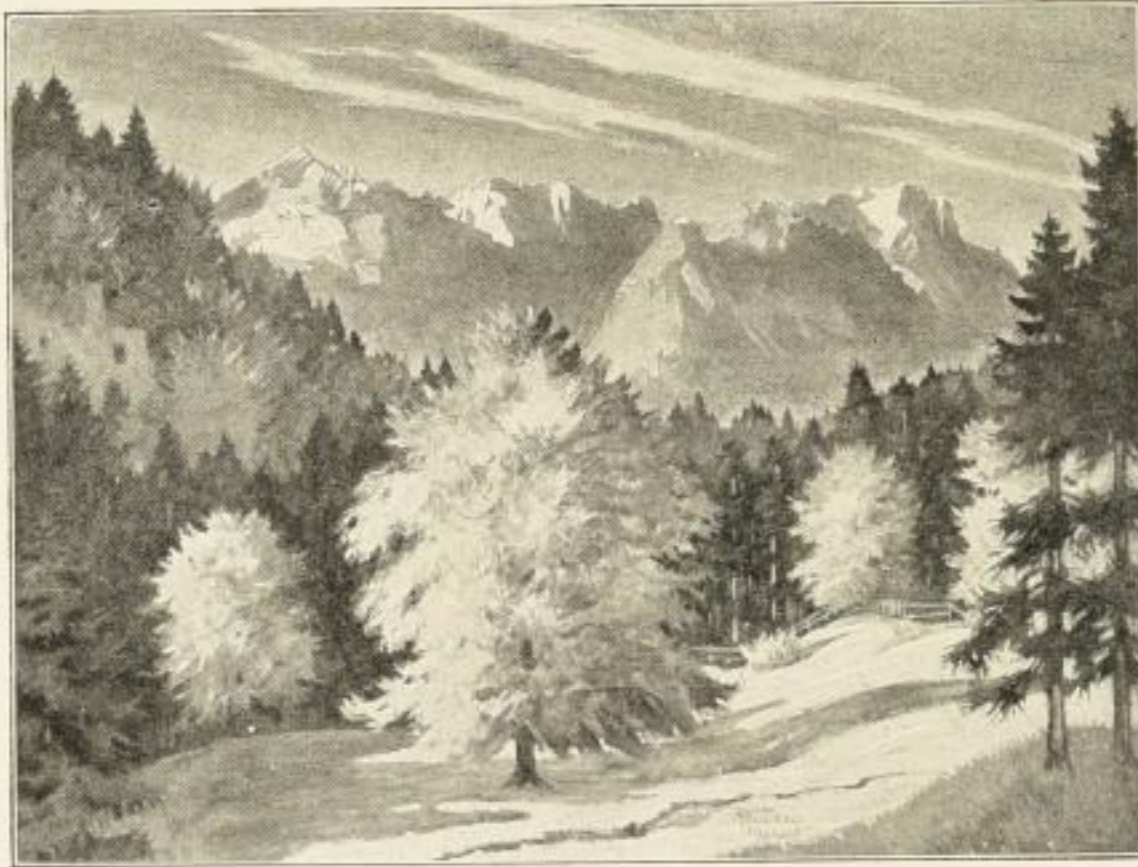
Nr. 412B. G. Niemann, Herbstes Zauber. Farbenlichtdruck 62x85 cm. Ladenpreis Festmark 30.-

1 Festmark = -24 $ U. S. A. Wiederverkäufer erhalten auf die angegebenen Ladenpreise 40% Rabatt, sowie Freixemplar 13/12