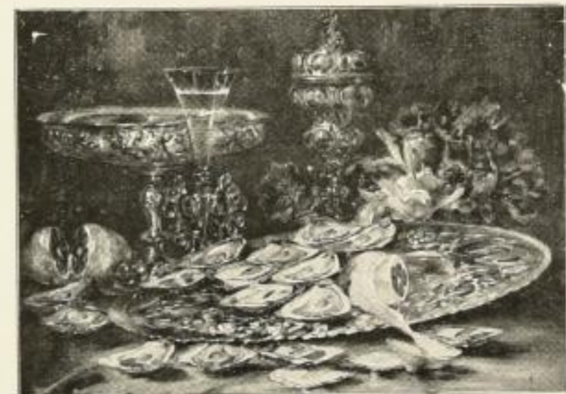
N. Schullheiss, Leckeres Frühstück Nr. 229B. Vierfarbendruck 30x42 cm. Ladenpreis Festmark 3.-

Otto Gustav Zehrfeld Kunstverlag Lelpzig Göschenstrasse 1. Auslieferungslager in Berlin Neukölln Berlinerstr. 32 Rahmenfabrik Tel. Neukölln 4540