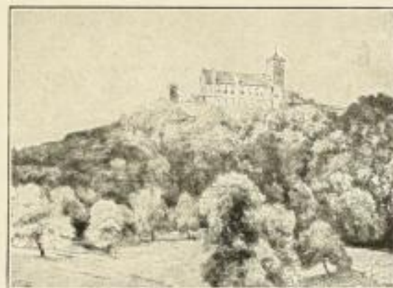
No. 70: Wartburg

Aus Wachsmuth, „Märchenbilder“ Bildgrösse 75×55 cm, Preis ord. 3 Gm.